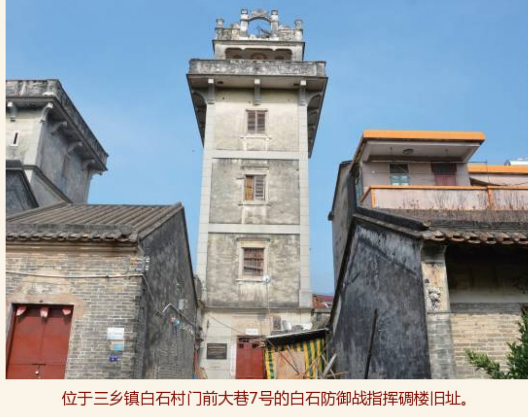
位于三乡镇白石村门前大巷7号的白石防御战指挥碉楼旧址。

1945年2月28日凌晨，日军出动步兵一个中队100多人、炮兵一个中队80人，配山炮一门，在伪军黄祥（译名黑骨祥）、萧天祥部200余人的配合下，联合向驻扎在白石村的珠纵一支队进攻。