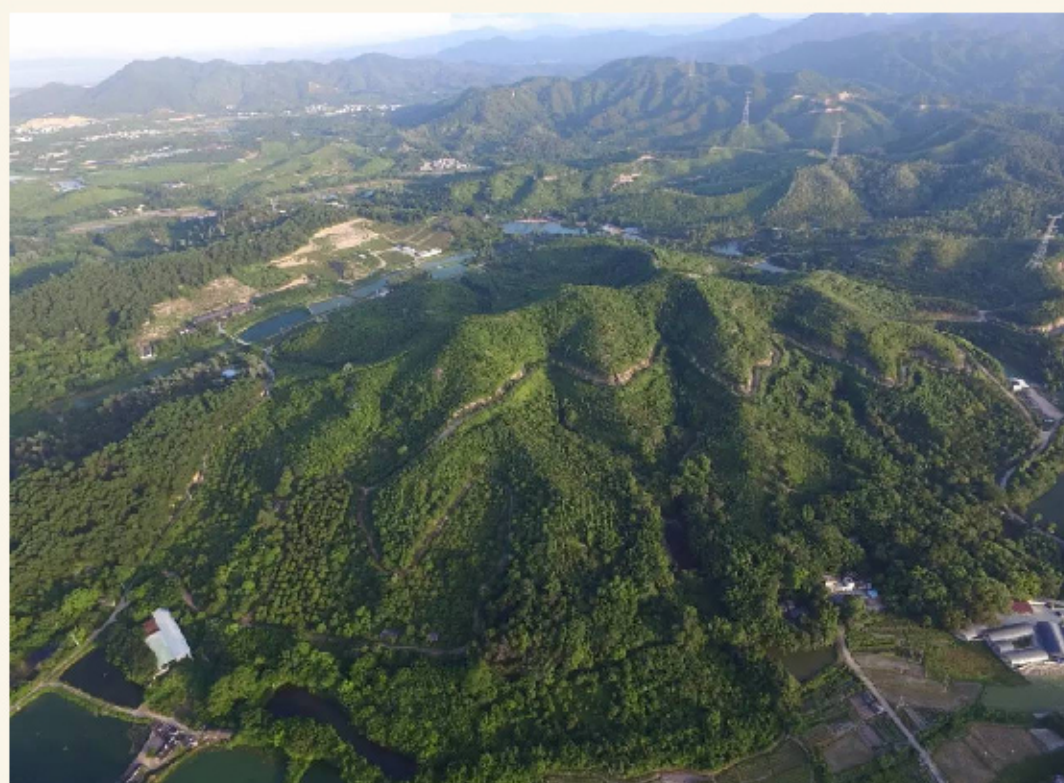
三山虎山

1945年5月8日深夜开始，日军1000多人、伪军第43师2000多人和萧天祥、梁雄部等近1000人，共4000多人分六路进入五桂山抗日根据地“扫荡”。