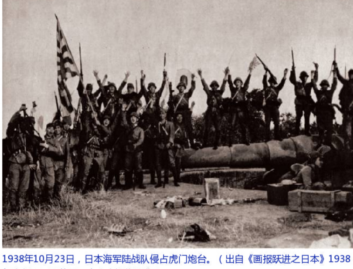
1938年10月23日，日本海军陆战队侵占虎门炮台。