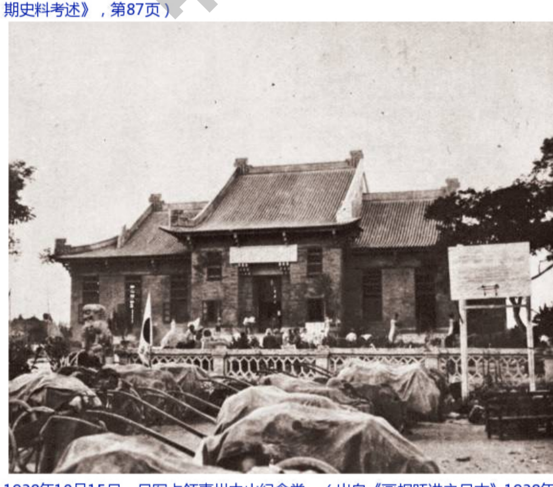
1938年10月15日，日军占领惠州中山纪念堂。（出自《画报跃进之日本》1938年广东汉口陷落号，中山市博物馆藏）