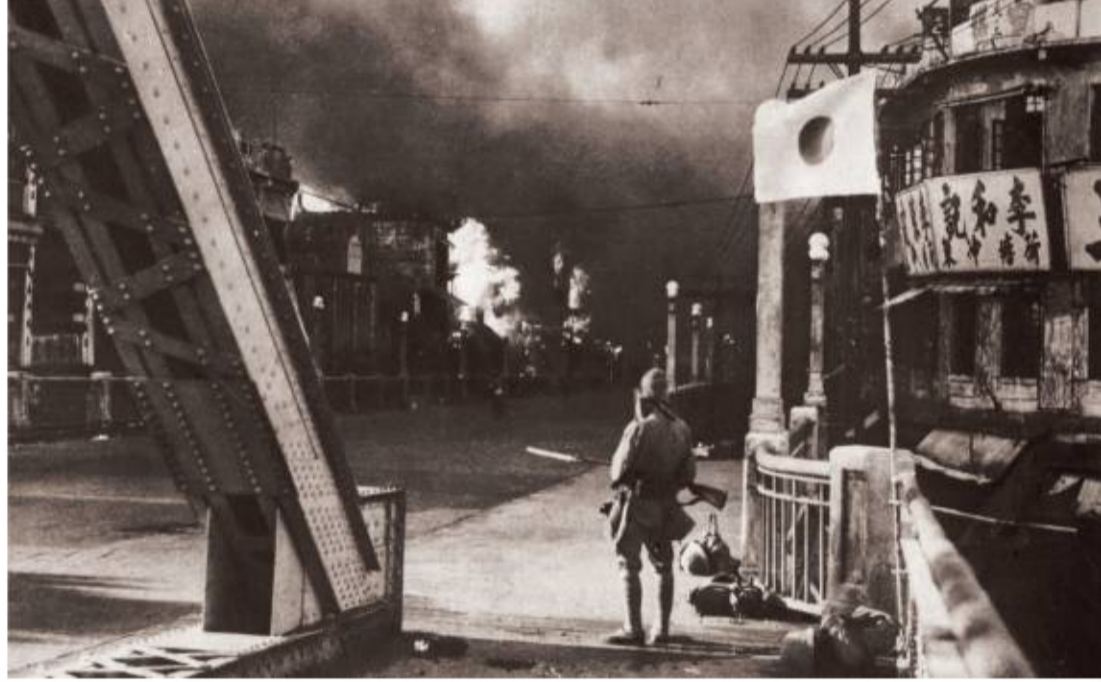
1938年10月21日，日军侵占广州海珠桥。（出自《画报跃进之日本》1938年广东汉口陷落号，中山市博物馆藏）