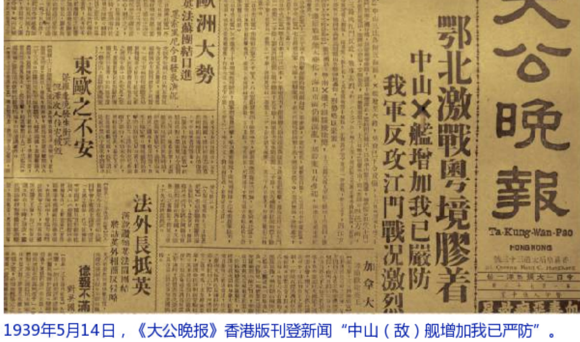
1939年5月14日，《大公晚报》香港版刊登新闻“中山（敌）舰增加我已严防”。（中山市博物馆藏）