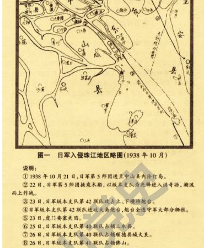
1938年10月，日军入侵珠江地区示意图。（出自《中山文史》第47辑《中山抗战初期史料考述》，第87页）

1939年1月1日，中共广东省委在韶关召开第四次执委扩大会议，传达贯彻中共中央六届六中全会精神。会议确定广东党组织四大任务：一是广泛开展敌后游击战，配合正规军打击敌人；二是扩大动员组织群众；三是建立统一战线精诚团结的范例；四是建立强大的党的基础。