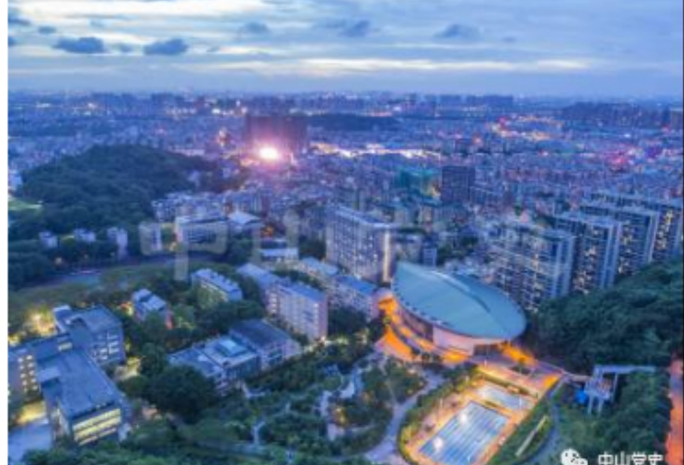
今日中山学院。