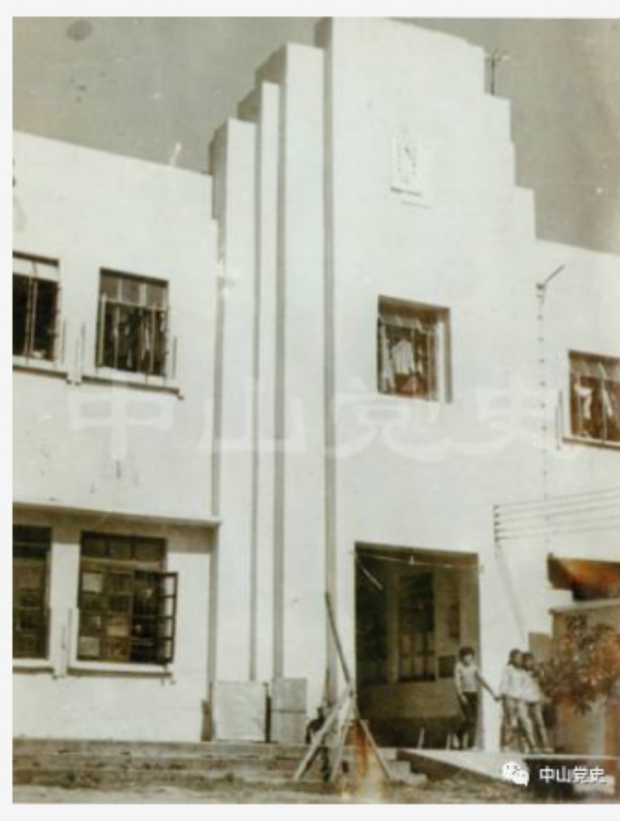
中山白石楼一中（后名为中山市第一中学）南校舍，中山电大初办时曾借用这里的教室教学。

在那个年代，中山和全国各地一样，师资严重缺乏，特别是大学老师更加稀缺，于是，通过电视播出教学节目，让全国各地的学员都能通过收看电视课程来上课，是当时十分有效的高等教育普及手段。每个县市的分校，只需配备辅导老师，学员们每学期课程结束后，参加统一考试来验证学习质量。考试很严格，能过的都是实力杠杠的。