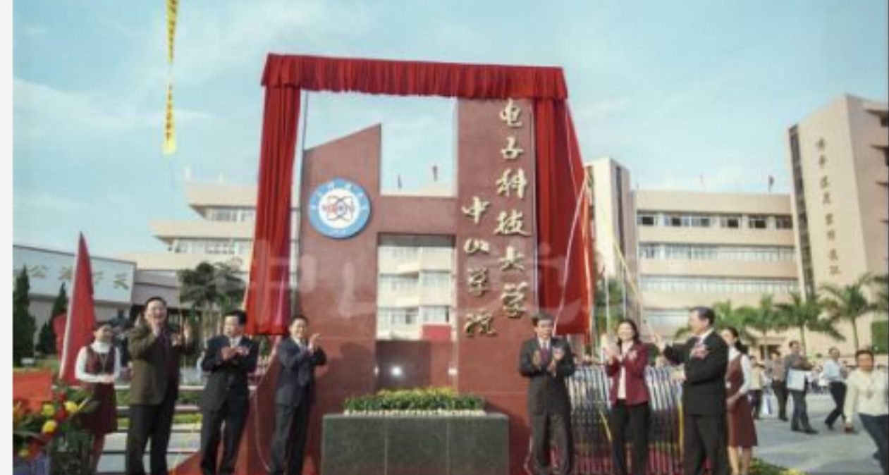
2002年6月15日，中山学院经国家教育部批准正式成为电子科技大学二级学院。9日，市政府与电子科技大学“关于建立电子科技大学中山学院的联合办学协议书”签署。12月6日，电子科技大学中山学院挂牌成立。

广东广播电视大学中山分校创办于1982年春，最初名称为佛山市广播电视大学中山分校。创办之初，上课的地点是中山白石楼一中的南校舍礼堂，1984年搬到石岐莲塘街良朋里（现在该区域已划入中山市人民医院），那里有新建的五层教学大楼一座，建筑面积2272平方米，图书馆有图书5000多册。在20世纪80年代，广播电视大学中山分校先后开设了文科、理科、工科、经济学科、外语等5个门类，包括汉语言文学、师专物理、师专化学、师专英语、机械制造、工业电气自动化、工业企业管理、商业企业管理、金融工业会计、商业会计、党政管理干部基础等12个专业，短短8年间累计招生共687人。