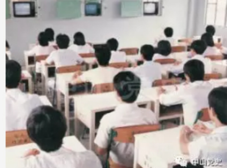
中山电大大学学生在上课

中山人能够在自己的家门口接受高等教育始于1982年。当时，中山县成立了广东广播电视大学中山分校，至1985年，中山大学孙文学院开办，这两所中山本土的大专院校，在改革开放初期培养了大批人才，缓解了各行各业对专业人才的饥渴。可能还有很多人会以为，广播电视大学是培养电台、电视节目主持人的，其实完全不是那么回事。