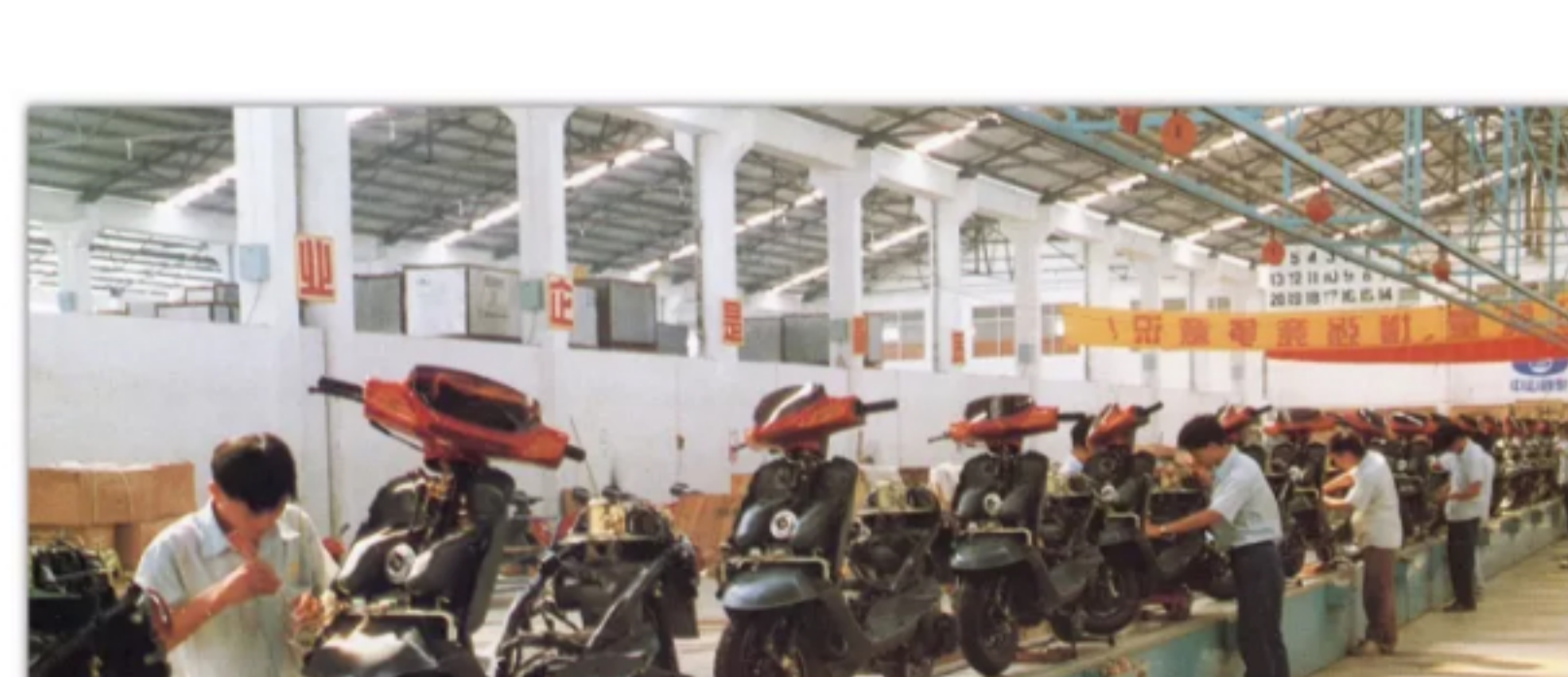
东升镇中山国驰摩托车实业公司摩托车装配车间

此外， 中山有过一家较大的摩托车生产企业。 20世纪90年代， 位于东升镇的中山国驰摩托车实业公司 还颇有知名度呢。