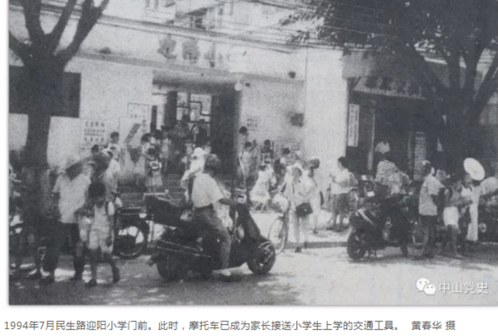
1994年7月民生路阳光小学门前，此时，摩托车已成为家长接送小学生上学的交通工具。

“ 摩托车曾承载了不少年轻人的梦想， 更让中山人的生活大大提速！ 还记得我们最早开的一代摩托车叫 ——“白猫”和“黑猫”吗？ 它们在80年代末90年代初， 非常有名哦—— 而且都是进口，一般人买不起。 还记得你是什么时候骑上摩托车的吗？ 下面，这些数据，帮你激活—— ”