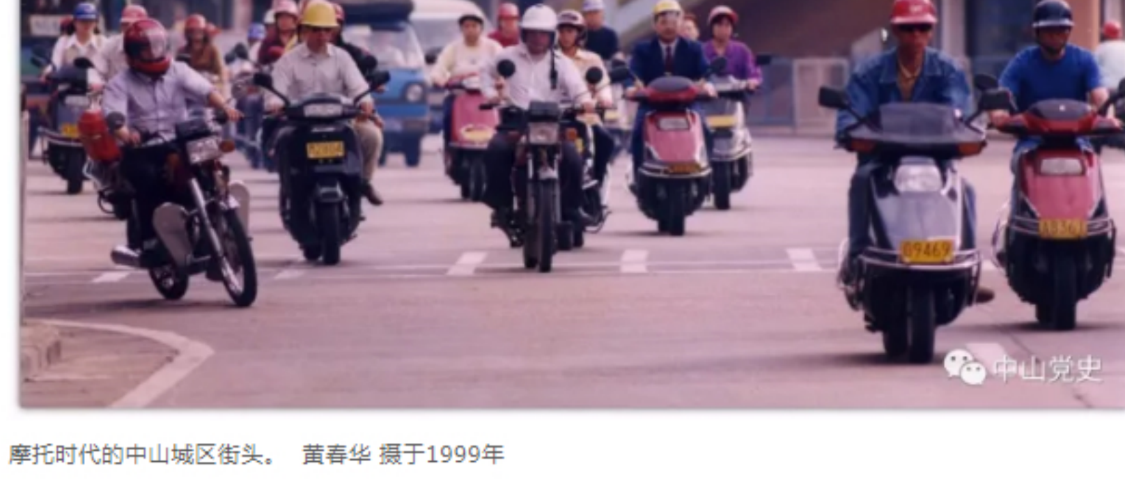
摩托时代的中山城区街头。 黄春华 摄于1999年

“ 摩托车曾承载了不少年轻人的梦想， 更让中山人的生活大大提速！ 还记得我们最早开的一代摩托车叫 ——“白猫”和“黑猫”吗？ 它们在80年代末90年代初， 非常有名哦—— 而且都是进口，一般人买不起。 还记得你是什么时候骑上摩托车的吗？ 下面，这些数据，帮你激活—— ”