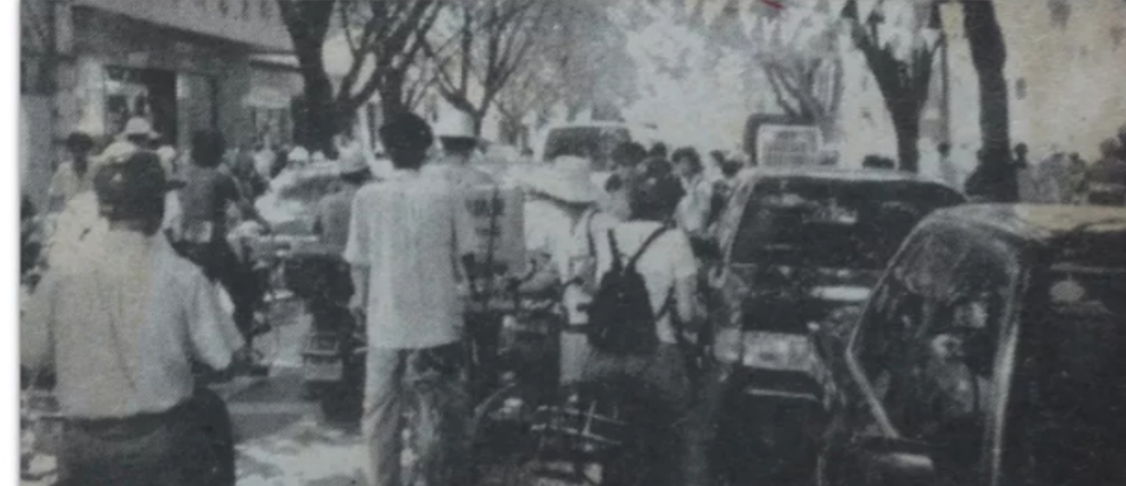
1996年7月民生路的一张照片，此时中山摩托车数量已创新高。

第二大因素是城市在不断扩大， 从花园新村、柏苑新村、 松苑新村到当时兴建中的竹苑新村， 城市向东推进了超过2公里， 骑行时间又多了10多分钟。 当年，街上汽车并不多， 骑摩托的安全度与现在相比高很多， 因此，“开单购车”成为了 人们出行升级的选择。