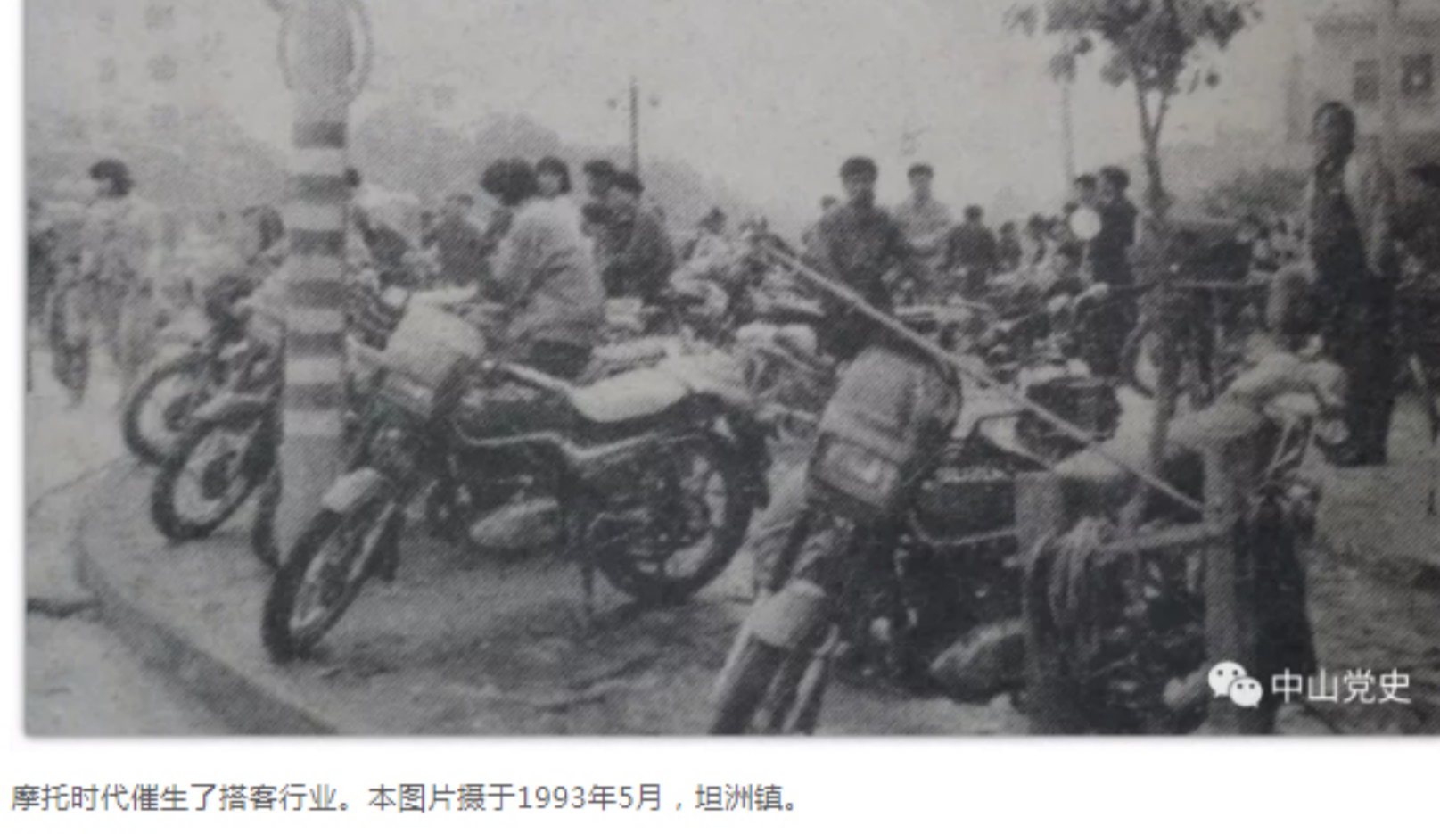
摩托时代催生了接客行业，本图片摄于1993年5月，坦洲镇。

有记者当年在人民医院门口 统计高峰期的摩托车数量， 平均每分钟流量达19辆， 其中11辆就是这种“绵羊”式摩托车。