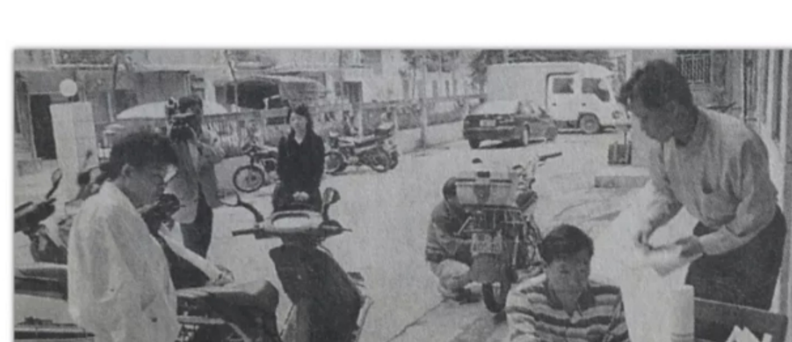
1997年，为减轻日益严重的摩托车废气问题，中山环保部门尝试用新技术来达到理想的处理效果。

随着摩托车的不断增多， 交通规则也严格了起来， 例如，骑车者、乘坐者都必须戴头盔。