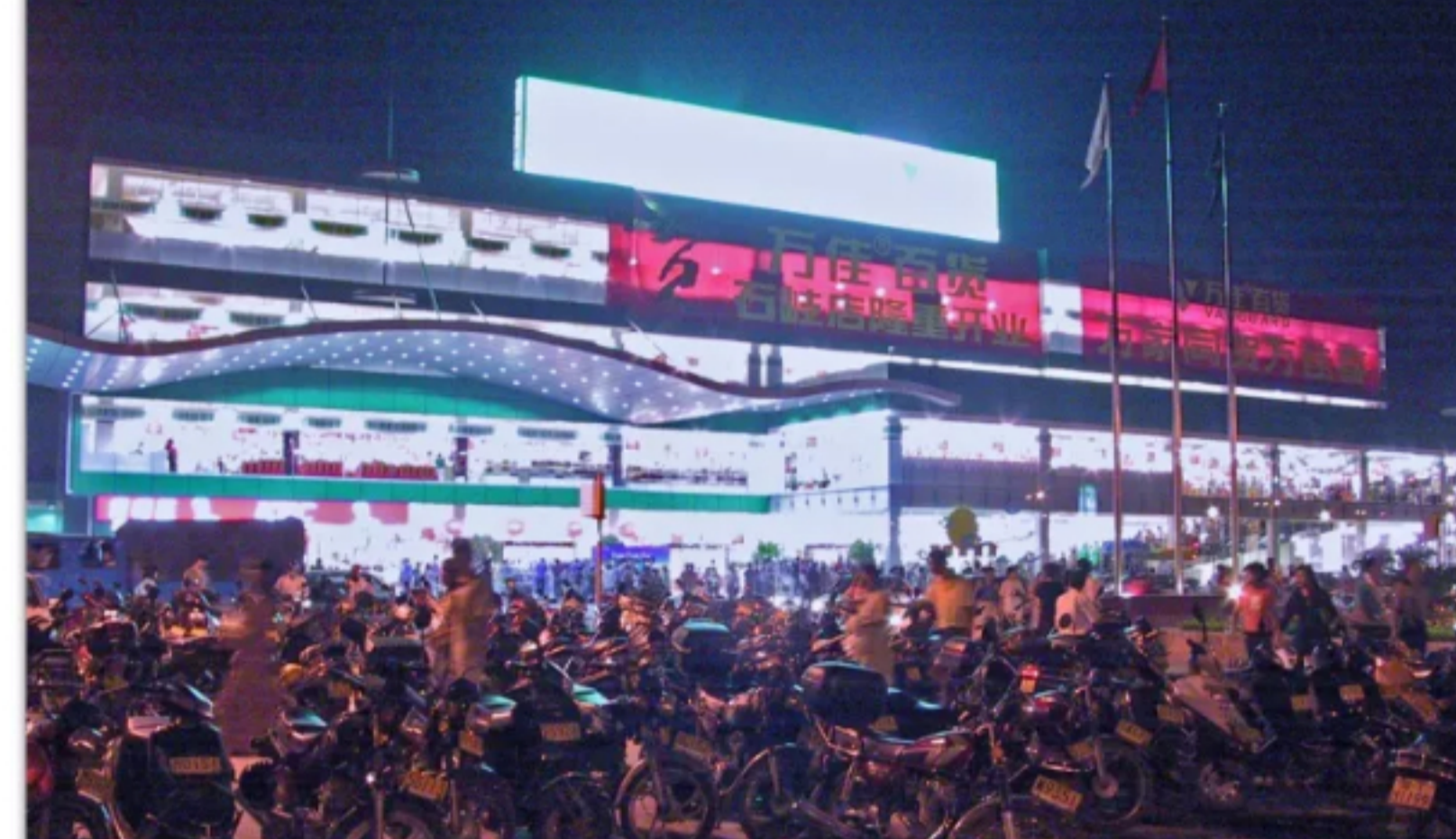
2001年9月，中山万佳百货店开业，门前的停车场停满了摩托车。

“白猫”“黑猫”， 就是指当时日本产的一种 体型和排量都较大的女骑摩托车， 统称为“大猫”； 还有另外一种90CC排量的稍小型“绵羊”， 被称为“细猫”。 此外，当时卖得较火的“绵羊” 还有日本产的“V100”、 台湾产的“名流”等。 几年后，广州产的“五羊本田”红火起来， 再后来，大批国产品牌纷纷冒起。 于是，经销摩托车的店铺突然兴旺起来。