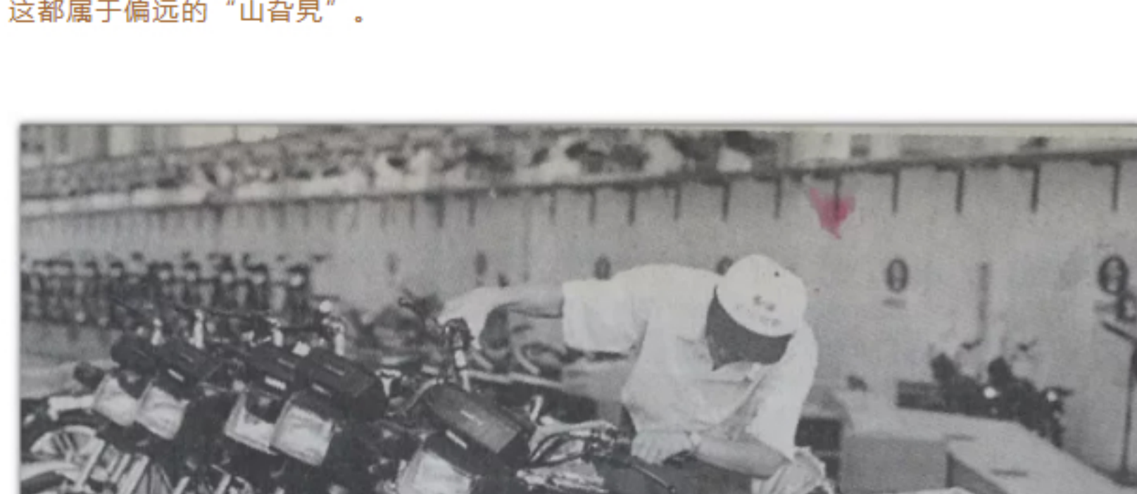
1997年，中山国驰摩托车实业公司已开发出十多个品种，产品畅销全国，还远销欧洲、南美、东南亚。

就在这“摩托时代”， 中山城区实现了向北扩片， 东明花园、东盛花园等片区 成为了中山人居住的新兴热门地。 东明大桥以北片区也开启了大开发模式。 在自行车时代， 这都属于偏远的“山脊线”。