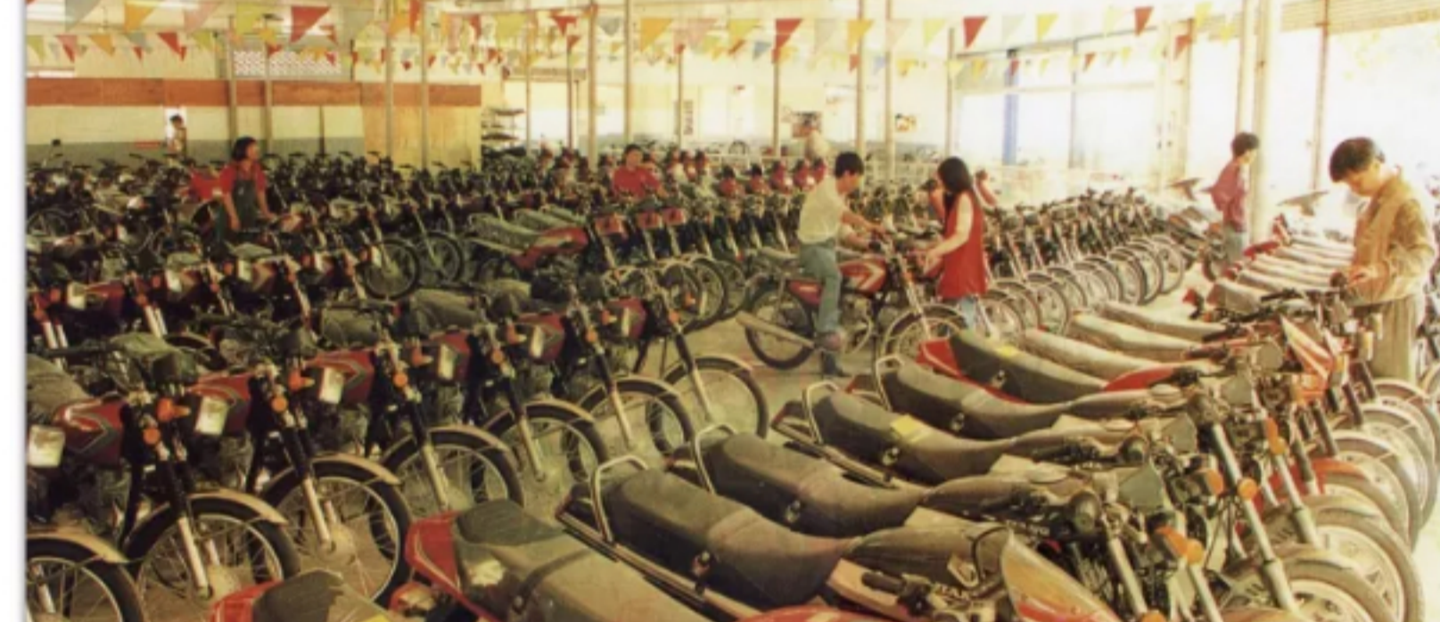
20世纪90年代中山的一家摩托车销售店

1992年6月， 全市已登记的摩托车经销单位已达53家， 连粮站都卖起了摩托车。 以中山市交通贸易公司为例， 1991年每月销售量只有四五十辆， 到了1992年就月销150多辆， 增长3倍； 高峰时一天售出18辆。