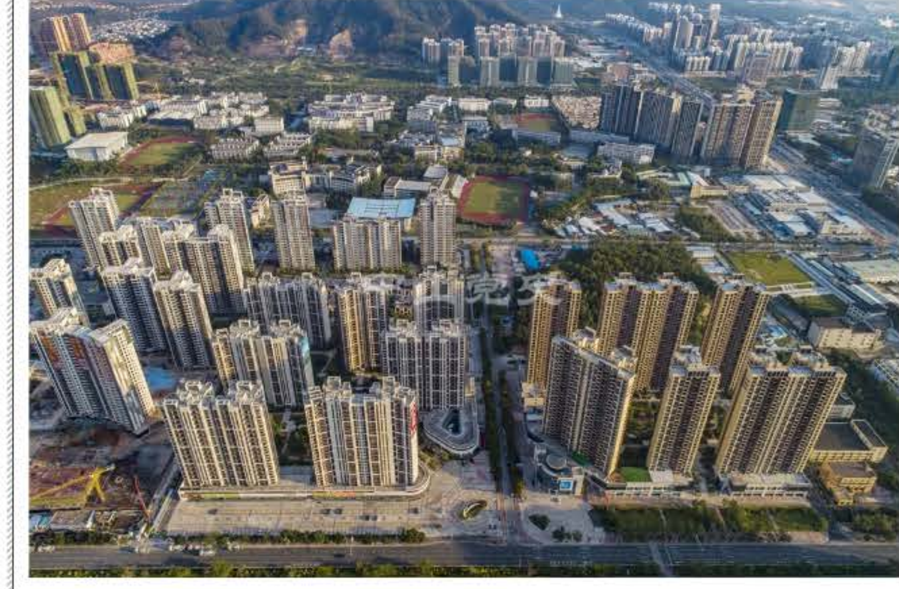
十年前，这里曾是一个柴油机发电厂。 莫春华摄于2018年10月

与此同时，随着国家大电网供电能力的提高，工厂缺电轮休、居民用蓄电池看电视、冰箱配备升压器、普通电脑配应急电源的情况成为了历史。