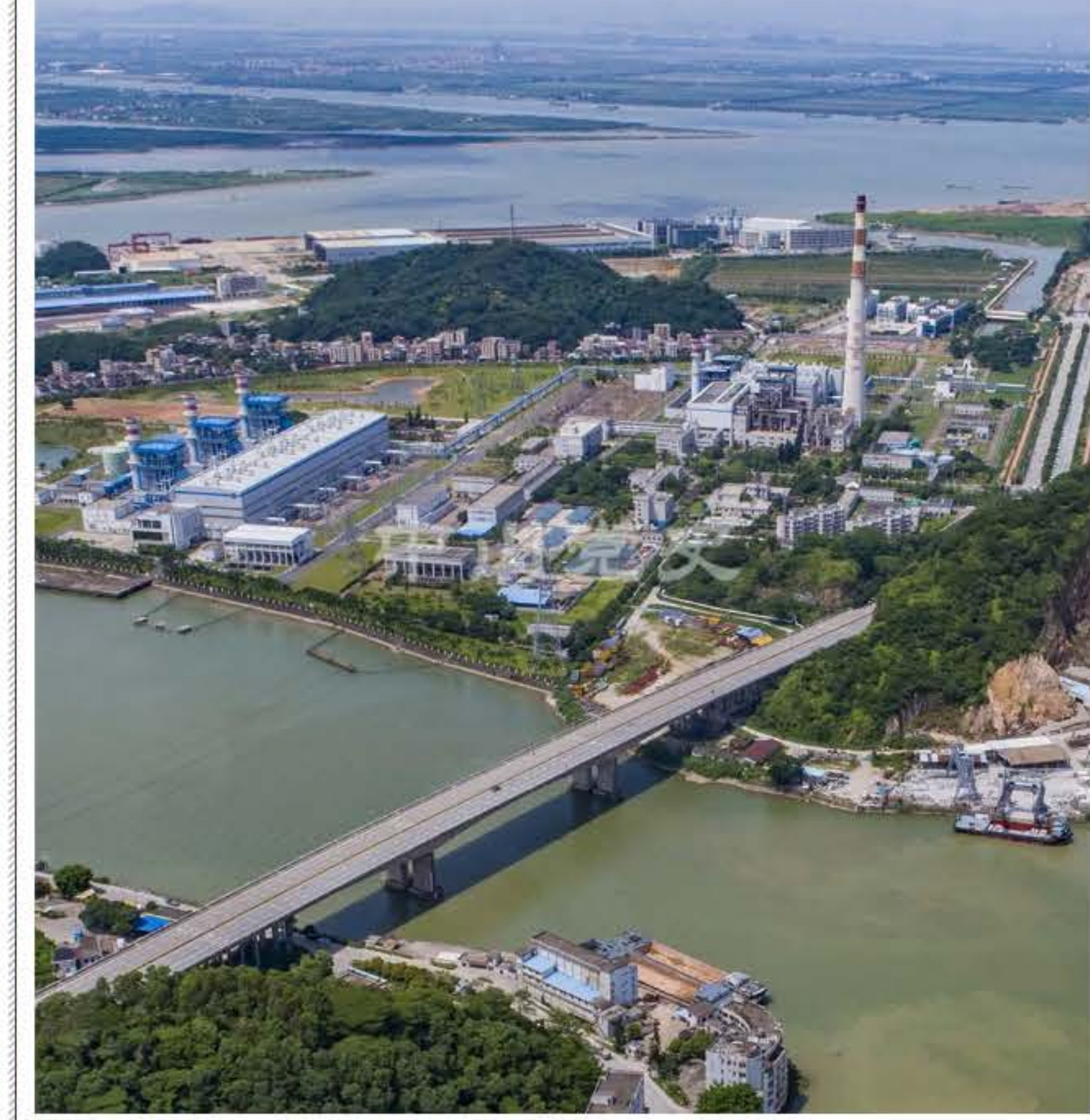
位于马鞍岛横门桥边的发电厂

至1990年，中山市自办电厂总装机容量达12.75万千瓦，占全市总供电量的67%，籍以参加省集资办电现电量和购进香港电力，有效地缓解了中山用电缺口，为中山经济发展提供了强有力的支持。