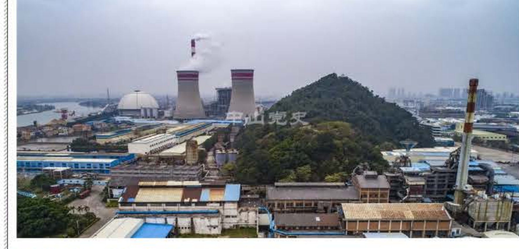
位于黄圃镇的中山火力发电厂

1985年8月，中山自筹资金首先办起了中山第一柴油机发电厂，其厂址位于今中山六路东方明都楼盘附近。该厂先后从日本、英国引进了四套柴油发电机组，年发电量可达1.5亿千瓦时，主要向石岐、张家边和长江宾馆供电。