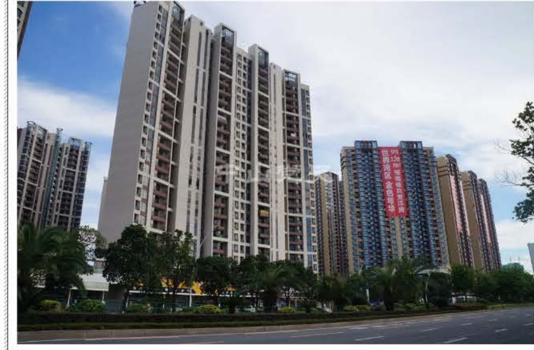
谁能想到十年前这里曾是一个柴油机发电厂吗？

社会的发展向电力建设提出了更高的效益和环保要求。为了进一步优化电力结构，提高能源利用效率，保护生态环境，从2004年开始，中山对横门电厂进行了扩建改建工程，实现发电燃料由燃油向清洁能源燃气的转换，在确保了全市用电的基础上，逐步关停了中山第一柴油机发电厂等七家燃油发电厂，向追求生态可持续发展迈进。