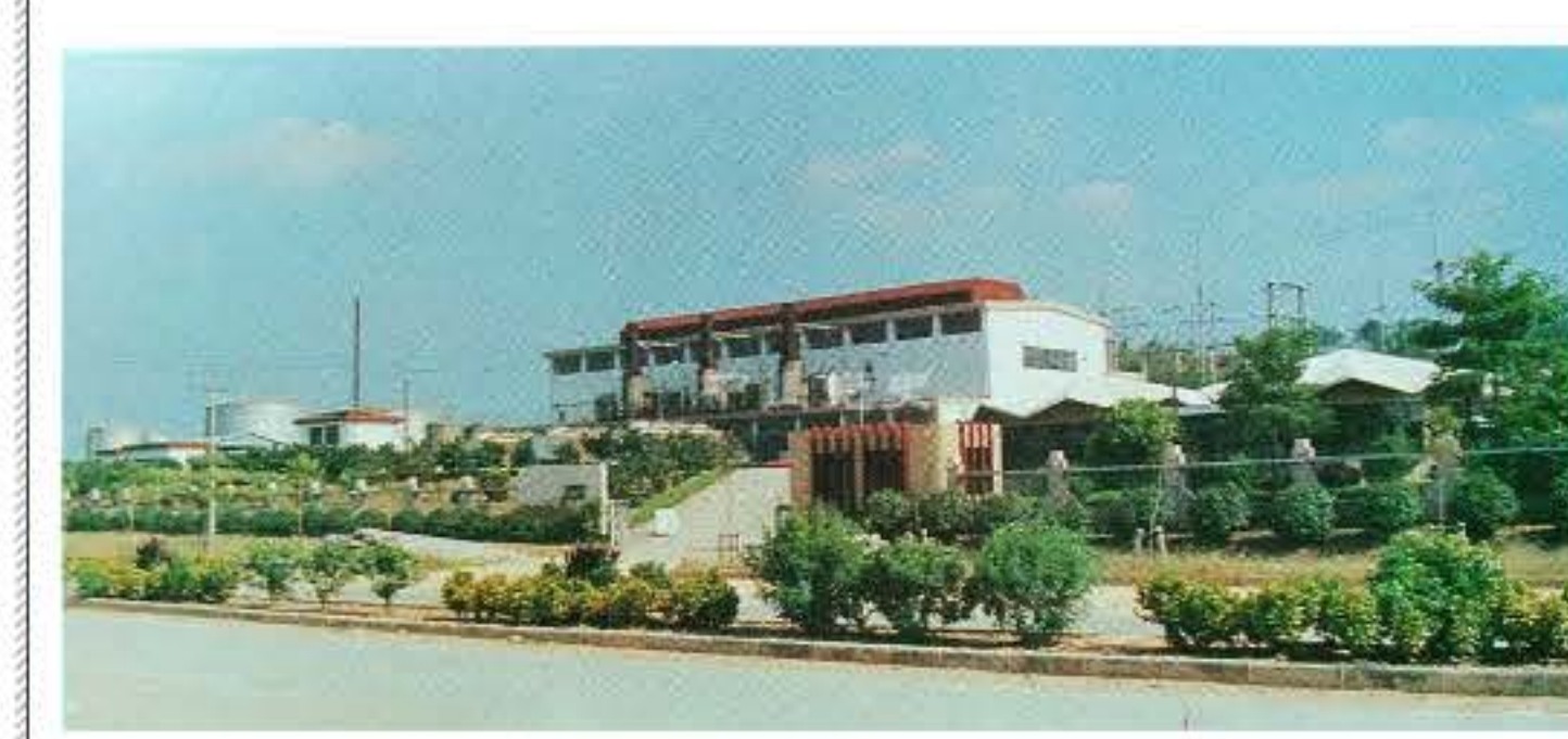
中山六路上的原中山发电厂（1988年）

1989年中山路命名时，中山一路至中山三路已相当兴旺，但中山六路两侧基本上还是农田和山野。