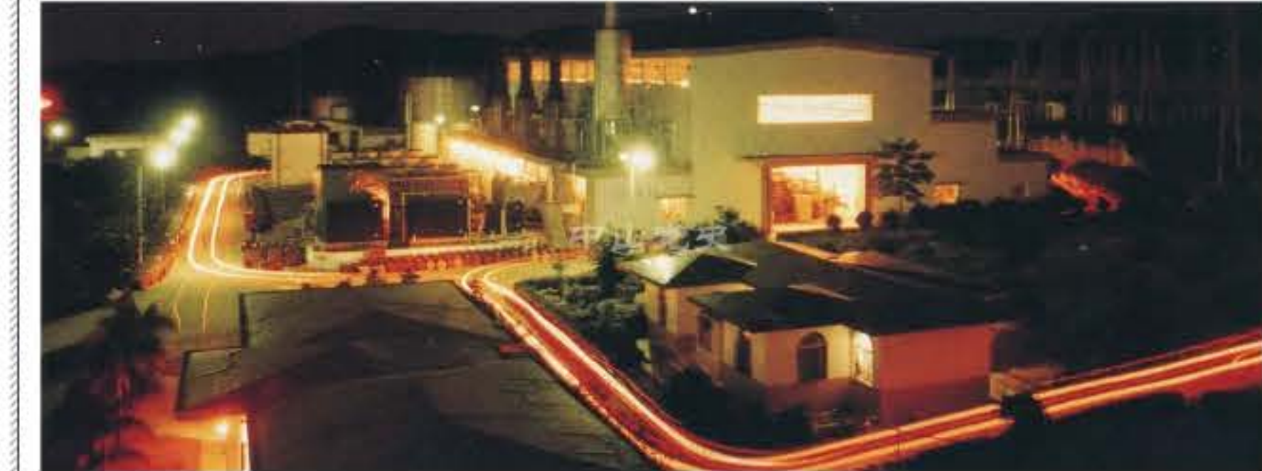
1986年建成的中山发电厂

早在20世纪70年代，中山就缺电达40%，工业用电被迫采取每周轮休2天的方式，有条件的工厂都自己发电缓解缺电矛盾。这一时期，中山县拆船公司从废旧远洋轮上拆下的发电设备十分畅销。