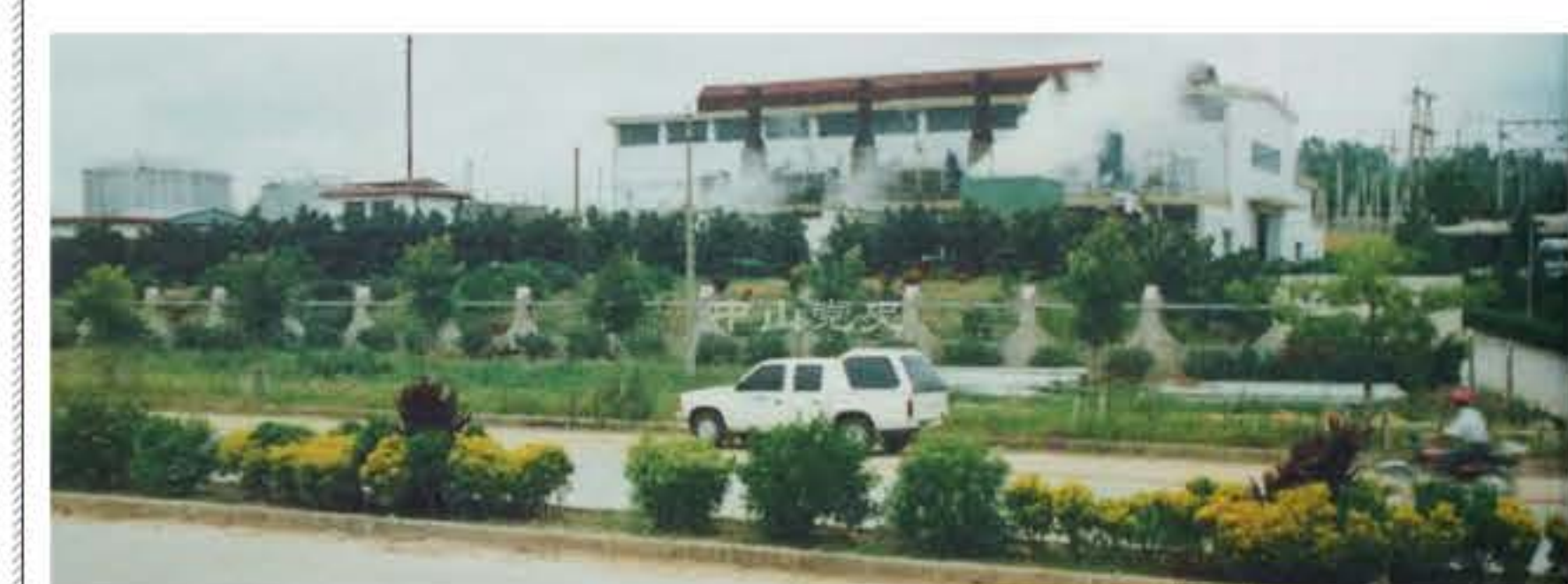
中山六路上的中山第一柴油机发电厂。

你也许想不到，1986年8月，位于蕉头村附近的大林山建成了中山第一柴油机发电厂，那是中山六路两旁第一座建筑。这足以说明当时这里仍是郊外，要不火力发电厂怎会选址于此？