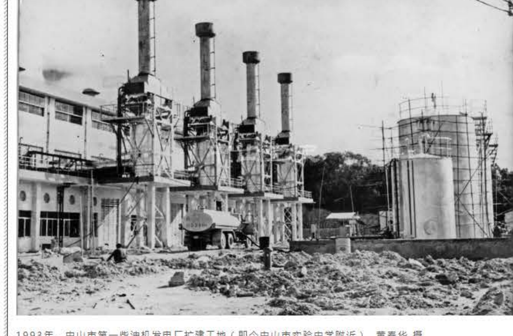
1993年，中山市第一柴油机发电厂扩建工地（即今中山市实验中学附近）

面对全省大电网日益严重的缺电情况，中山市政府成立了地方集体企业中山市电力开发公司，统筹落实地方自办电力措施，筹集资金加速中山地方电力建设。该公司采取四种形式办电：一是为广东省电力部门筹集办电资金，省里则以每万元7千瓦电力负荷配给中山用电；二是由公司筹集资金自办电厂；三是支持各工厂自设发电机组；四是横向联合经营发电厂。