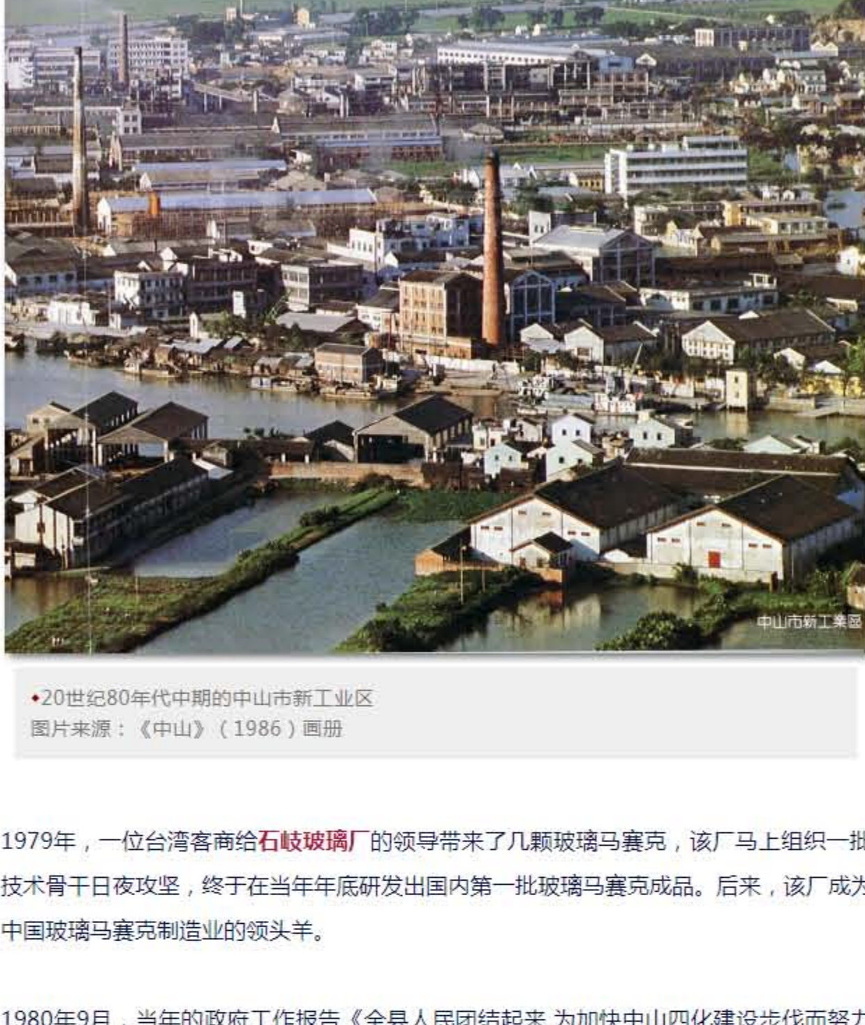
20世纪80年代中期的中山轻工业厂区

深圳，特别是蛇口的开发激励着中山迅速转变原有的农业产业结构，向市场需求大的轻工工业进发。这是在国内外市场抢占先机的一场竞争，在此时期，“当年立项，次年投产”的高速案例屡见不鲜。