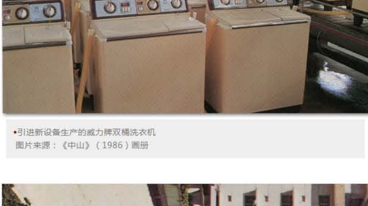
引进新设备生产的能力牌双缸洗衣机

1983年， 中山洗衣机厂（威力洗衣机厂） 把目光瞄准具有洗净与脱水功能的双缸洗衣机。其技术开发小组只用了半个月时间，就画了几百张图纸，完成了设计工作。1984年，威力洗衣机厂对美、日、法、德几个国家的7台（套）设备进行优化组合，而组装车间的生产线则采用国产设备。1985年初，“威力”新厂投产，第一年就让设计生产能力为年产10万台的生产线创造了产出19万台的成绩；次年，纪录被刷新为40万台。之后这个数字还在年年刷新。老牌的洗衣机厂与生产能力的爆发力使得威力洗衣机迅速崛起，销量马上跃居为全国首位。他们还大胆对洋设备“开刀”动手术，到1990年，威力洗衣机的年生产能力已达到了100万台。