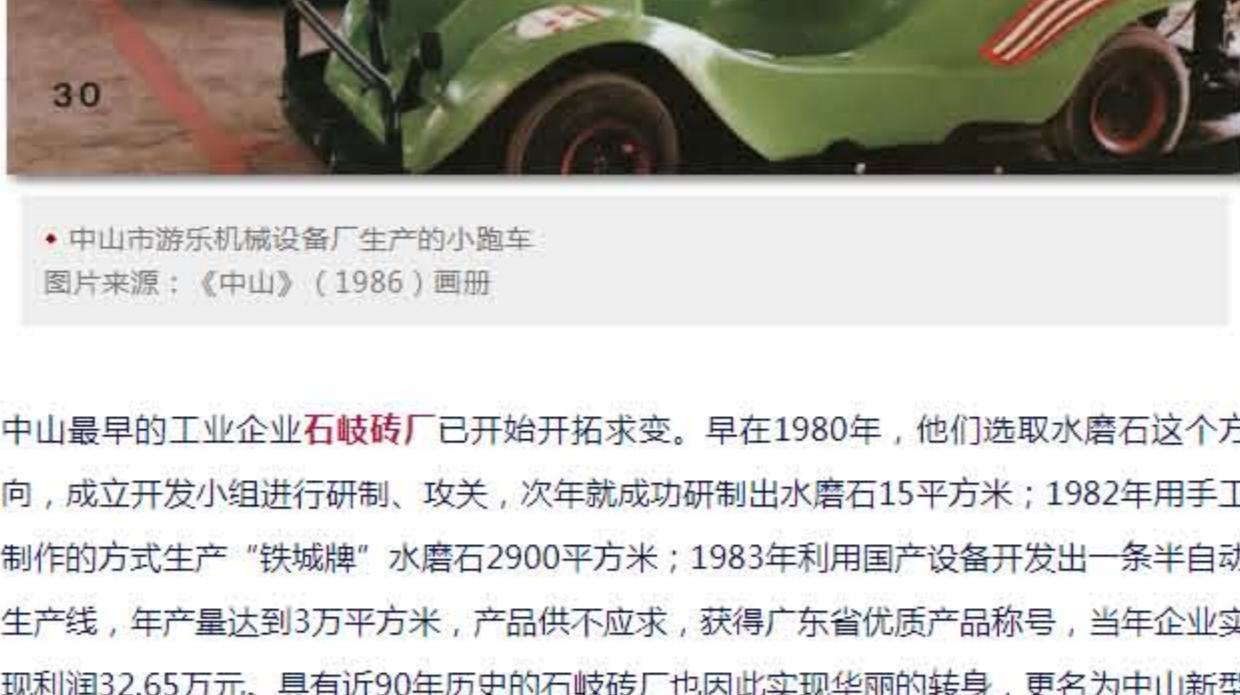
中山市游乐机械设备制造厂生产的小跑车

1983年初，由于承担了中国内地首个大型游乐场——长江乐园的过山车安装任务， 中山机械厂 得以接触到日本进口的新式碰碰车。后来，中山机械厂找到广州、清远、江门及本地一些厂家和研究单位，得到它们的支持，在1984年完成了碰碰车的试制工作。同年，广州珠江泳场旁的碰碰车场开业，用的全是中山生产的全国第一批国产碰碰车。生意火爆，短时间内给已更名为中山市游乐机械设备的该厂带来80多万元的订单。