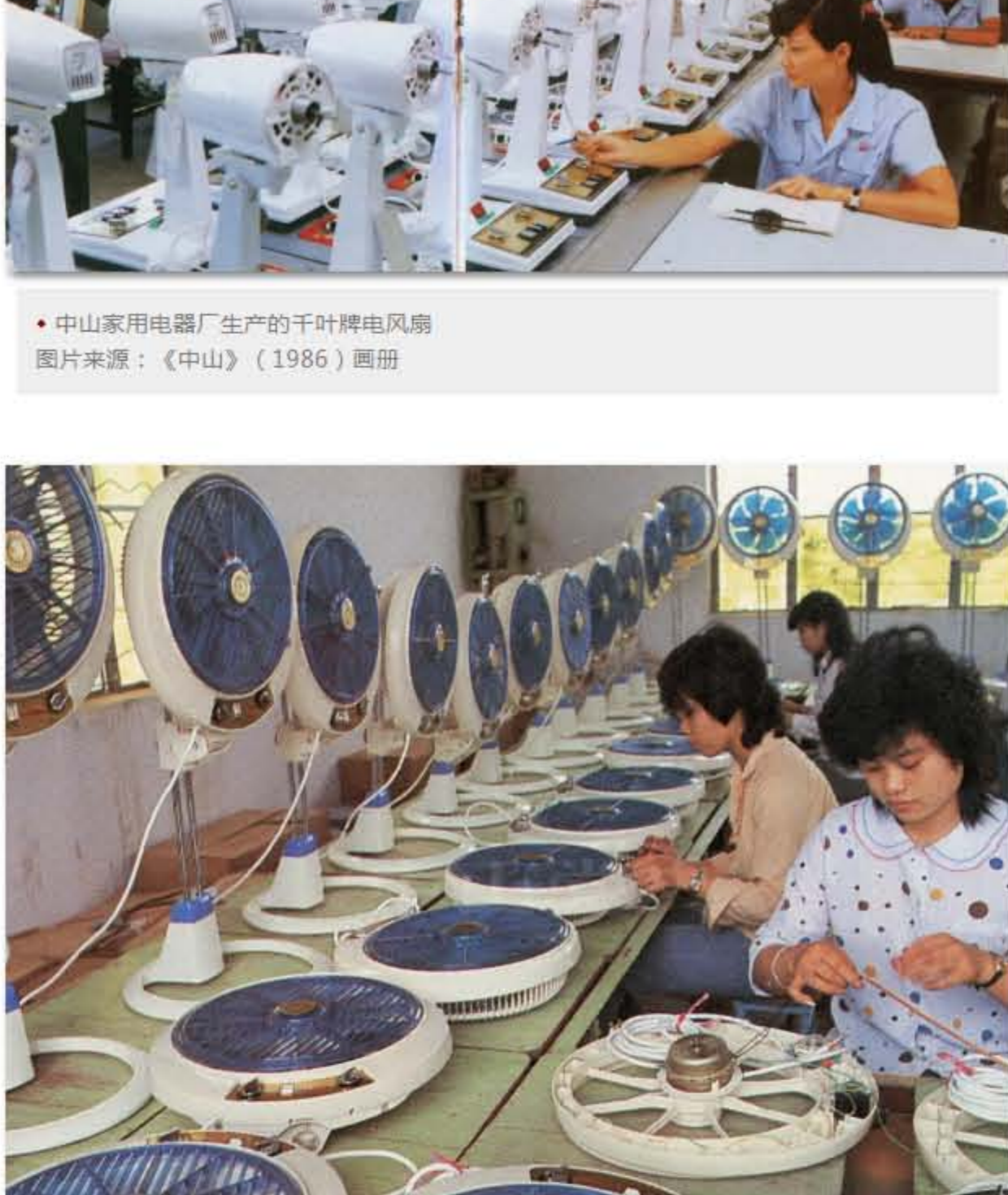
中山家用电器厂生产的电扇

1984年，与工业配套的 中山黄旗运河码头第一期工程 快速建成，包括1个5000吨级的码头、3个1000吨级的码头、1个客运码头。7公里长的进港大道也于当年建成通车。