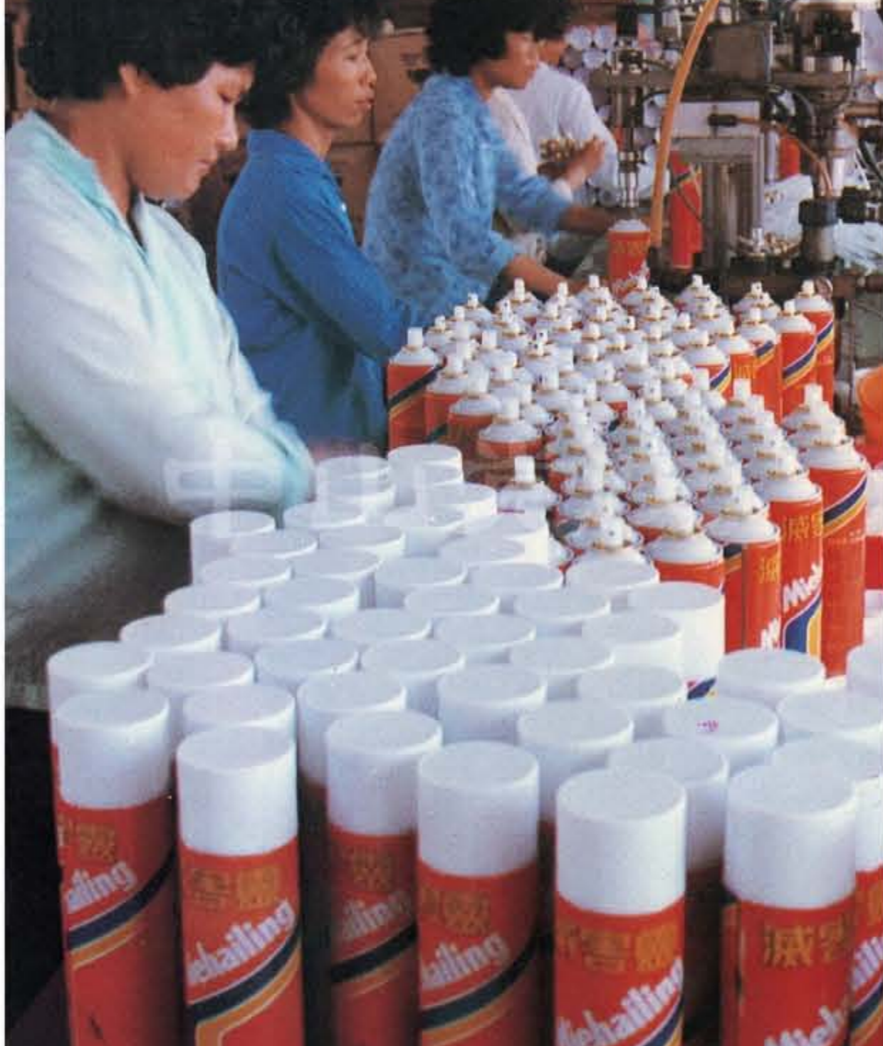
中山市精细化工实业有限公司生产的“天美牌”

1984年11月召开的市委常委（扩大）会议提出，要强化企业活力，抓好产业结构调整。当时的产业结构调整方向，就是大力发展市场需求性强、潜力大的产品。只要企业选好了项目，市委都会给予大力支持。对一些有前途、有市场、企业思想上想干由于种种原因有畏难情绪而未敢申报的项目，管理市属工业企业的政府部门积极帮助其立项，在行向上、报批上给予全力支持，如为企业筹资、报批立项等。为了给企业、占市场、经营还立足，工业新项目工程指挥部，全面协调所有项目工程单位与金融、建设、环保、物资等有相关部门的关系，保证各项目快完工、快投产、快出效益。