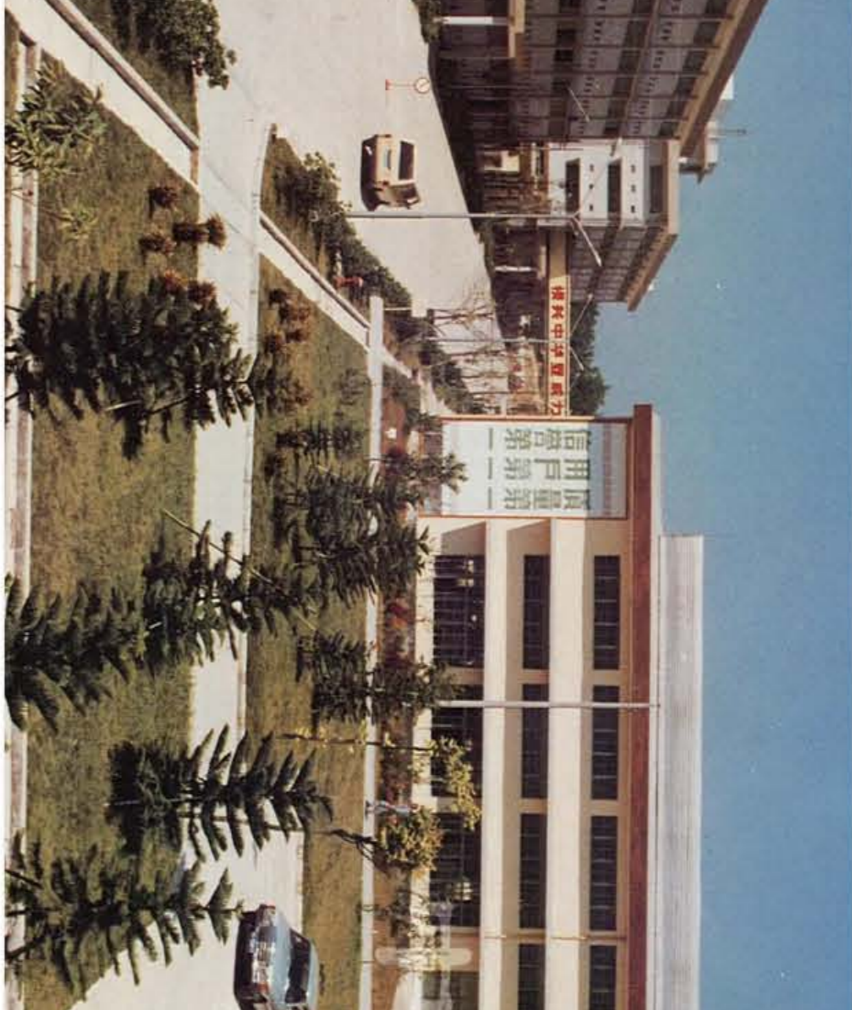
中山石油厂外景

1983年， 中山石油化工机械厂 从香港商处获得镀锌钢管和电线套管市场空间很大，迅速筹备一笔一笔外币贷款支持，于第一季度筹资300万美元，引进意大利先进的生产设备。次年3月，厂房破土动工兴建；6月，石油化工机械厂成立下属企业——中山市石油化工钢管厂。1985年4月，开始安装调试设备；10月19日，第一条“华德”品牌的镀锌管投产出来。之后，“华德”镀锌管出口市场，大举进军香港市场。