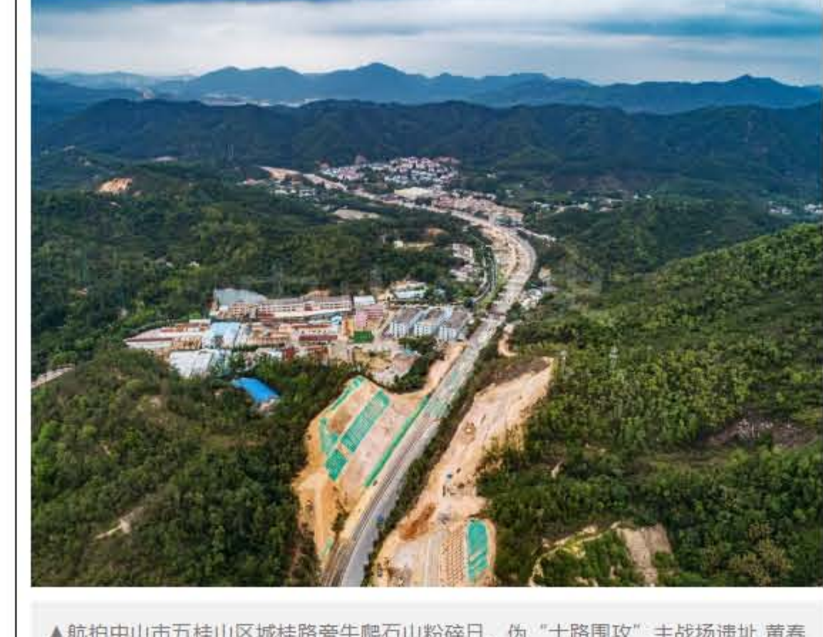
▲航拍中山市五桂山区域桂路旁牛鹿石山粉碎日、伪“十路围攻”主战场遗址

选定五桂山作为抗日根据地，与五桂山的地理位置、地势等分不开。五桂山位于中山县中部，纵横六七十里（1华里即0.5千米），远看犹如万顷碧波中的群岛，崛起于珠江三角洲大平原。它的最高峰海拔500余米，峰峦起伏，逶迤绵延。东南、东北与凤凰山、白米山互为倚托，地形险要，利于回旋。五桂山区散布600多个大小村庄，四万多的居民绝大多数是喜家人，他们勤劳、勇敢，富有反抗精神。