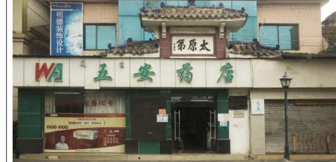
▲1938年11月中旬，中共中山县委第一次武装工作会议在太原第召开

基于《论持久战》的战略方针和洛川会议精神，1938年11月，中共中山县委提出“以五桂山作为将来的游击根据地”。是年5月26日至6月3日，毛泽东在延安抗日战争研究会上发表《论持久战》，明确指出，中国不会亡，但是也不能速胜。抗日战争是持久战。将经过敌之战略进攻，我之战略防御；敌之战略保守，我之准备反攻；我之战略反攻，敌之战略退却三个阶段。《论持久战》提出了防御战中的进攻战、持久战中的速决战、内线作战中的外线作战等一整套充满辩证法的战略方针，深刻地分析了战争中的主动性、灵活性、计划性以及运动战、游击战、阵地战、消耗战、歼灭战等诸种作战形式。10月22日广州沦陷，南海、番禺、顺德、三水、佛山、江门等地相继失守，中山处于腹背受敌的危险状态。11月1日，中共中央组织部根据《论持久战》的精神下达指示——在广州及其他被占领区附近进行游击战争，组织游击队，并帮助友军进行游击战争。同月中旬，中共中山县委在太原第（位于石岐区民生北路256号，是言花村旅美华侨王秉的公寓）召开全面抗日战争时期第一次武装工作会议，参加会议的有全体县委委员和部分区委的负责人。