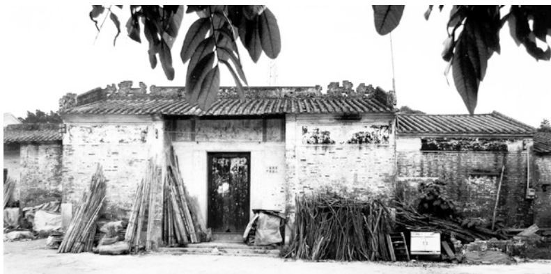
梁季安祠堂——麻子乡农民协会成立旧址（历史照片）

1924年8月中旬，广东省省长廖仲恺到香山九区大黄圃宣传革命，发动农民组织农会，使广大香山农民备受鼓舞。随后，农民运动在香山逐步兴起。