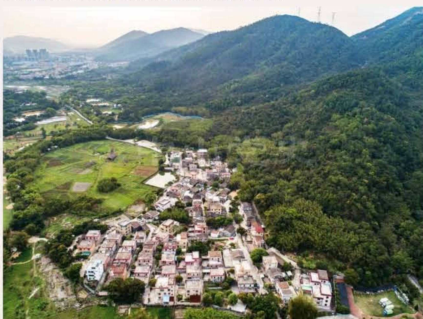
▲五桂山革命老区村旗溪村（企溪村）。黄春华摄于2020年3月