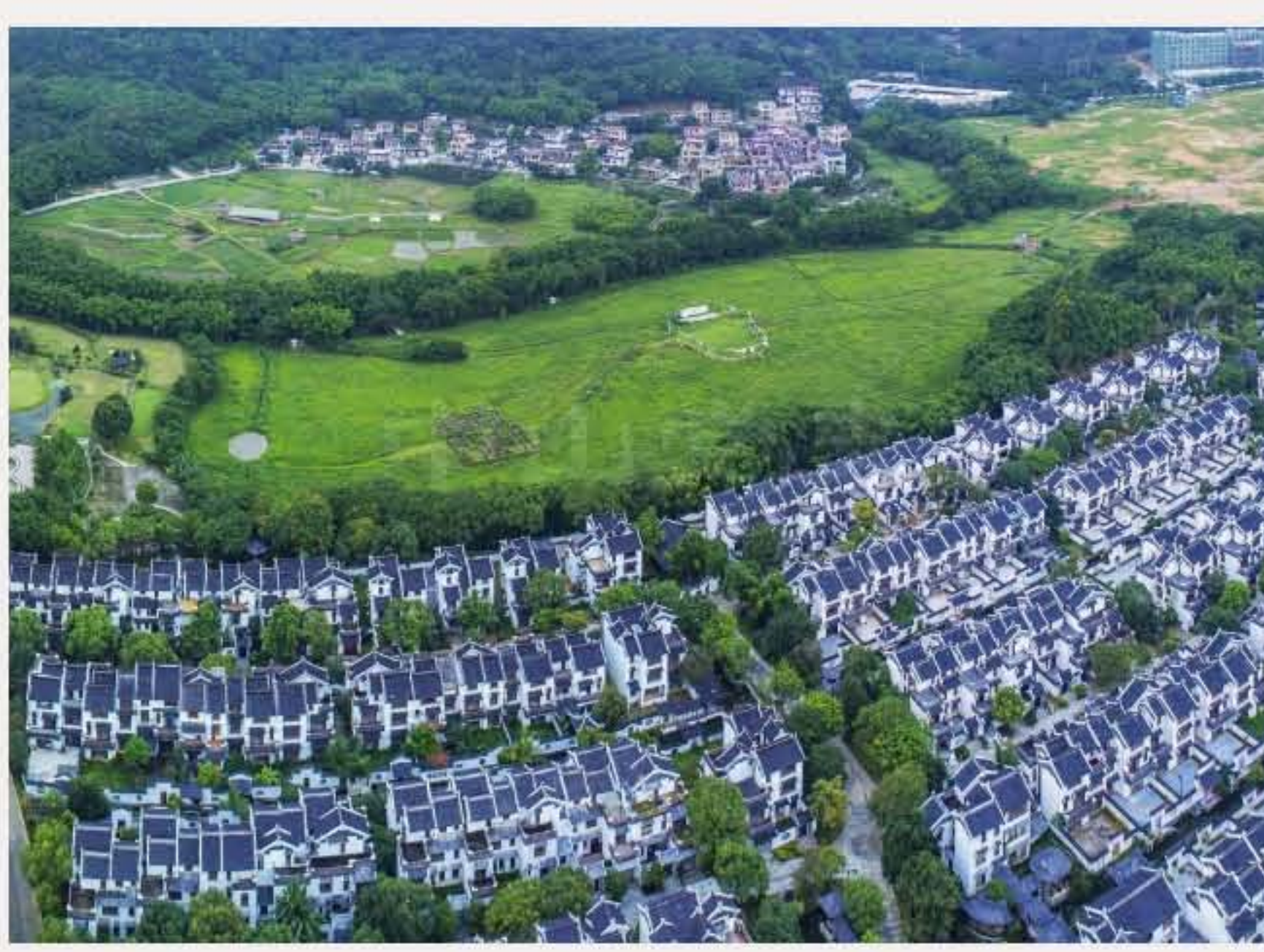
▲五桂山革命老区村旗溪村（企溪村）。黄春华摄于2017年5月

毛斯鲁（1920—1942），革命烈士，1942年4月参加中山抗日游击队，同年8月在沙岗被捕后遭杀害。