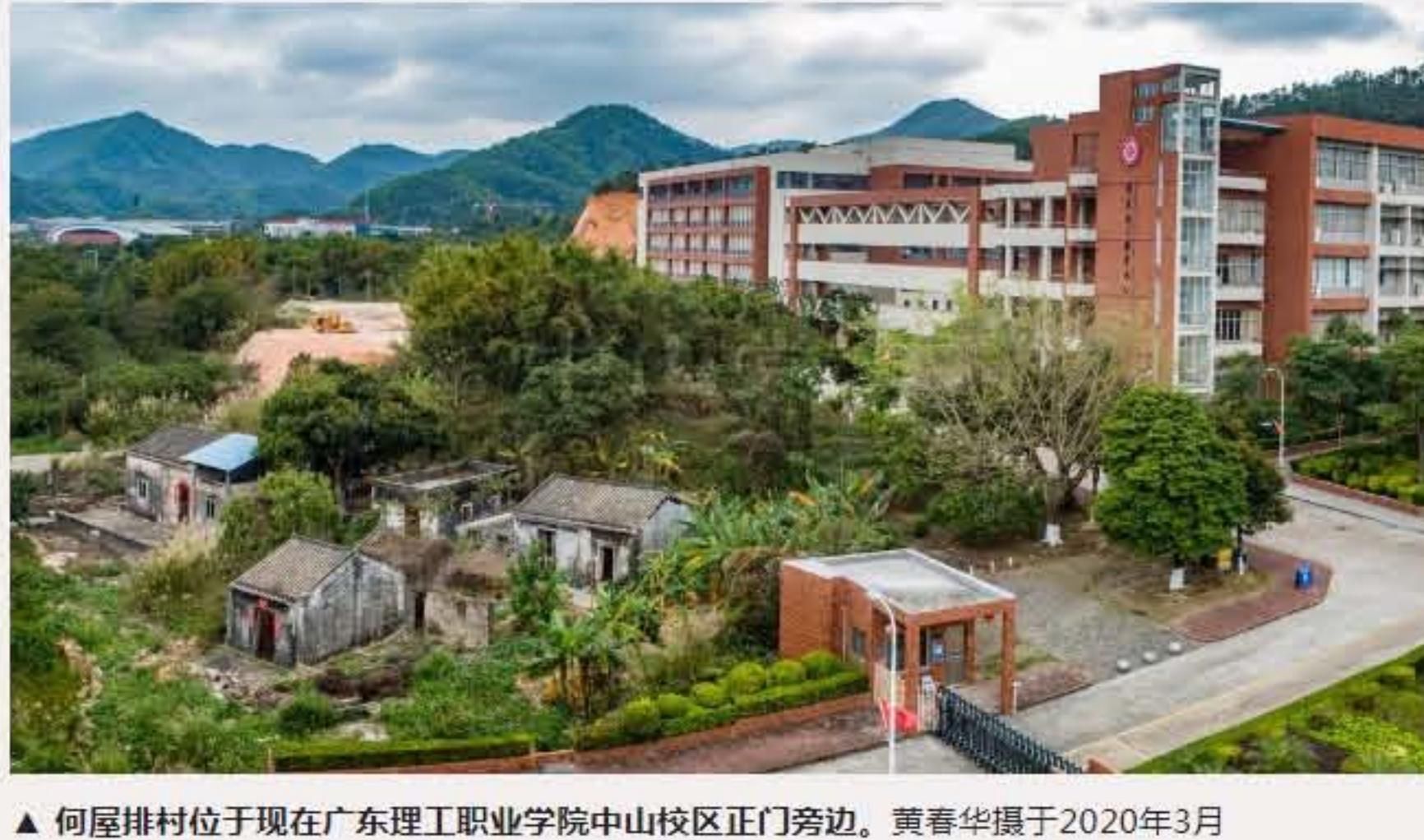
▲何屋排村位于现在广东理工职业学院中山校区正门旁边。

抗日战争时期，五桂山抗日游击队曾驻扎该村。中华人民共和国成立后，该村被评为抗战时期“广东省革命老区村庄”。