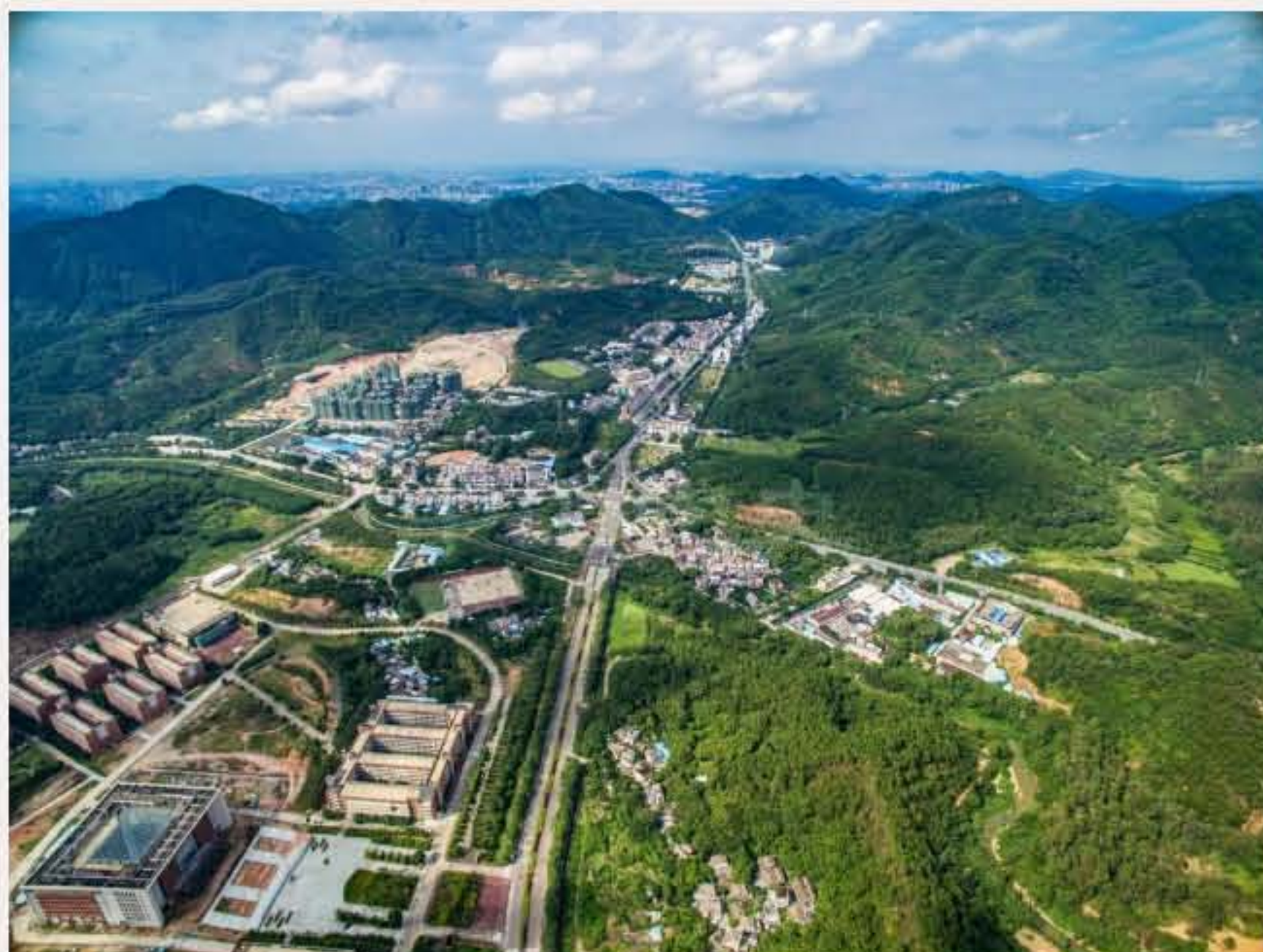
▲张屋排村位于广东理工职业学院中山校区正门的前方（图中下方的村庄）。于2016年9月