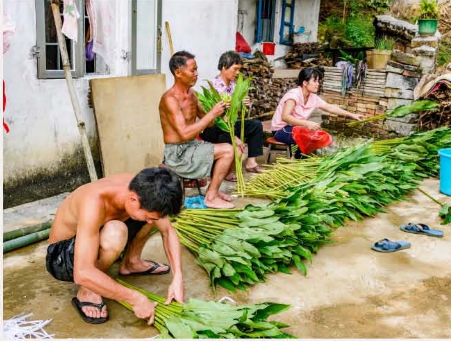
▲ 石井村种姜花的人。（2010年9月）