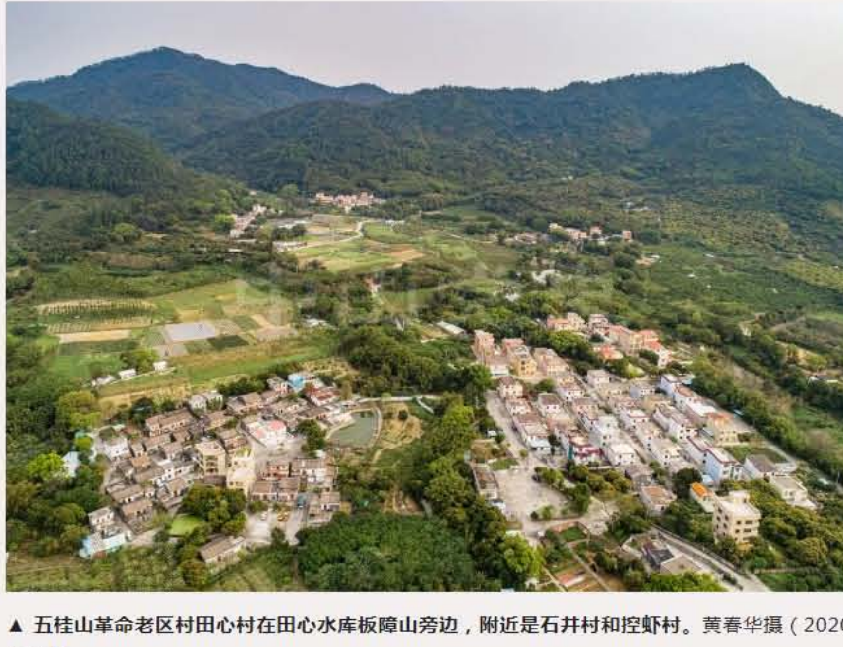
▲ 五桂山革命老区村田心村在田心水库板障山旁边，附近是石井村和控虾村。黄春华摄（2020年3月）