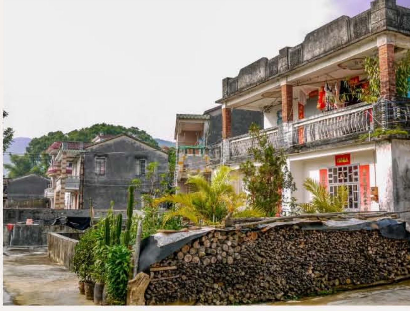
▲ 五桂山革命老区村石井村。（2010年9月）

抗日战争时期，村民常掩护游击队战士，为抗战做出贡献。1957年，该村被评为抗战时期“广东省革命老区村庄”。