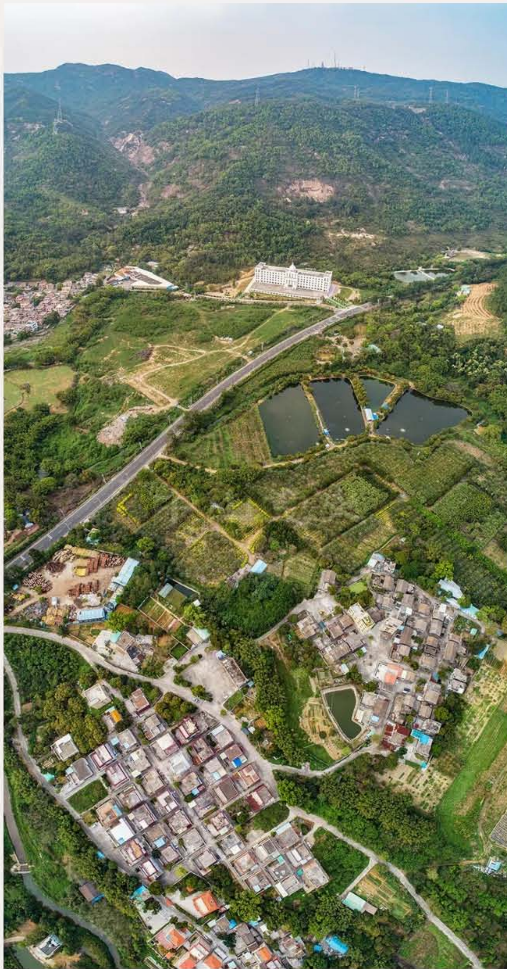
▲ 田心村在田心水库板障山旁边，附近是旗溪村、石井村和控虾村。黄春华摄（2020年3月）

抗日战争时期，村民积极开展抗日斗争活动。1957年，该村被评为抗战时期“广东省革命老区村庄”。