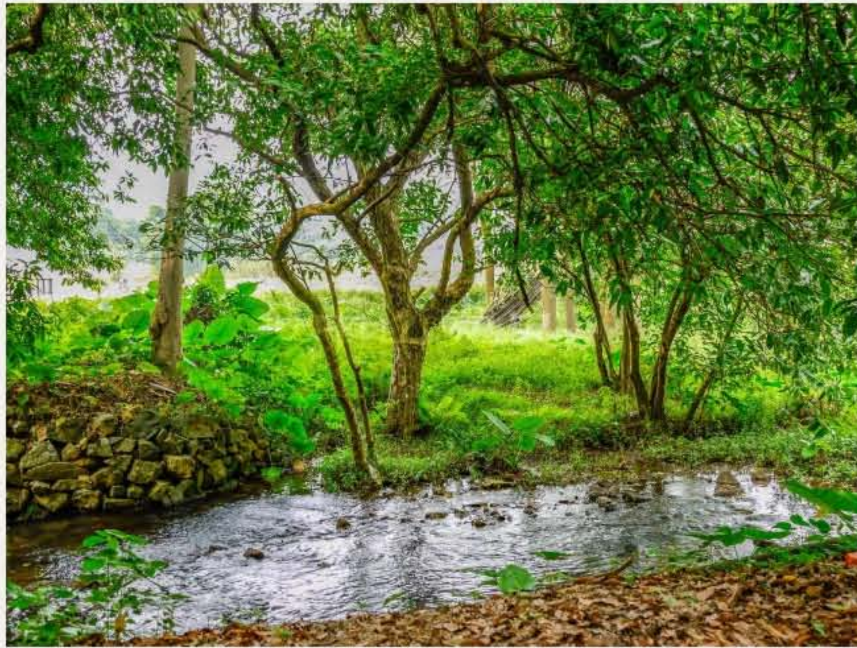
▲ 控虾村一角。（2010年9月）

说明： 各村1997年行政区划归属根据广东省民政厅编：《广东省革命老区村庄名册》，1997年编著。