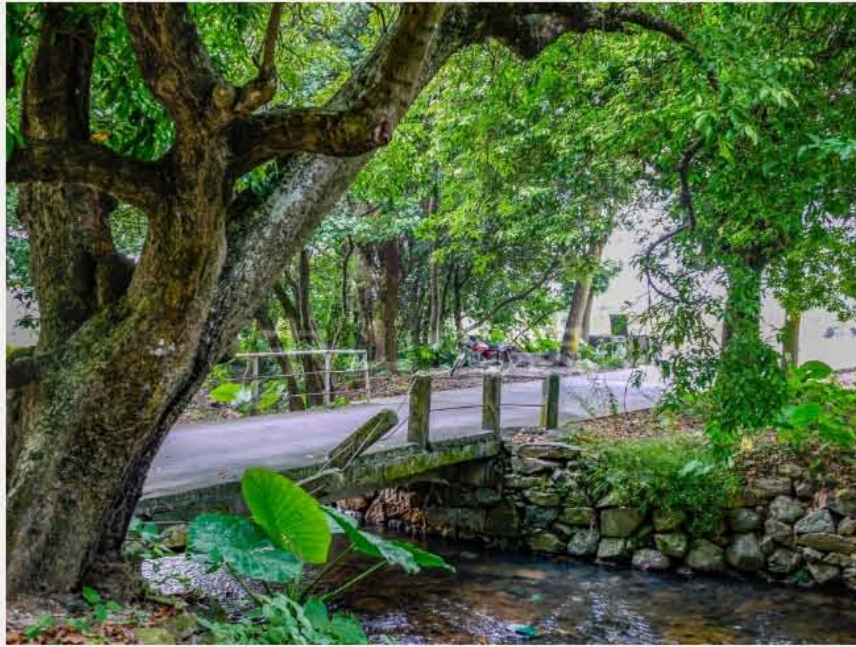
▲ 五桂山革命老区村控虾村。黄春华摄（2010年9月）

抗日战争时期，日军侵略控虾村，村民房屋均受严重破坏。游击队在此一带活动。村民常掩护山区游击队的干部和战士，为抗日战争作出了贡献。1957年，该村被评为抗战时期“广东省革命老区村庄”。