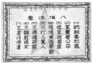
中山独立团连队之间使用的流通券，背面印有“八项注意”