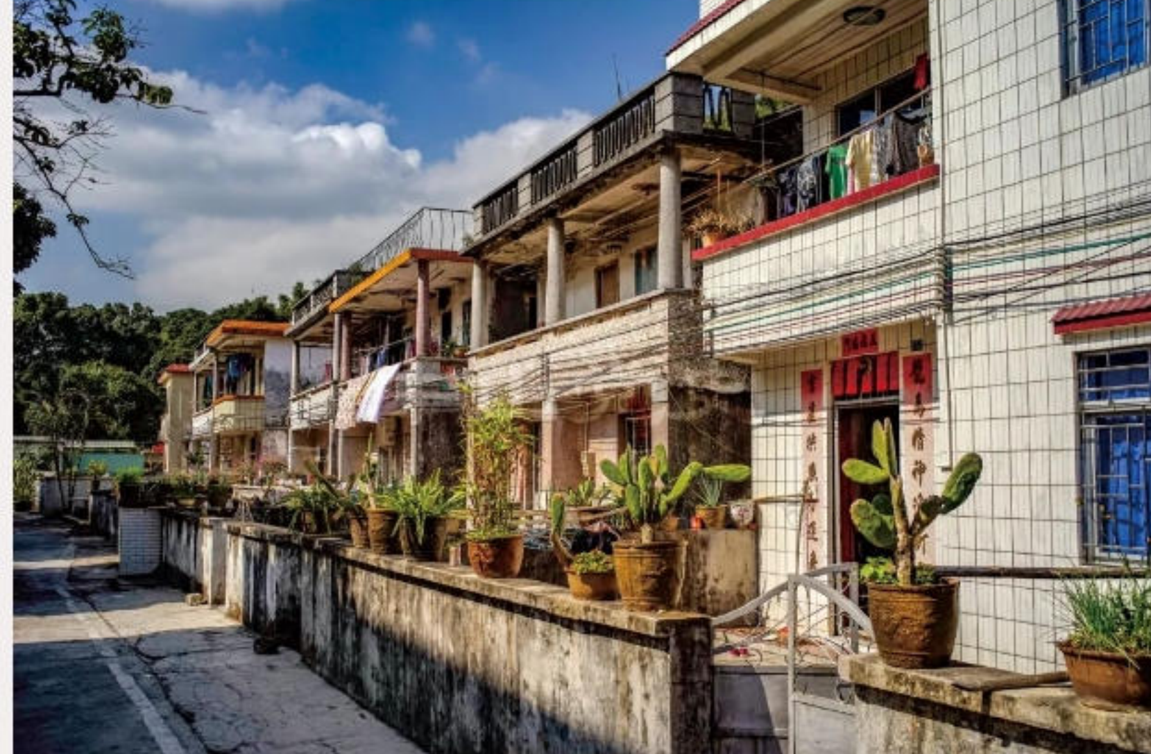
▲ 和平村。黄春华摄（2014年11月）