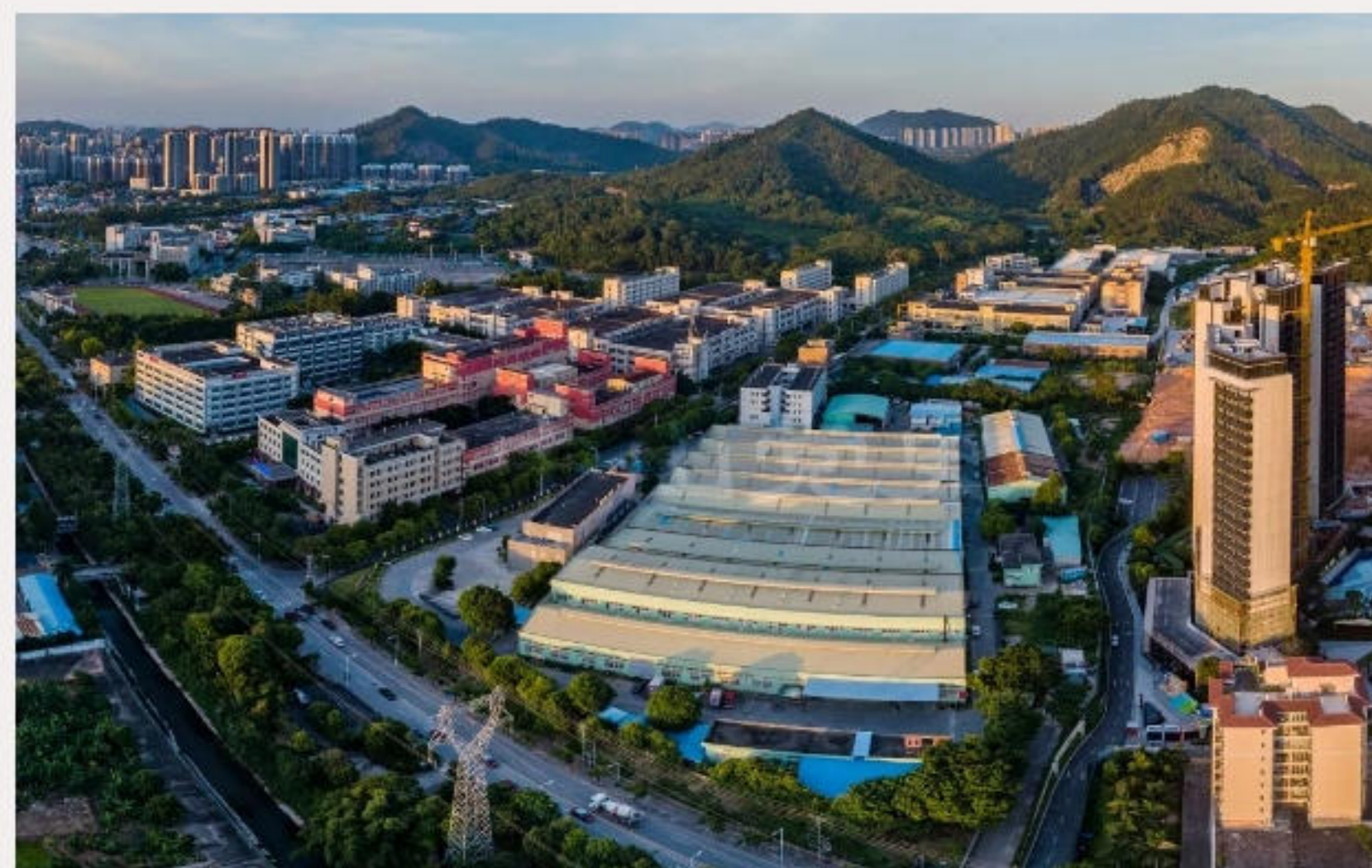
▲ 龙贡村现在已成为长命水工业区，还有高层住宅小区在兴建。黄春华摄（2020年6月）

抗日战争时期，五桂山游击队曾在该村开展抗日斗争活动。1957年，该村被评为抗战时期“广东省革命老区村庄”。