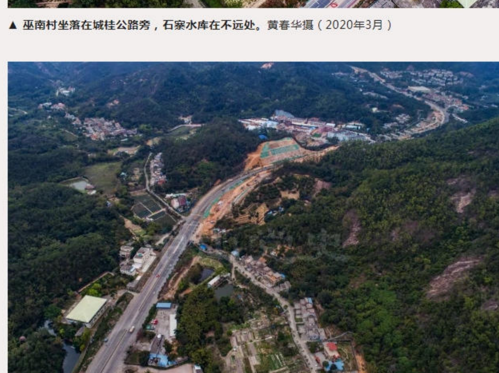
▲从石窝水库看巫南村、城桂路（坦洲快线工地）和石窝口村、南坑村。（2020年3月）