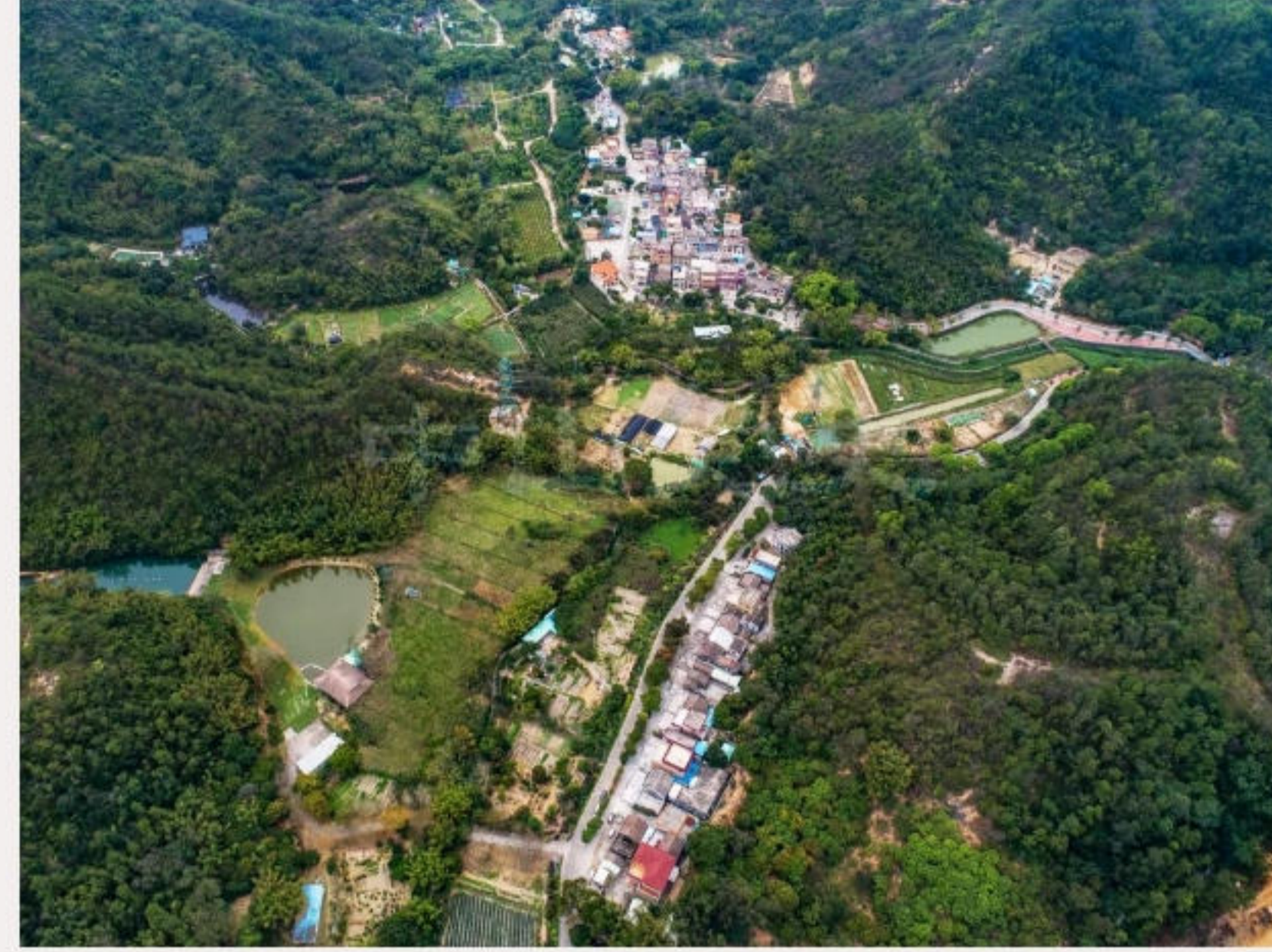
▲南坑村与石窝口村相邻，后者呈长条状，位于城桂公路旁。（2020年3月）