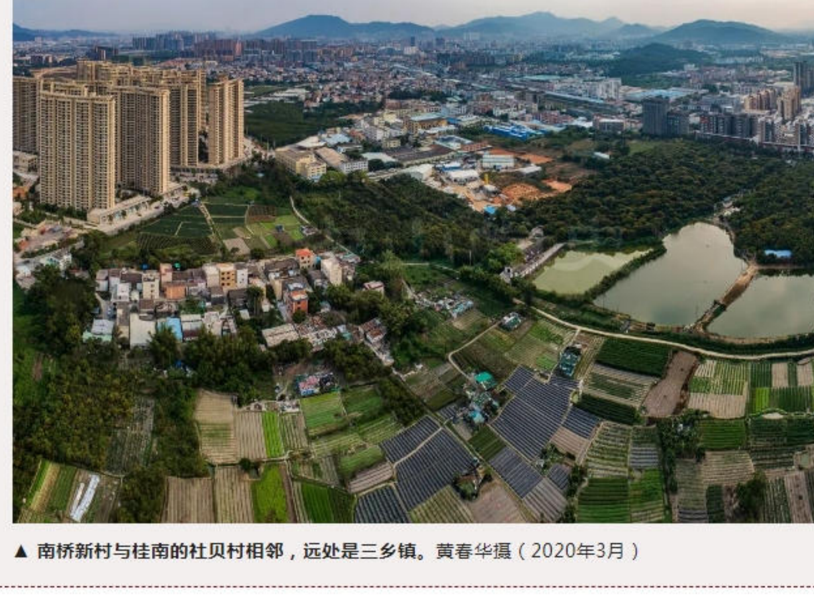
▲南桥新村与桂南的杜贝村相邻，远处是三乡镇。黄春华摄（2020年3月）

抗日战争时期，中山抗日游击队曾在该村一带活动。村民积极配合抗日游击队开展抗日斗争。中华人民共和国成立后，该村被评为抗战时期“广东省革命老区村庄”。