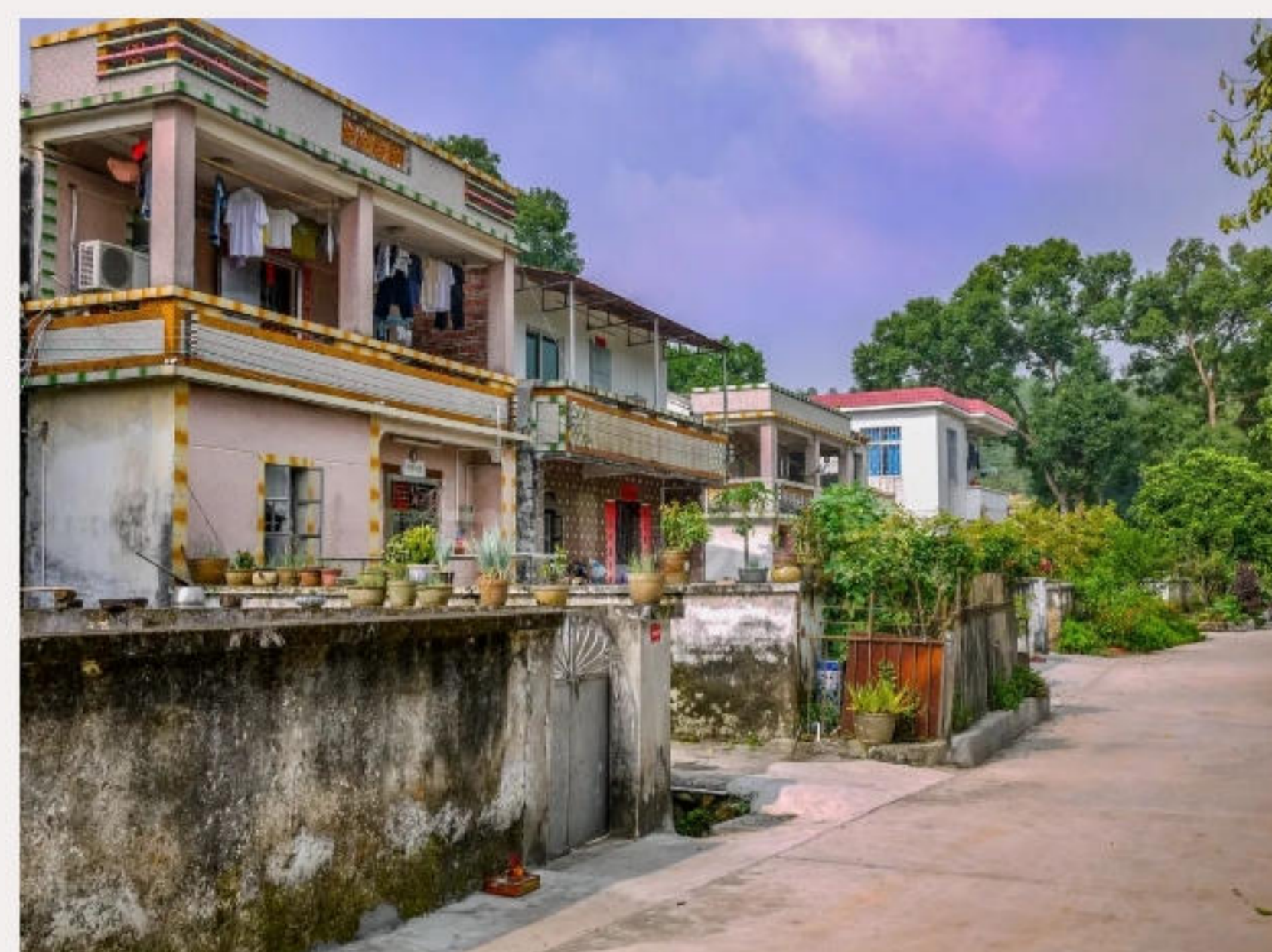
▲南坑村。黄春华摄（2010年9月）

抗日战争时期，村民配合抗日游击队开展抗日工作。1957年，该村被评为抗战时期“广东省革命老区村庄”。