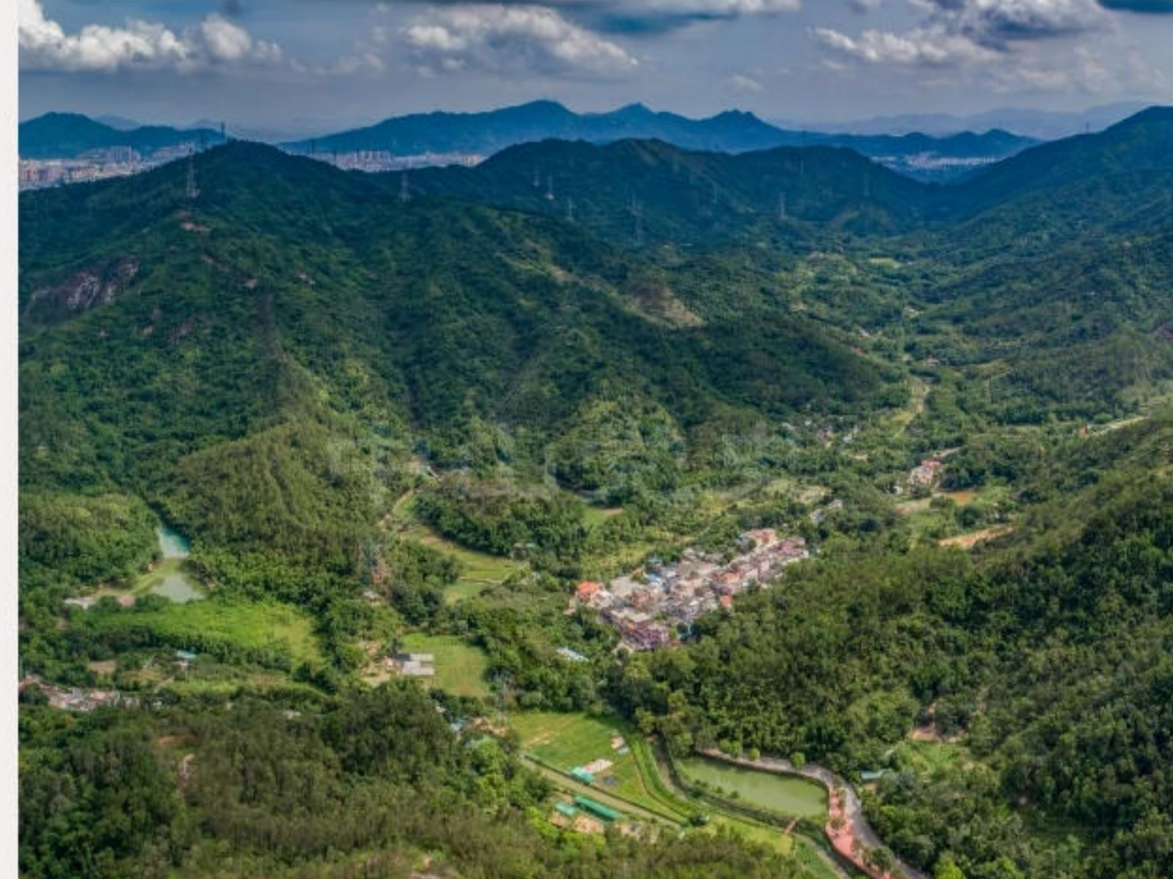
▲南坑村位于五桂山深处。（2019年7月）