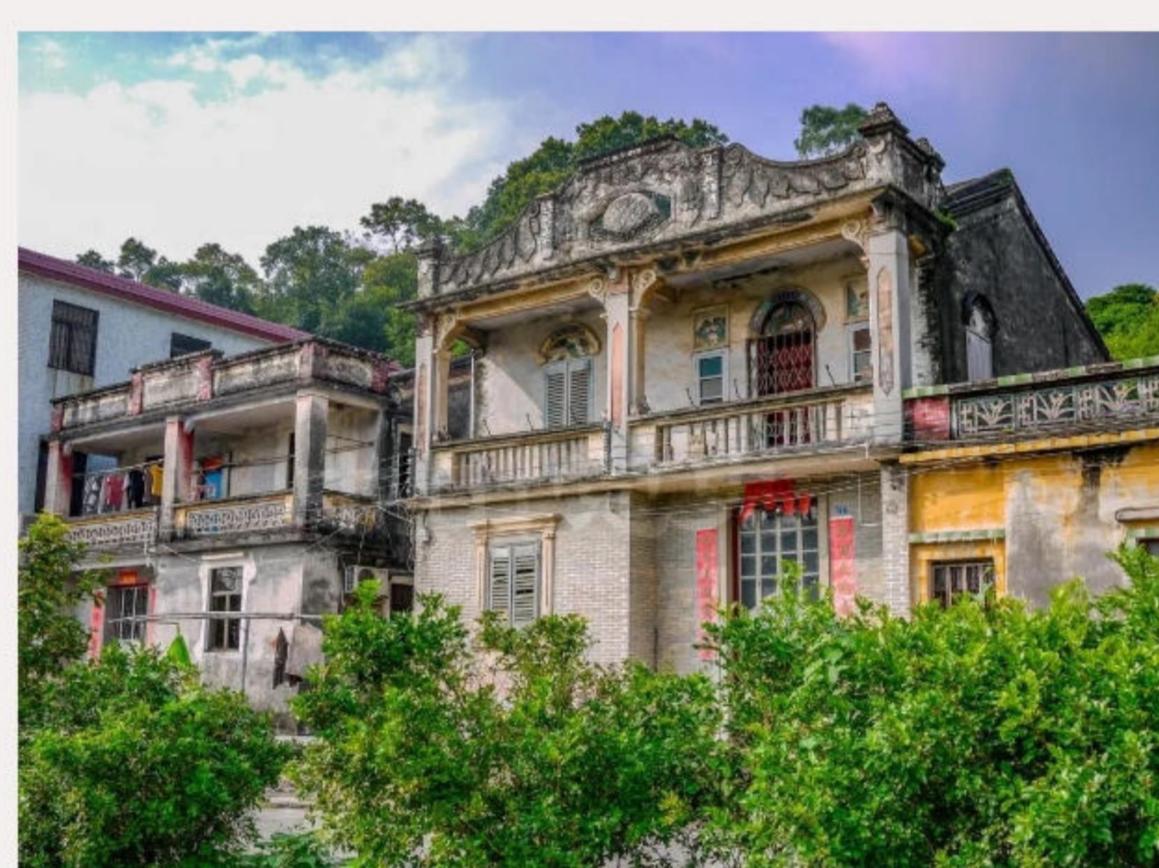
▲石窝口村。黄春华摄（2010年9月）