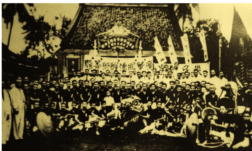
1938年，印尼巴城(雅加达)群乐社联合广肇同侨舞狮为祖国灾民筹款，出发前在群乐社广场留影。

经济支援是华侨支援祖国抗战的最集中体现。海外侨胞千方百计为祖国筹措军费，主动进行常月捐、特别捐等多种形式的捐款活动，踊跃认购救国公债和国防公债，捐献飞机、坦克、车辆、药品等各种战略物资。