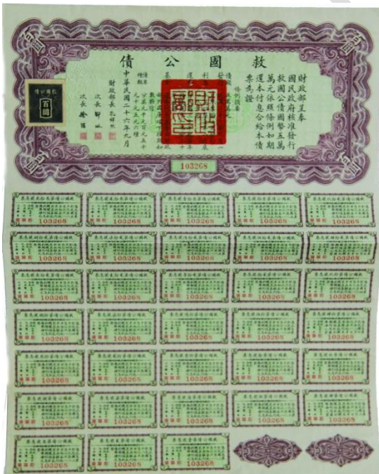
1937年，中華民國政府發行的救國公債。（中山市博物館藏）