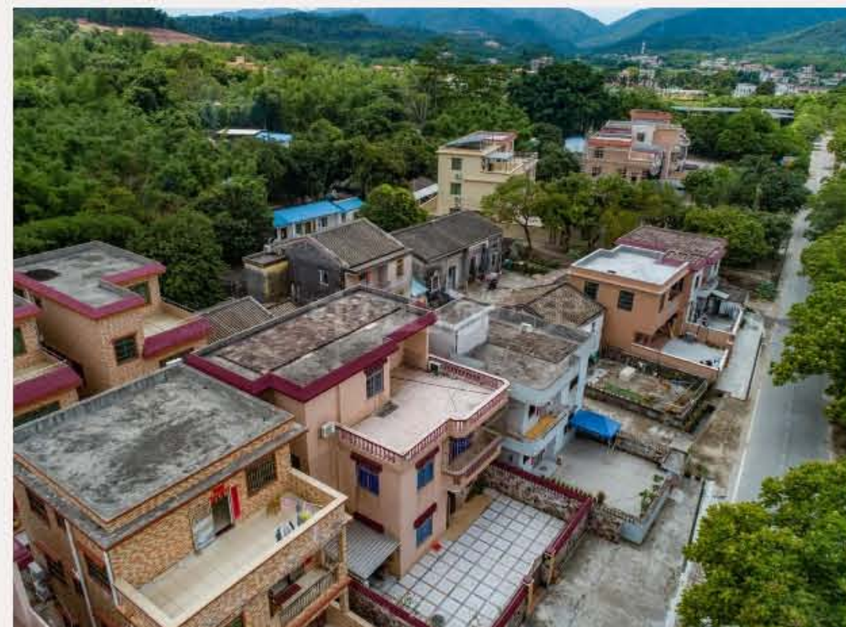
▲ 南朗镇白企行政村长攸连村。黄春华摄（2020年5月）