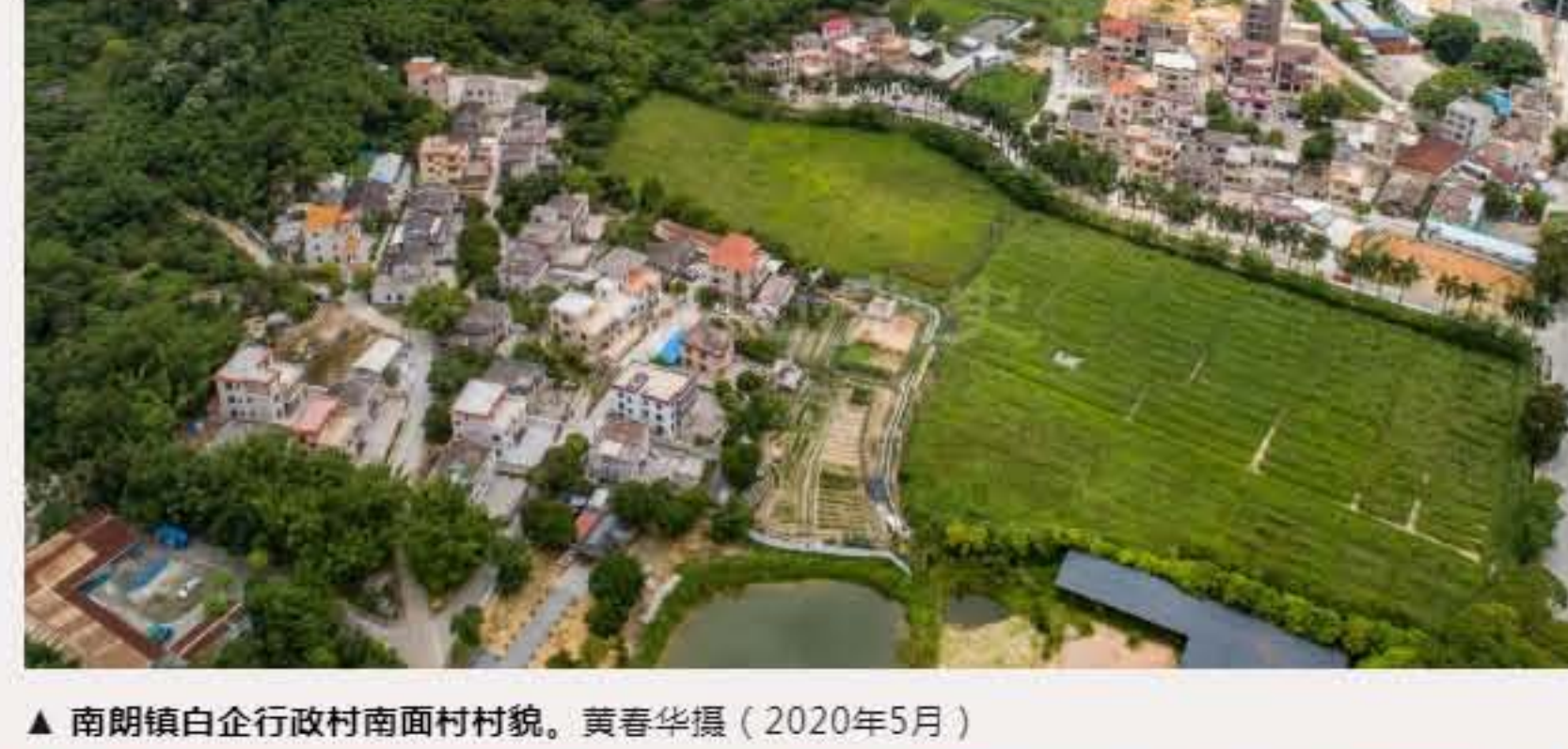
▲ 南朗镇白企行政村南面村村貌。（2020年5月）