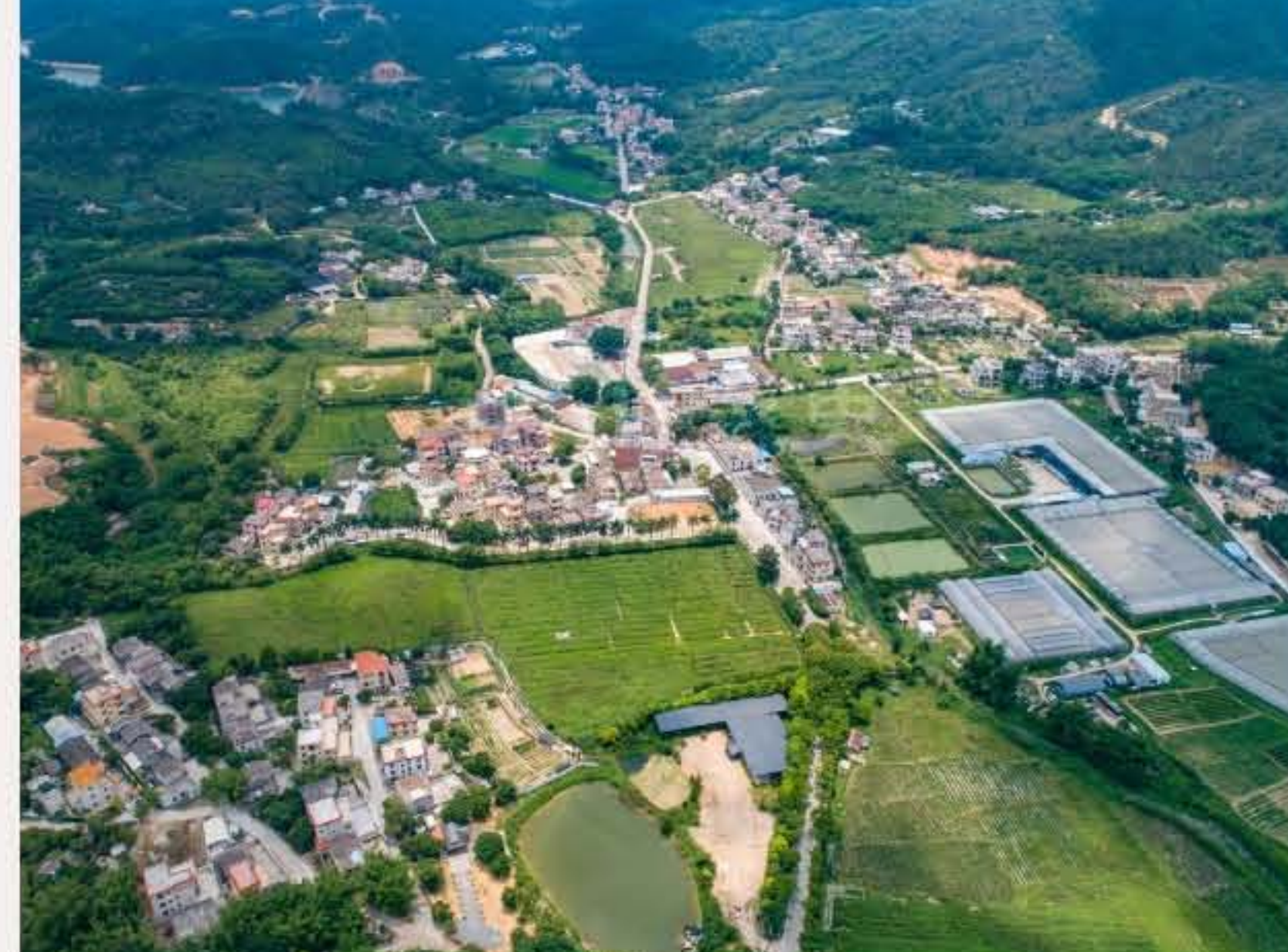
▲ 图中近处左为南面村，图中间为余屋村，远右为大塘村。黄春华摄（2020年5月）