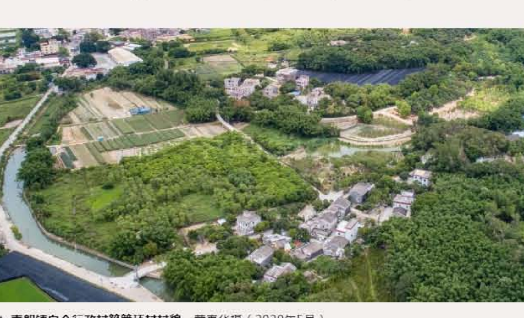
▲ 南朗镇白企行政村筲箕环村村貌。（2020年5月）