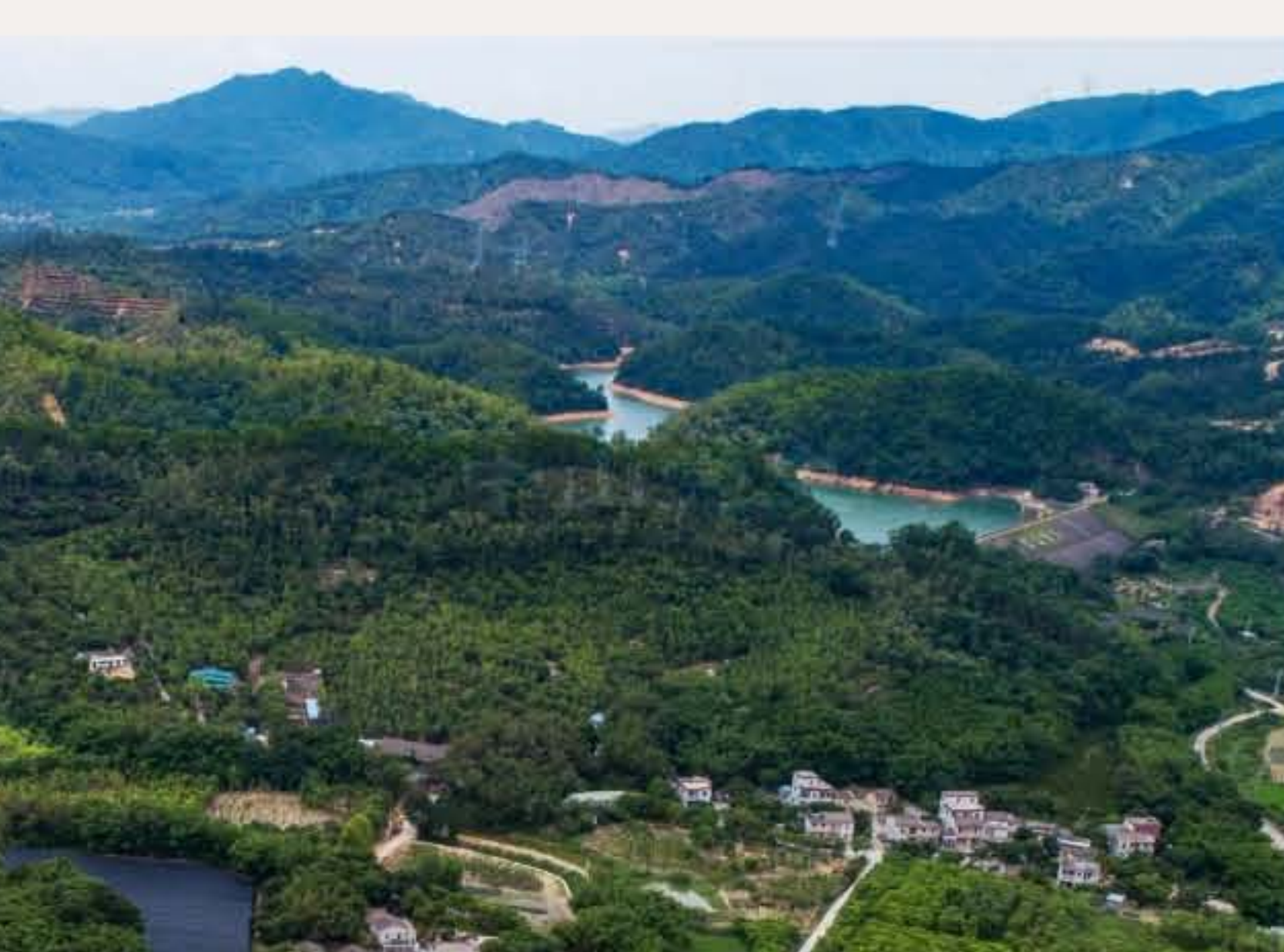
▲ 南朗镇白企行政村的筲箕环村就在横速水库旁边。（2020年5月）