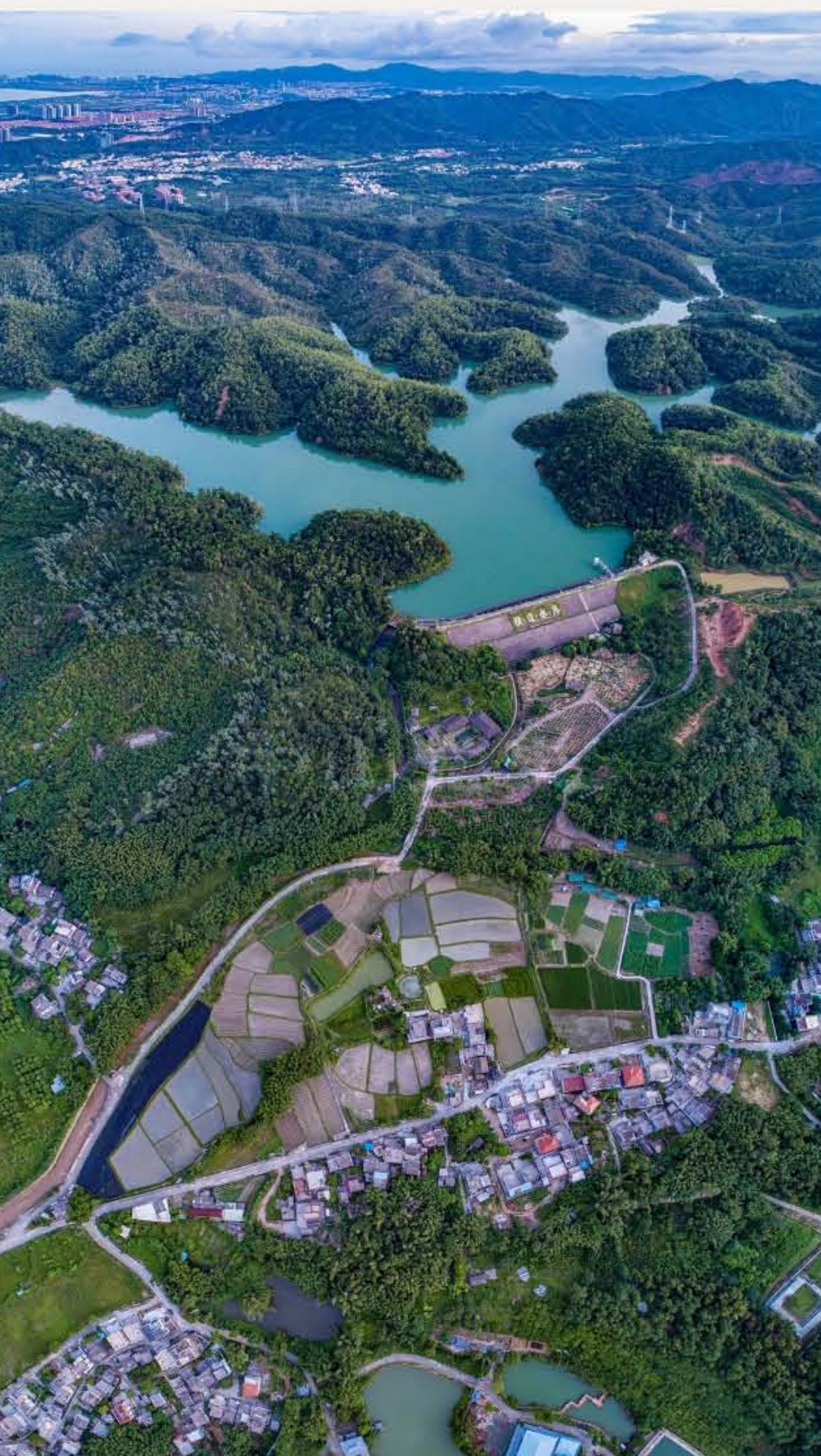
▲ 横速水库下是南朗镇白企行政村筲箕环村（左上）、大塘村（左下）、瓦屋村（右）。（2019年8月）