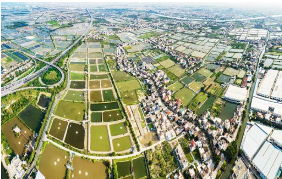
东风镇西罟步行政村二军自然村，当年十二名游击队员在这里壮烈牺牲

战斗行列。因敌众我寡，为保存力量，游击队暂时撤离。同月下旬的一个晚上，班排干部训练班的12名学员奉命撤向西罟步大塘旁的土榨糖厂旧址休