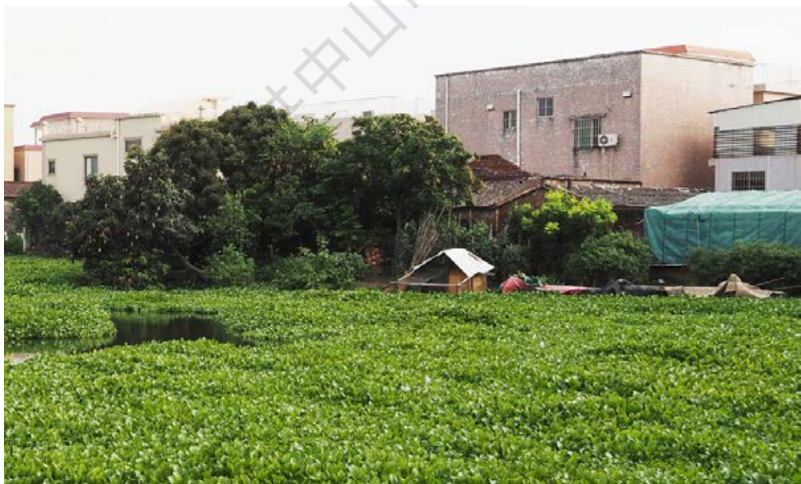
十二壮士殉难遗址今貌（黄春华摄于2021年6月）

息。不料驻扎在二军村的日军尾随而至，包围了土榨糖厂茅寮。班长曾信林带领全班战士奋起抗击，宁死不屈，战至全体牺牲。