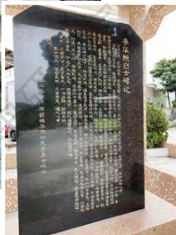
李华照烈士纪念碑特写

李华照烈士纪念亭、纪念碑位于中山市南朗街道华照行政村岐山自然村头，岐山市场旁边。