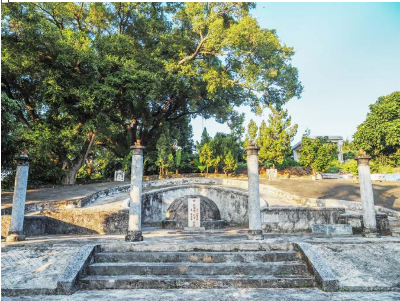
欧阳强烈士墓全景