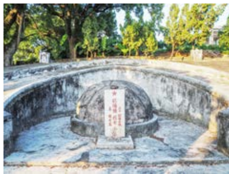
欧阳强烈士墓近景（黄春华摄于2020年10月）

1936年，粤汉铁路竣工通车。全国铁路总工会华北工作委员会决定派欧阳强到广东工作。之后，欧阳强前往乐昌车站工作，秘密负责领导乐昌地区人民的革命斗争。1938年10月，欧阳强任湖南郴县地区党支部书记。1945年抗战胜利后，欧阳强在乐昌建立“铁型俱乐部”，继续从事工运斗争。1946年初，欧阳强被国民党第二次逮捕，后虽经工友声援出狱，却被铁路当局开除了。为了革命的胜利，欧阳强以卖药为掩护，从湖南的郴州到广东乐昌、韶关、广州沿线，继续为党做宣传、组织工作。1947年10月9日晚，一群国民党便衣特务逮捕了欧阳强。在狱中，他坚贞不屈，不为利诱所动，