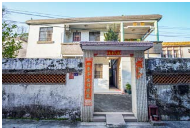
李华韶烈士故居（已重建）围院正面外景 （黄春华摄于 2020 年 10 月）

1927 年“四一二”反革命政变后，中共中山县委遵照广东区委的指示，准备发动农民武装起义，李华韶任起义总指挥。由于起义计划被泄露，卖蔗埔起义失败，农军伤亡数十人，李华韶被中山县当局通缉，但他不为所惧，继续组织领导共产党员、农运骨