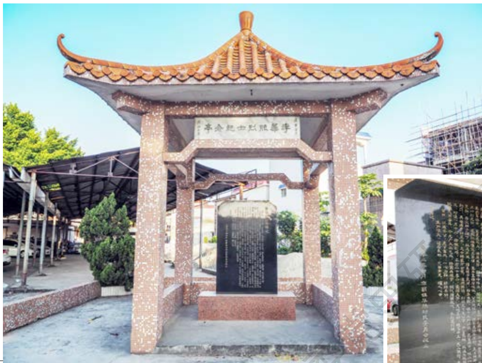
李华照烈士纪念亭、纪念碑正面全景