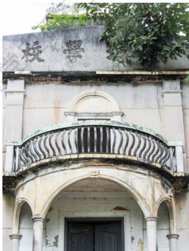
滨海区政务委员会成立旧址门外南塘学校校名特写（黄春华摄于2023年5月）

该旧址所在的南塘学校建于民国初年，依山而建，坐北向南，为欧陆式建筑风格，钢筋混凝土结构。其中，建筑物占地约 850 平方米。