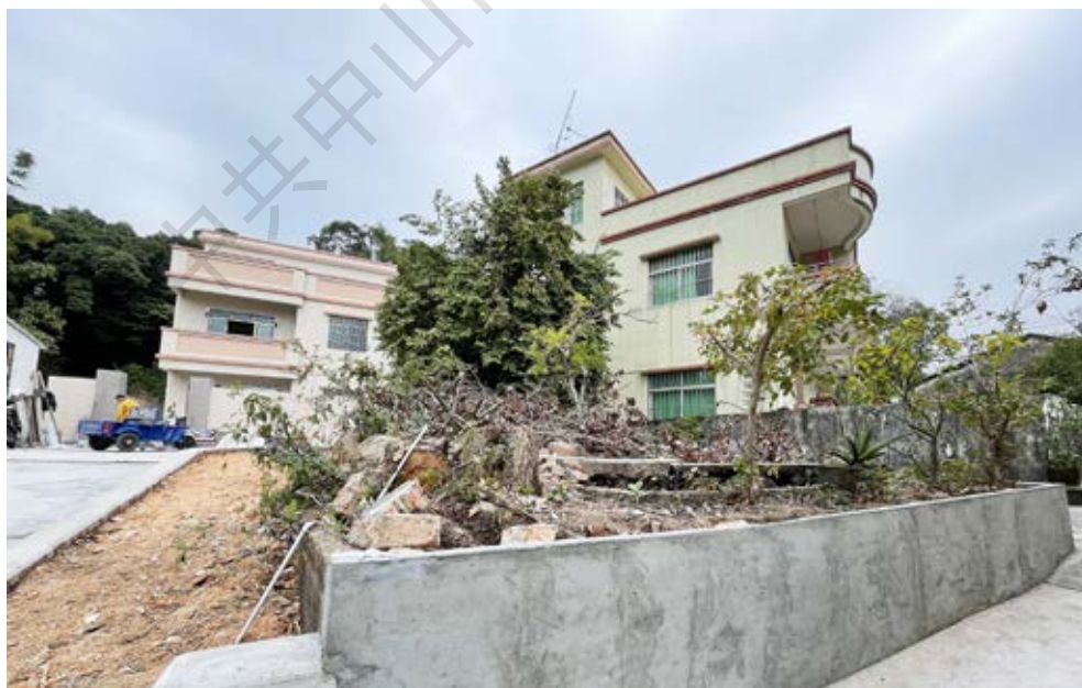
中共四大代表阮章祖居遗址今貌

当练习生。1921年春，邓培改组了南厂的“同人联合会”，刚进厂不久的阮章被选为工会委员。同年7月，阮章参加唐山社会主义青年团，为首批7名团员之一。之后，为联络工人感情，使大家学习知识，向工人群众宣传马克思主义，他与李树彝等发起成立唐山工人图书馆。这是在中共领导下唐山最早的工人图书馆。此外，京奉路唐山工会还在该图书馆旁创办了一所工人夜校，阮章曾担任该夜校教员，经常利用讲课之机发动群众。