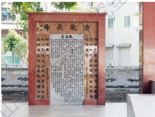
里溪革命纪念亭亭内 石碑正面特写

月，日本侵略者向里溪黄牛头山守军发起进攻，梁振昭当即率领武装队员10多人驰援。大家冒着炮火和弹雨，把弹药、茶饭等送上火线，军民并肩痛击来犯之敌。同月，日军第一次进犯横门，横门前线抗日支前指挥部以“抗先”的名义发出动员令，月角抗先队即由蔡祥率领10多名抗先队员前往支前，并出色完成任务。同年9月，日军再次进犯横门，月角青年积极奔