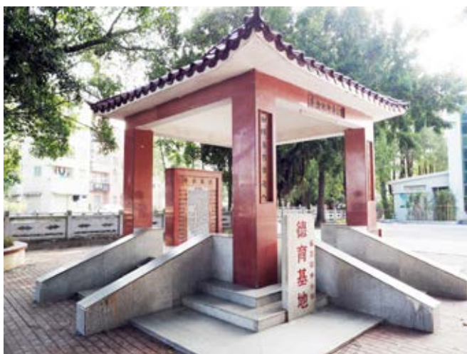
里溪革命纪念亭侧面 (黄春华摄于2020年12月)