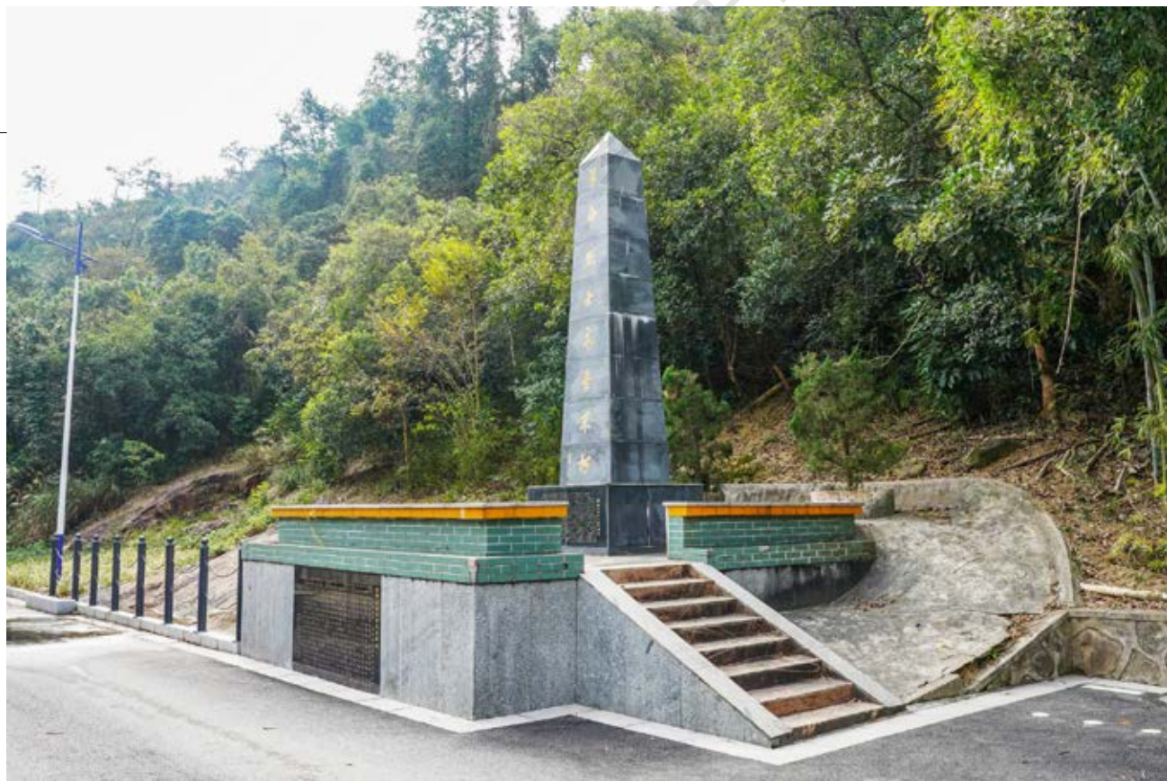
石莹桥十六烈士纪念碑侧面全景

他们被困于大石托山上的炭窑内，整整7天滴水未沾。为查明敌情，他们派一名队员下山侦察，顺便找点粮食。该队员刚下山就不幸被日军抓获。敌人立即派出大队人马搜山，另外15名队员因多日未进食，身体极度虚弱，无法转移而全部被俘。敌人将16名游击队员押解到石莹桥溪边的一块大石上，进行严刑逼供。但游击队员们英勇不屈，守口如瓶，拒绝透露游击队