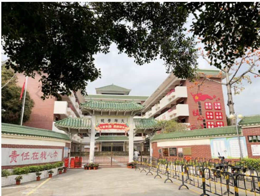
中共中山第五区区委活动旧址大布学校正门全景（黄春华摄于2021年3月）