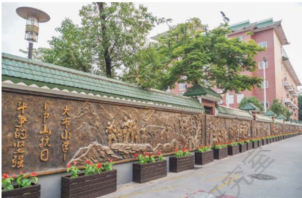
中共中山第五区区委活动旧址外墙反映当年革命斗争史的浮雕

向西南，砖混结构，为四柱三间歇山顶牌楼，宽约8米，厚约1.4米，面积约11平方米。门楼明间正面正中有校名“大布学校”匾牌，为民国时期曾任广东省省长的胡汉民于1935年冬题写。现旧址所在地为大布小学，