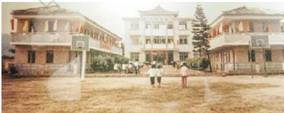
中共中山第五区区委活动旧址20世纪80年代时的校园旧貌（历史照片）

该旧址于2012年1月被中山市人民政府核定公布为中山市不可移动文物；2008年6月被中共中山市委核定公布为中山市革命遗址，并作为中共中山市委党史教育基地。