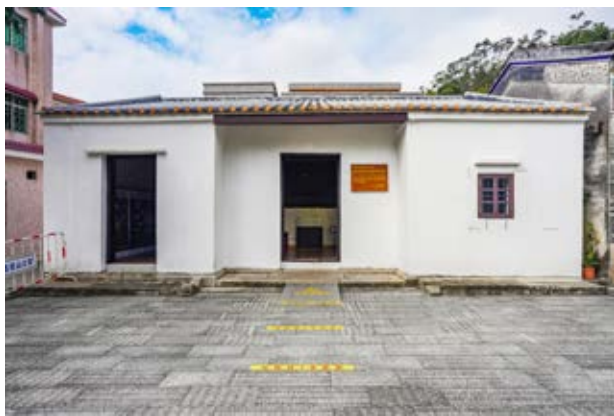
中山人民抗日义勇大队卫生站旧址

该旧址于2012年1月被中山市人民政府核定公布为中山市不可移动文物；2008年6月被中共中山市委核定公布为中山市革命遗址，并作为中共中山市委党史教育基地。