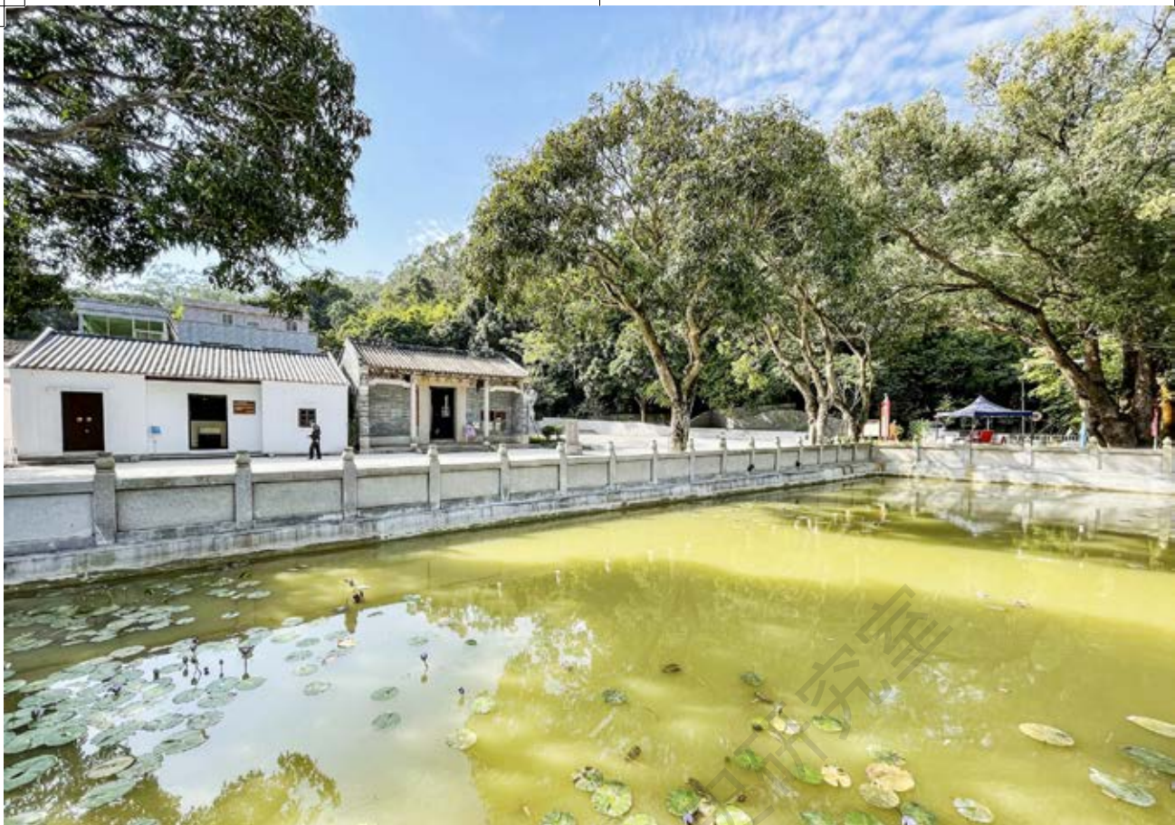
中山人民抗日义勇大队卫生站旧址周边全景