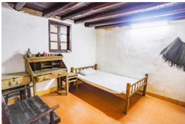
中山人民抗日义勇大队卫生站旧址内部复原场景一角