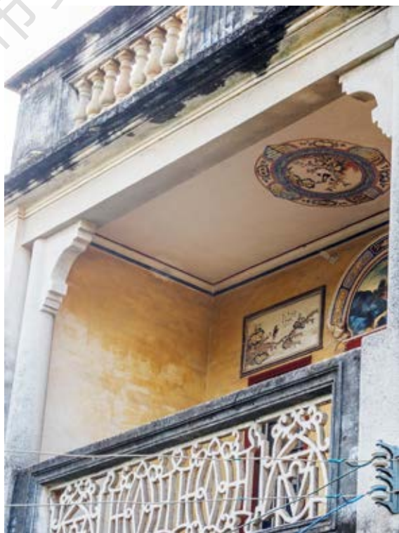
中共中山特派室活动旧址二楼阳台特写（黄春华摄于 2020 年 10 月）