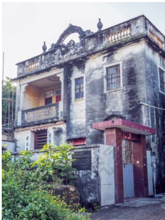
中共中山特派室活动旧址

该旧址于 2012 年 1 月被中山市人民政府核定公布为中山市不可移动文物；2008 年 6 月被中共中山市委核定公布为中山市革命遗址，并作为中共中山市委党史教育基地。