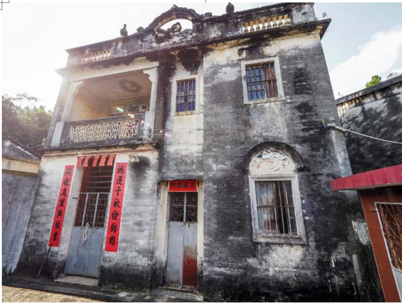
中共中山特派室活动旧址