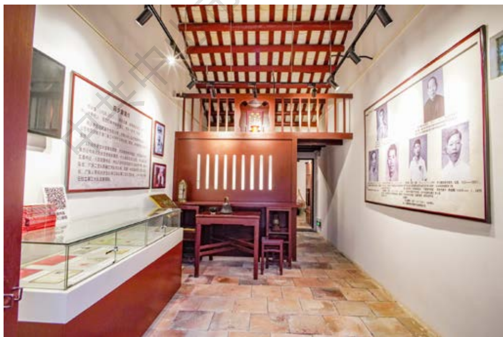
全面抗战时期中共中山本部县委交通联络站旧址内大厅展览全景