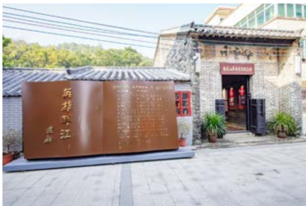
珠江纵队第一支队队部活动旧址坦洲镇月环金花山街37号房屋正面全景（黄春华摄于2022年1月）