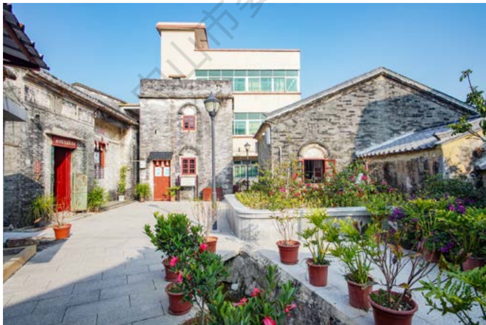
珠江纵队第一支队队部活动旧址坦洲镇月环金花山街13号碉楼（中）周边全景