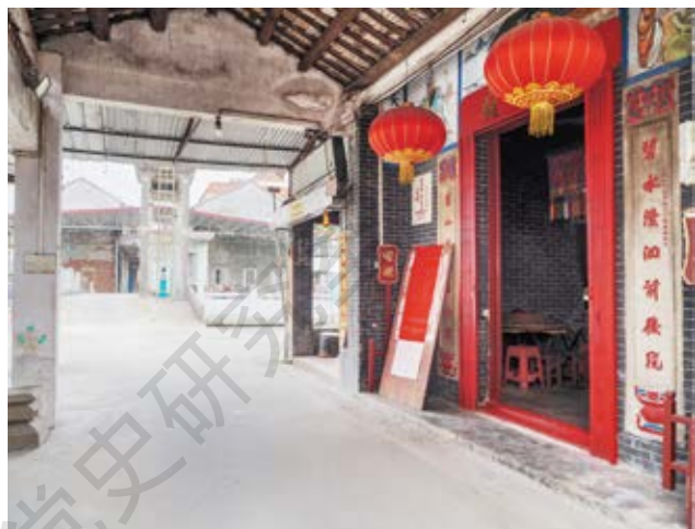
牛角村群众反“三征”集结地旧址牛王庙门口正侧面

斗争为中心，积极发动、团结群众并逐步扩大了活动范围，壮大了自身的力量。活动在低沙、牛角的党员梁健荣、苏英等率先组织骨干串联发动，先后组织了 3000 多名农民群众，在此集结，