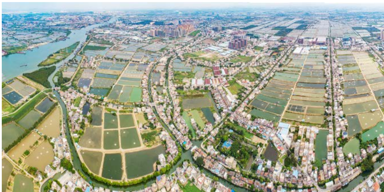
牛角村群众反“三征”集结地旧址所在地阜沙镇牛角村航拍全景

到区府请愿，抗议高额田赋。两村群众反“三征”斗争的胜利鼓舞了九区乃至全县广大人民不断起来反抗国民党的“三征”暴敛。