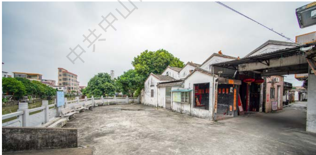
牛角村群众反“三征”集结地旧址周边全貌（黄春华摄于 2020 年 10 月）