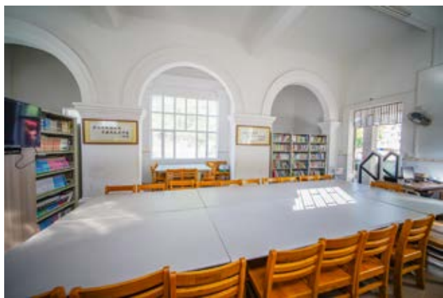
土地革命战争时期中共中山县支部成立旧址室内一角