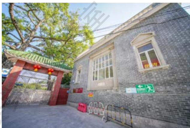
土地革命战争时期中共中山县支部成立旧址侧面（黄春华摄于2020年10月）

该旧址于2007年6月被中共中山市委核定公布为中山市革命遗址，并作为中共中山市委党史教育基地。