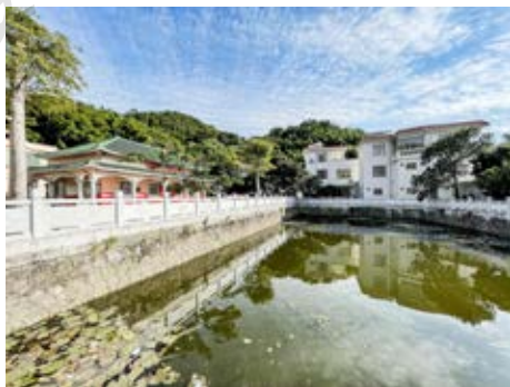
中山县行政督导处成立遗址周边环境

该遗址于2006年6月被中共中山市委核定公布为中山市革命遗址，并作为中共中山市委党史教育基地。