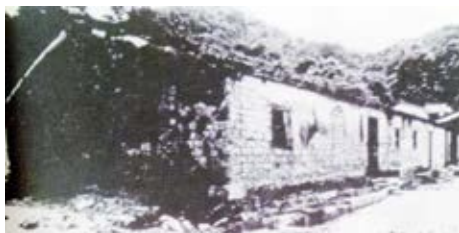
中山县行政督导处成立地原建筑（历史照片）