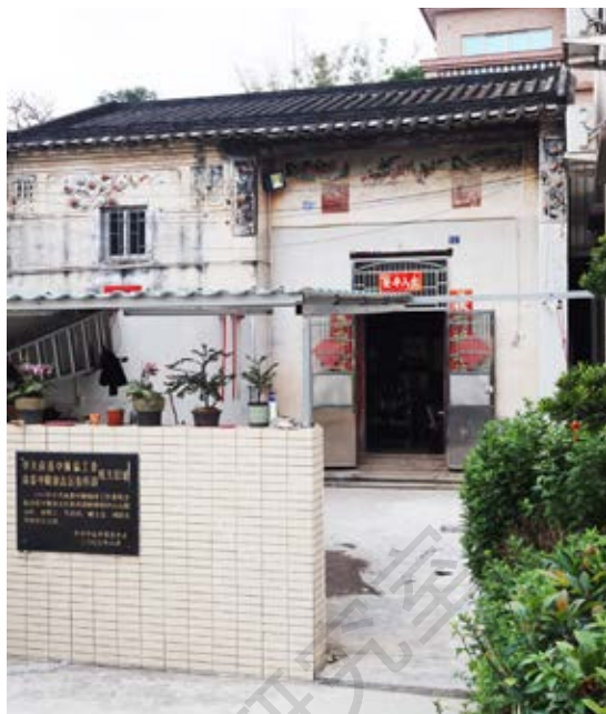
南番中顺游击区指挥部暨中共南番中顺临时工作委员会机关旧址正面

该旧址于2006年6月被中共中山市委核定公布为中山市革命遗址，并作为中共中山市委党史教育基地。