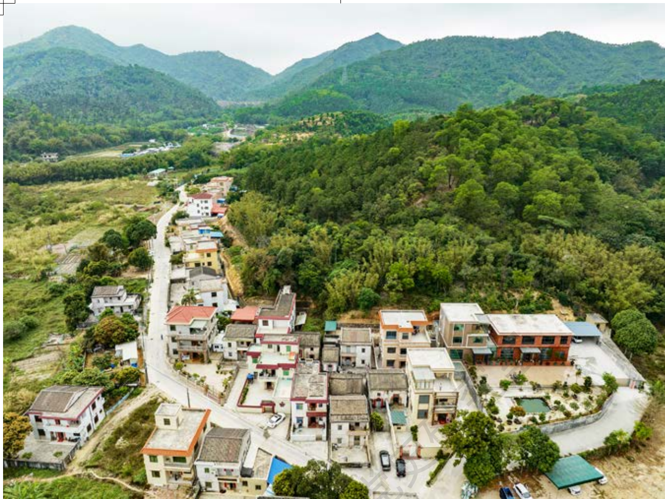
南番中顺游击区指挥部暨中共南番中顺临时工作委员会机关旧址所在地南朗街道白企行政村合里片区剑门牌自然村航拍俯瞰图