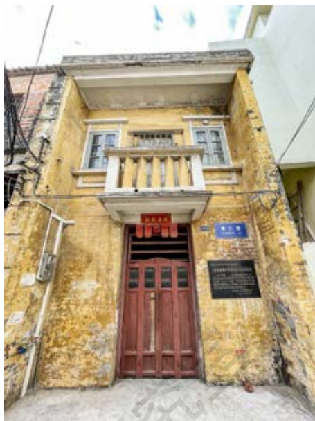
大革命时期中共中山县委开展活动的小楼房正面

该遗址原建筑建于民国时期，为砖混结构单进二层楼房，建筑占地面积58.41平方米，建筑面积102.88平方米，于2022年被拆毁改建。