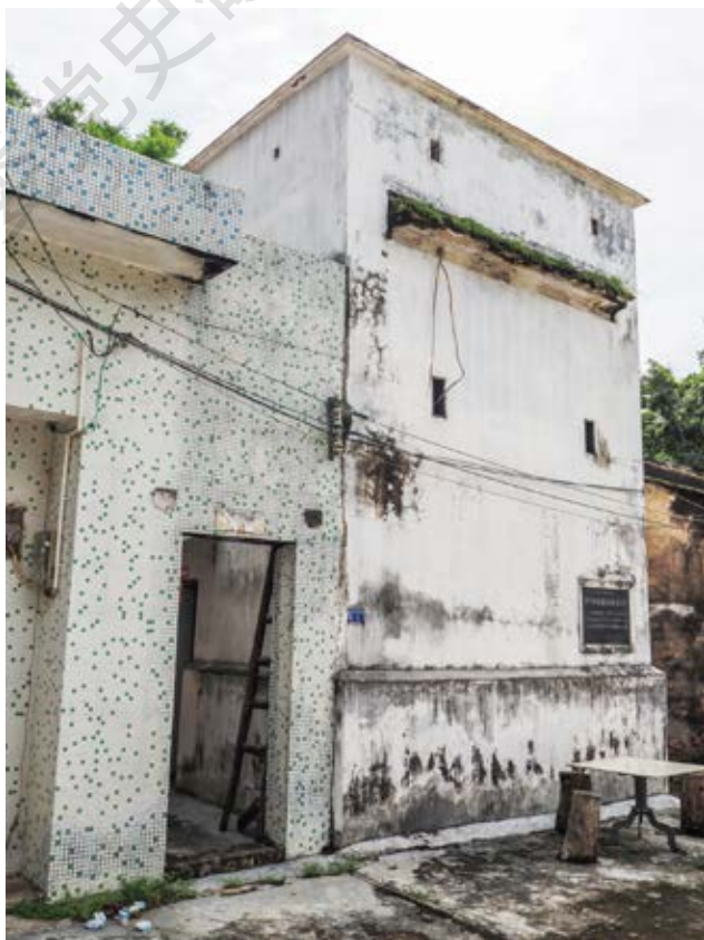
中共中山四区区委油印室旧址正面（左）及侧面（黄春华摄于2020年10月）