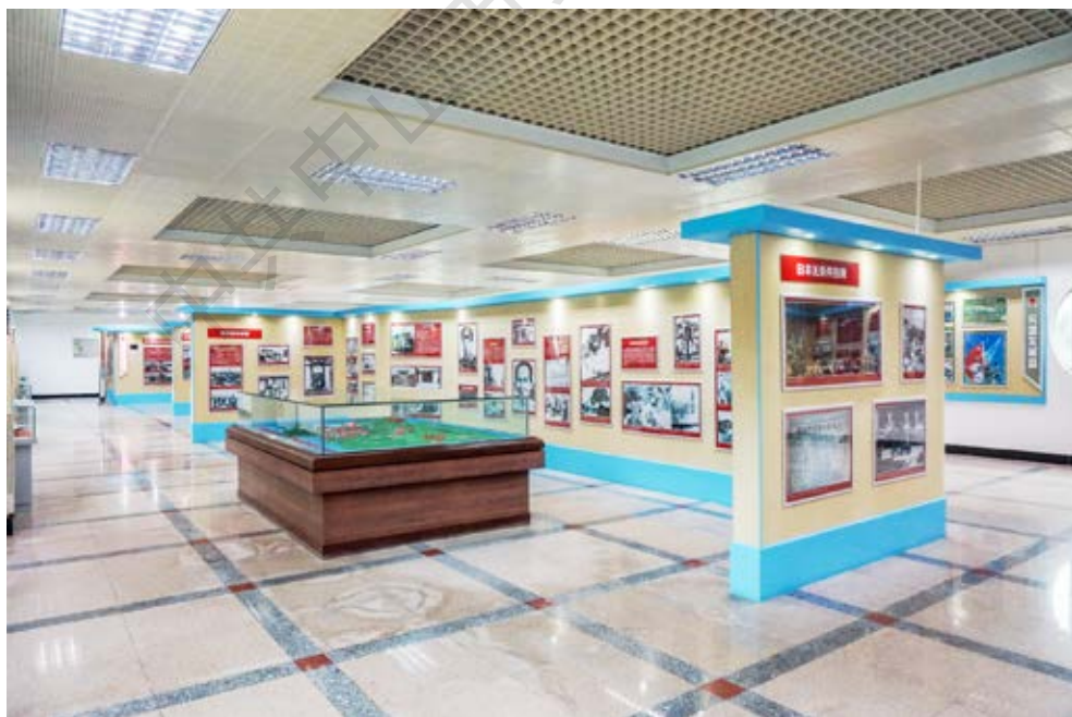
中山市国防教育展览第一展厅全景（《中山日报》记者摄于2020年4月）

地。中山市国防教育训练基地于2018年5月被中共中山市委宣传部、中山市精神文明建设委员会办公室公布为中山市爱国主义教育基地。