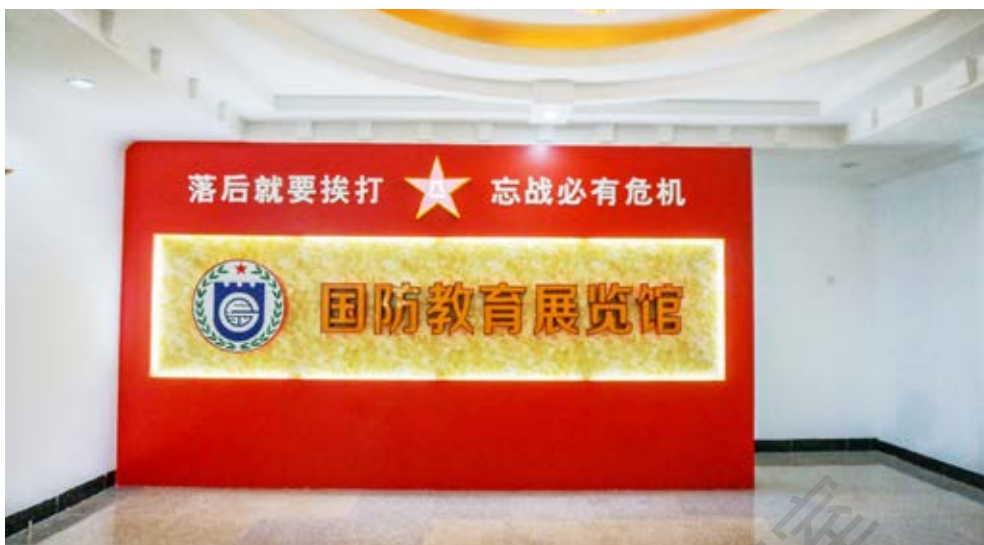
中山市国防教育展览入口处