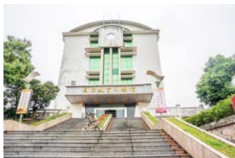
中山市国防教育展览设于中山市国防教育训练基地国防教育训练馆内

地。中山市国防教育训练基地于2018年5月被中共中山市委宣传部、中山市精神文明建设委员会办公室公布为中山市爱国主义教育基地。