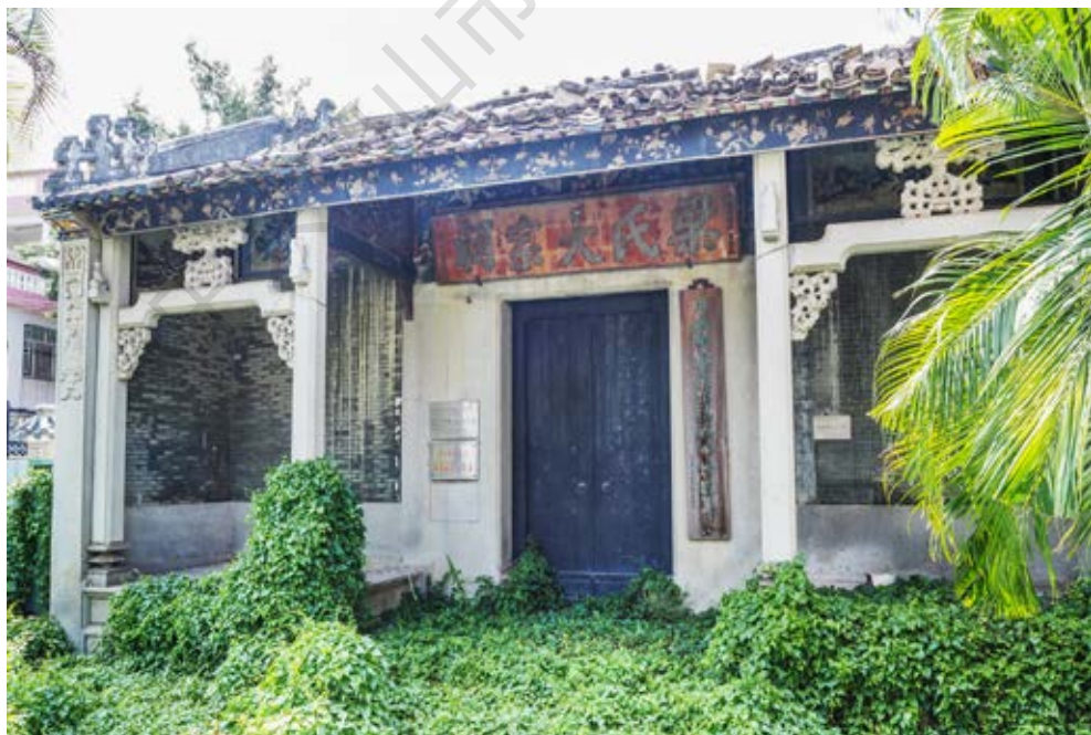
张溪梁氏大宗祠——张溪革命传统展览正侧面