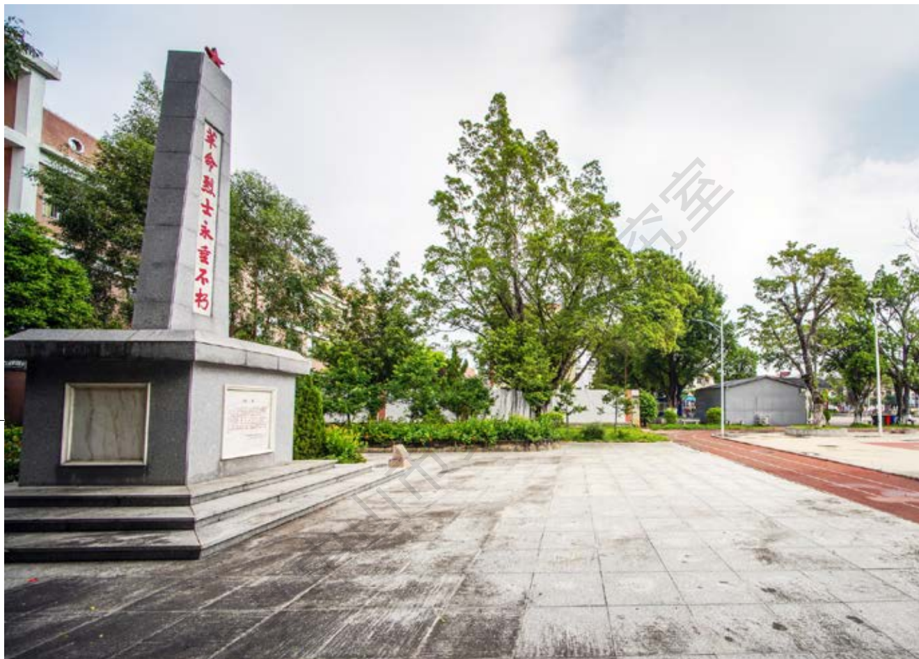
民众革命烈士纪念碑周边全景（黄春华摄于2020年10月）