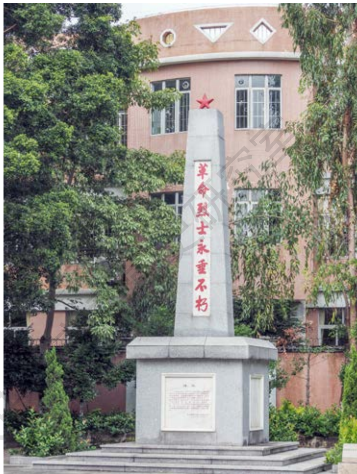
民众革命烈士纪念碑正面

该纪念碑坐西北向东南，建于1992年8月，由青砖砌成，外表以水泥砂浆覆盖，整体形状为梯形，高7.8米，面积约17平方米。碑身镶大理石，阴刻“革命烈士永垂不朽”字样，碑顶有一红五角星。碑座为正方形，边