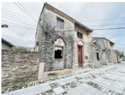
南番中顺游击区指挥部旧址田心四街6号楼正面外景