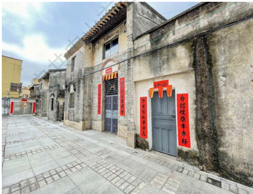
南番中顺游击区指挥部旧址（田心四街4、6、7号楼）外景

中共广东省临时委员会委员连贯以及机关工作人员黄康到中山指导工作时，也常在此落脚。1944年6月至7月，中共广东省临时委员会在五桂山区灯笼坑召集中共珠江特委和中区特委的地、县、区级干部学习及布置工作。与此同时，南番中顺游击区指挥部和