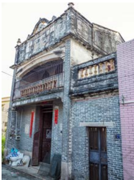
南番中顺游击区指挥部旧址田心四街5号、8号楼正面(黄春华摄于2020年10月)