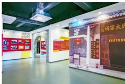
古四邓氏大宗祠附近设有古镇党史展览 （黄春华摄于2021年11月）