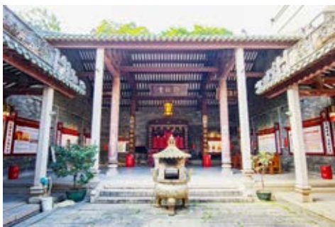
古四邓氏大宗祠——解放小榄集结地旧址 内部仰北堂全景