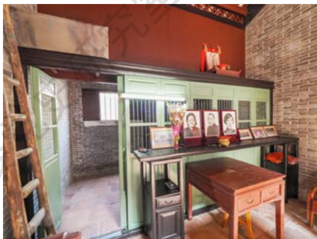
中国青年同盟中山支部旧址——孙康故居 室内大厅全景