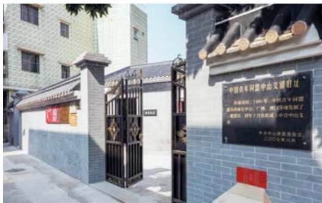
中国青年同盟中山支部旧址——孙康故居 围院外全景