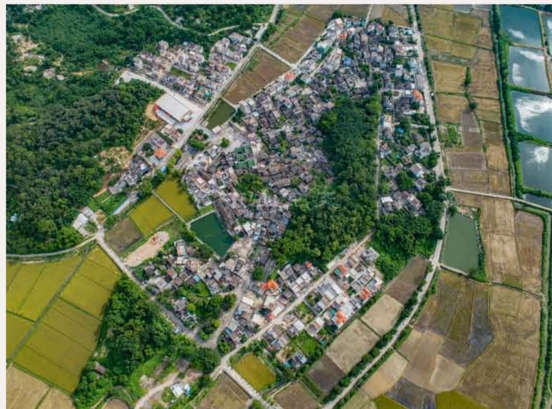
▲南朗街道冲口村俯瞰。（2019年6月）