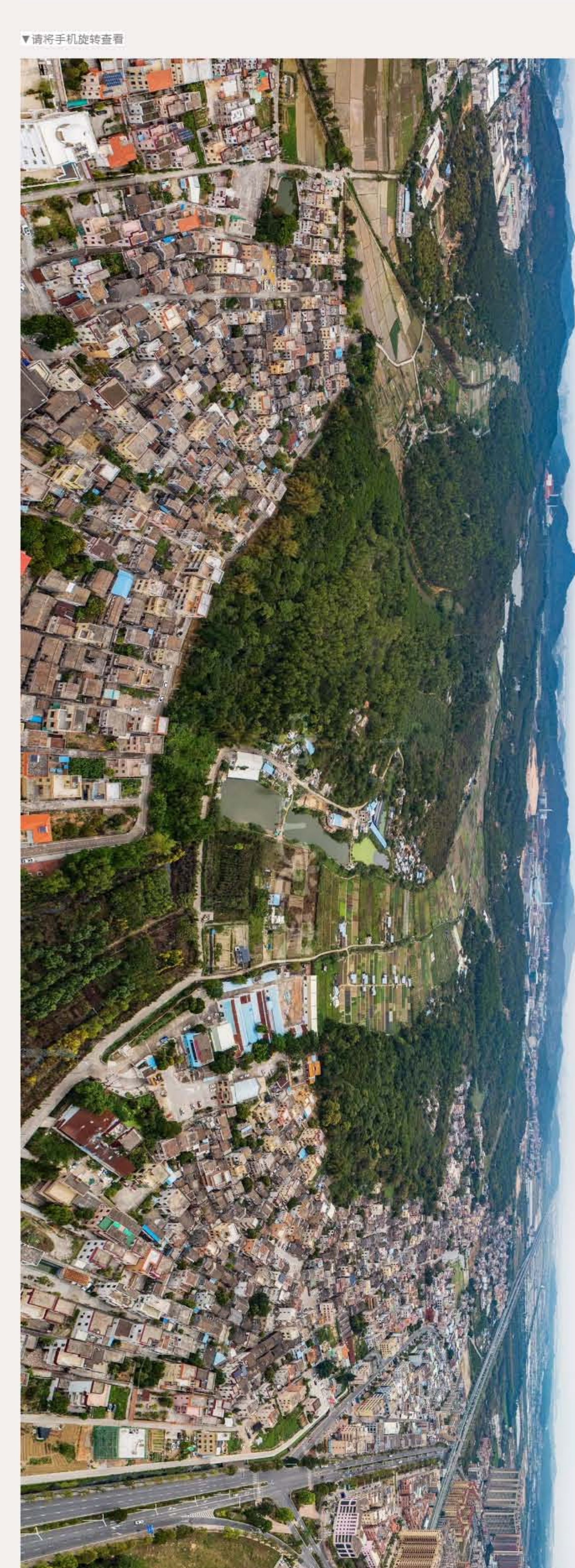
▲南朗街道大车村（左）和西江里村（右），稍远处山间村庄为嵩山村。黄春华摄（2020年3月）