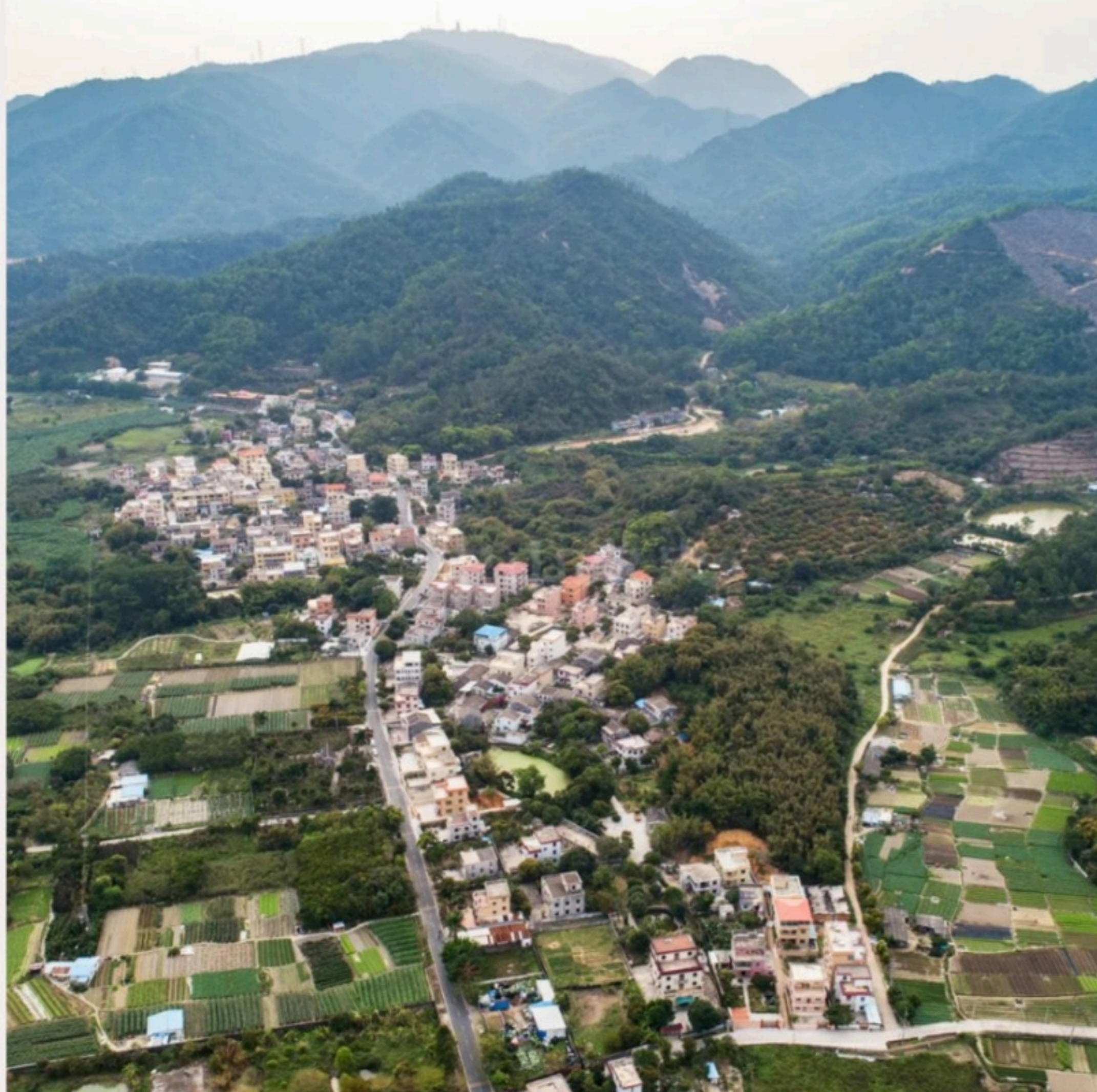
▲南朗街道翠亨行政村杨贺村，稍远处为田心村（圈左上）。黄春华摄（2020年3月）