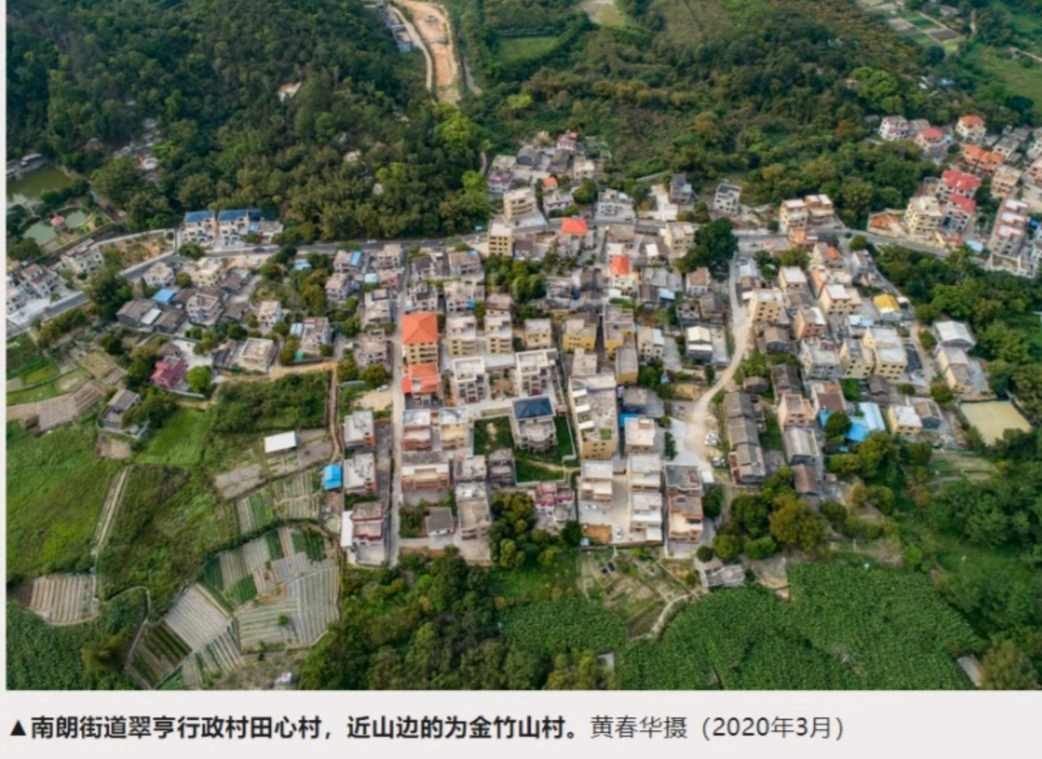
▲南朗街道翠亨行政村田心村，近山边的为金竹山村。黄春华摄（2020年3月）

甘伟光（1921—1993），曾任抗日民主政权中山县五桂山办事处副主任、凤凰山办事处主任，新会县长，恩平县县长，佛山专员公署文化局局长、地委办公室主任。