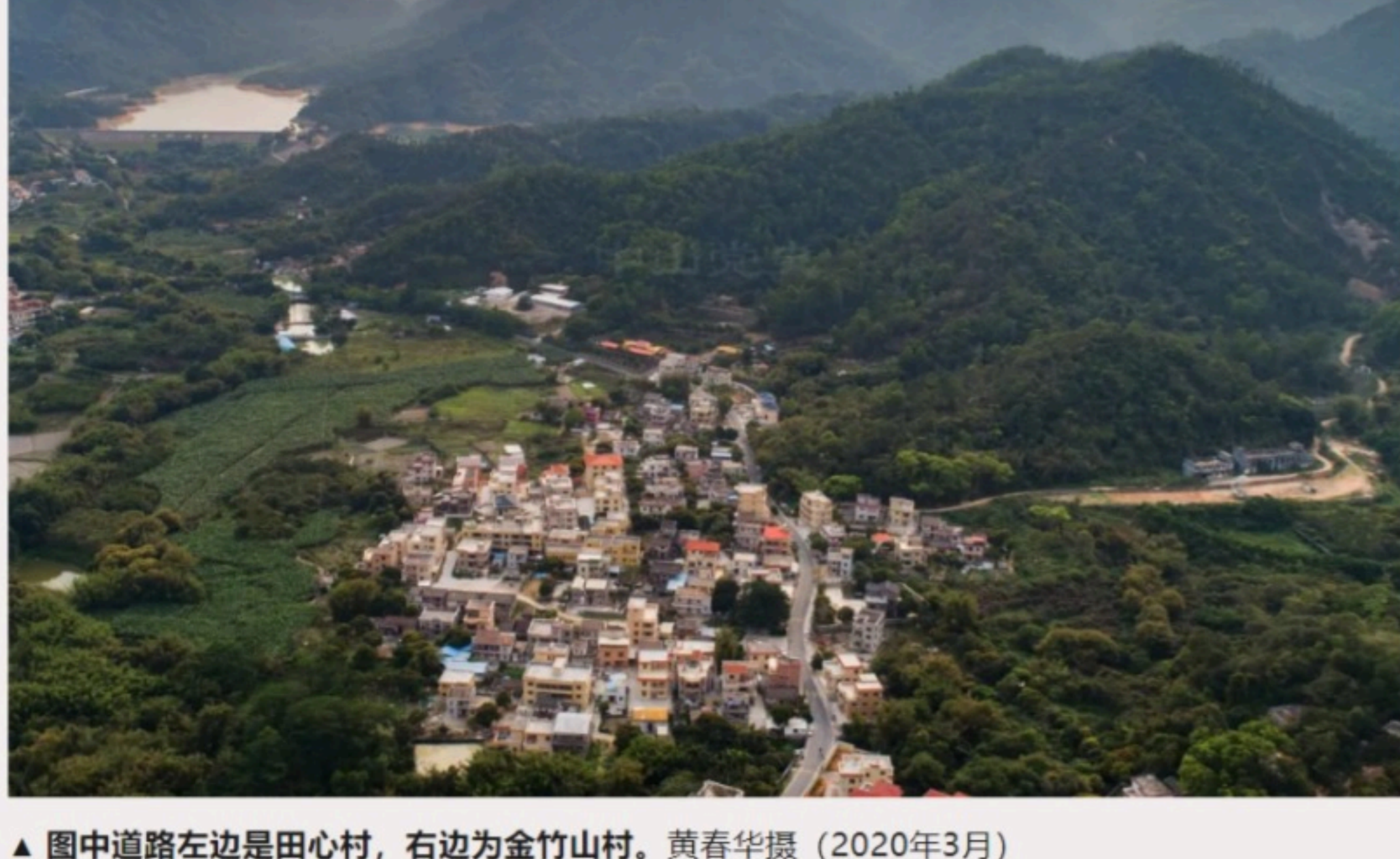
▲图中道路左边是田心村，右边为金竹山村。（2020年3月）