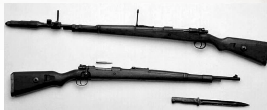
日军使用的“三八式”步枪，俗称“三八大盖”。

随着五桂山抗日根据地日益巩固，日、伪深感威胁，1943年冬，伪四十三师师长彭济华从石岐调派四个营兵力从四面包围五桂山区。为粉碎敌伪的四面包围，南番中顺游击区指挥部和中山抗日游击大队精心部署打击驻南朗日、伪军的战斗计划。