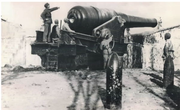
中国军队在淞沪会战中奋勇抗敌。