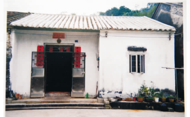
中山人民抗日义勇大队卫生站旧址。