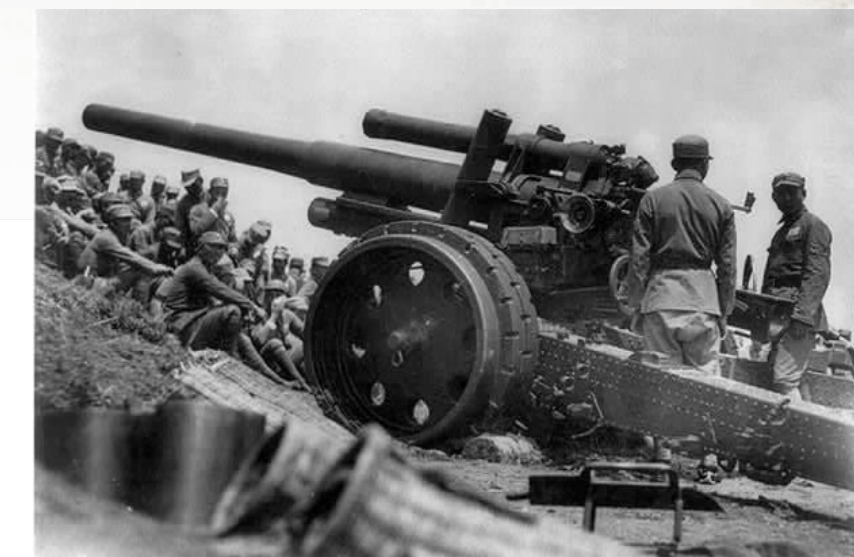
在南京保卫战中,当时的国军也有大口径炮。