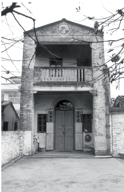
中山人民抗日义勇大队部活动旧址(黑白照片)