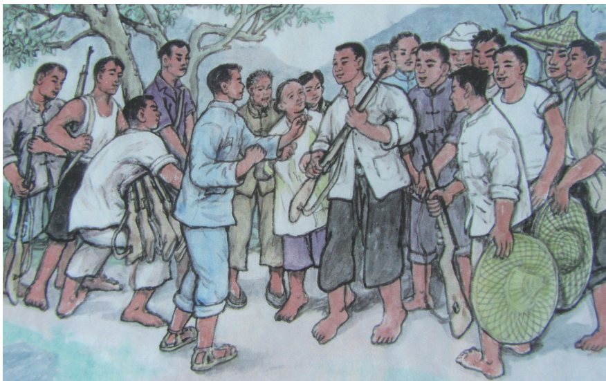
中山义勇大队在此期间，从 300 多人扩充至 1000 多人

在各级民主政权建立后，五桂山根据地积极开展地方的政治、经济、文化、教育、群众福利等方面的建设，受群众的赞扬和拥戴。这对加强军民团结，壮大抗日队伍，发挥群众的抗日积极性，均起到积极的促进作用。从而使抗日部队在敌伪围攻和严重天灾的艰苦日子里，能够克服重重困难，根据地一天比一天巩固。