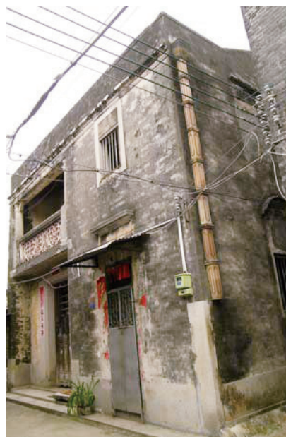
抗日民主政权五桂山区中心支部活动旧址