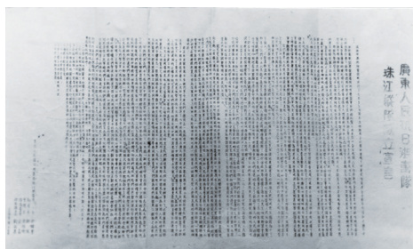
珠江纵队成立宣言

自珠江纵队第一支队成立后，由于正确地执行党的方针政策，坚持统一战线，团结爱国民众，赢得了多次战斗的胜利，活动范围不断扩大，武器装备不断改善，部队战斗力不断加强，在此恶劣的条件下巩固了五桂山区抗日根据地。至1945年3月，珠纵第一支队兵力扩充了一倍多。1945年5月开始，