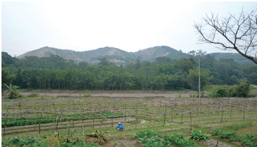
三山虎山抗日斗争遗址

三山虎山战斗，猛虎队、民权队英勇顽强，以少胜多，圆满完成了阻击来犯日伪军的任务，为珠纵司令部与第一支队机关转移取得了时间。