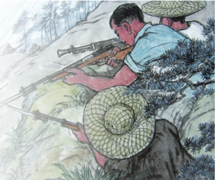
珠江纵队第一支队在五桂山根据地多次阻击日、伪军的“扫荡”

于五桂山东北面，进一步加强敌后抗日斗争。1945年3月18日晚，珠纵第一支队民族、雪花、马成三个中队联合出击前山伪联防中队和古鹤伪五区中队。当晚，游击队在前山和古鹤两个伪据点同时发起进攻时，40多名伪军还在睡梦中，因而仅7分钟就结束战斗。