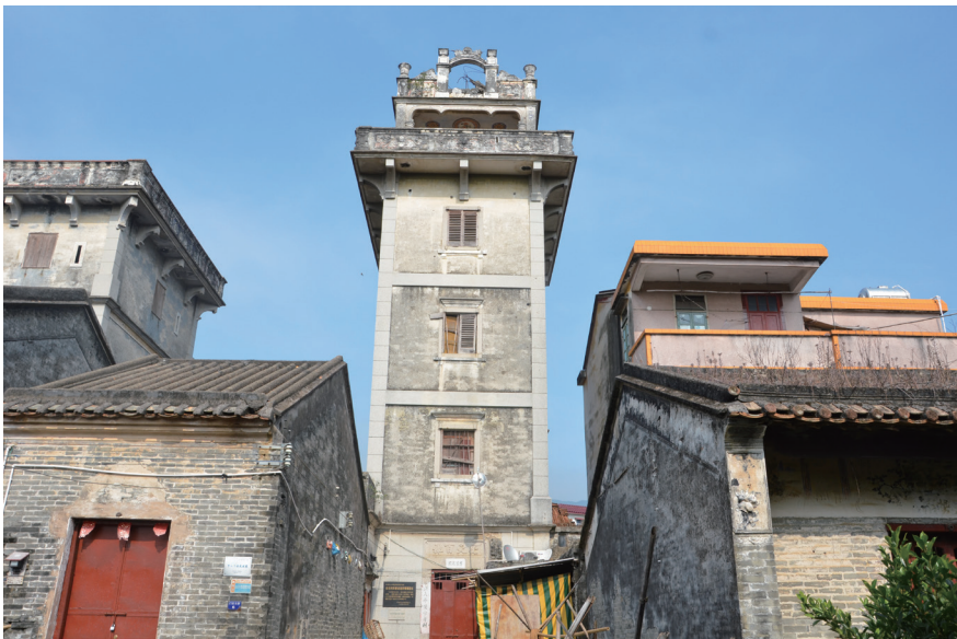
白石防御战指挥碉楼旧址

1944年7月3日，南番中游击区指1945年5月8日深夜开始，日军1000多人，伪军第3000人，共4000多人分六