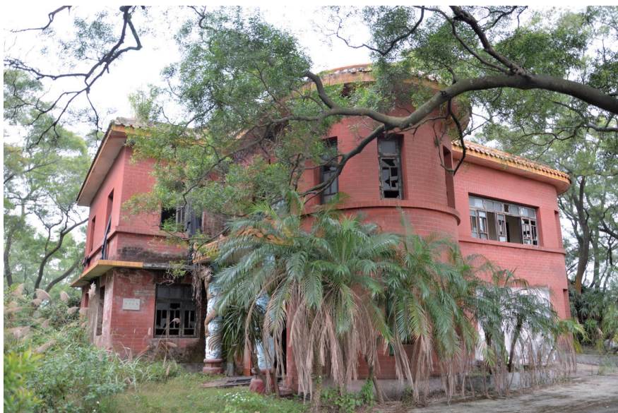
翠亨红楼——珠纵一支队歼灭日军据点遗址

其时,在中山的日军有2000至3000人,伪军第四十三师等3000多人,伪联防队几千人,分别驻守在石岐、唐家、恒美、麻子、西樵、雍陌、湾仔、前山、金斗湾等地,形成了对五桂山的包围。而中区纵队主力部队挺进粤中后,留守五桂山根据地的部队只剩下300多人,于是敌人趁虚而入。日、伪军同时还勾结国军顽固派和海盗山匪,不断袭击游击队,杀害民主政权干部,攻打民兵;伪军步步紧逼,扩大其势力范围。为配合盟军登陆,进一步打击敌伪的军事活动,珠江纵队司令部根据斗争形势和五桂山区的地理环境,决定由纵队司令员林锵云和第一支队政委梁奇达留守五桂山,广泛活动