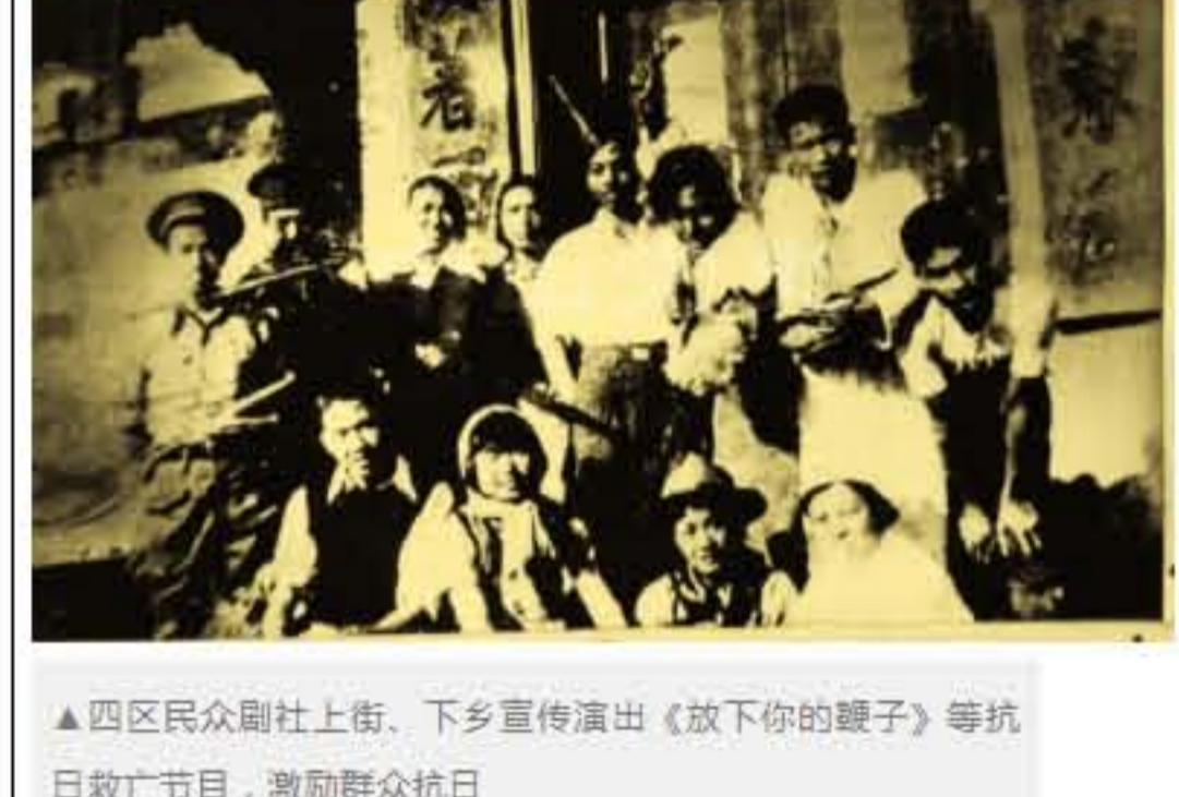
▲四区民众剧社上街、下乡宣传演出《放下你的鞭子》等抗日救亡节目，激励群众抗日

日军的罪恶行径激起了中山群众的无比愤慨，街头巷尾，乃至“小贩、车夫，都在切齿地谈着敌人的残暴”。1938年5月4日，中山7000余名学生举行纪念“五四”化妆大游行，石岐城区群众的抗日情绪高涨。可就在当天傍晚5时30分间，城内响起警报，正在吃晚饭的群众不及走避，“敌机的机枪响了，炸弹响了！”这是日军飞机在中山县城的第一次空袭，造成60多人死伤。