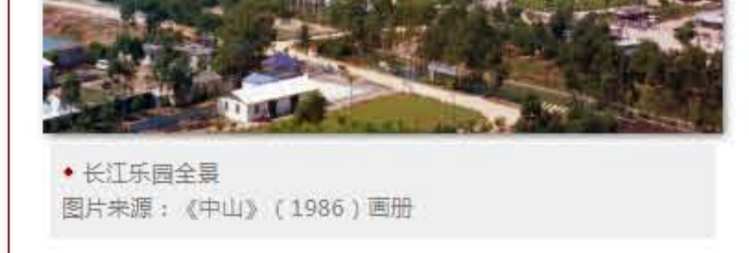
长江乐园全景