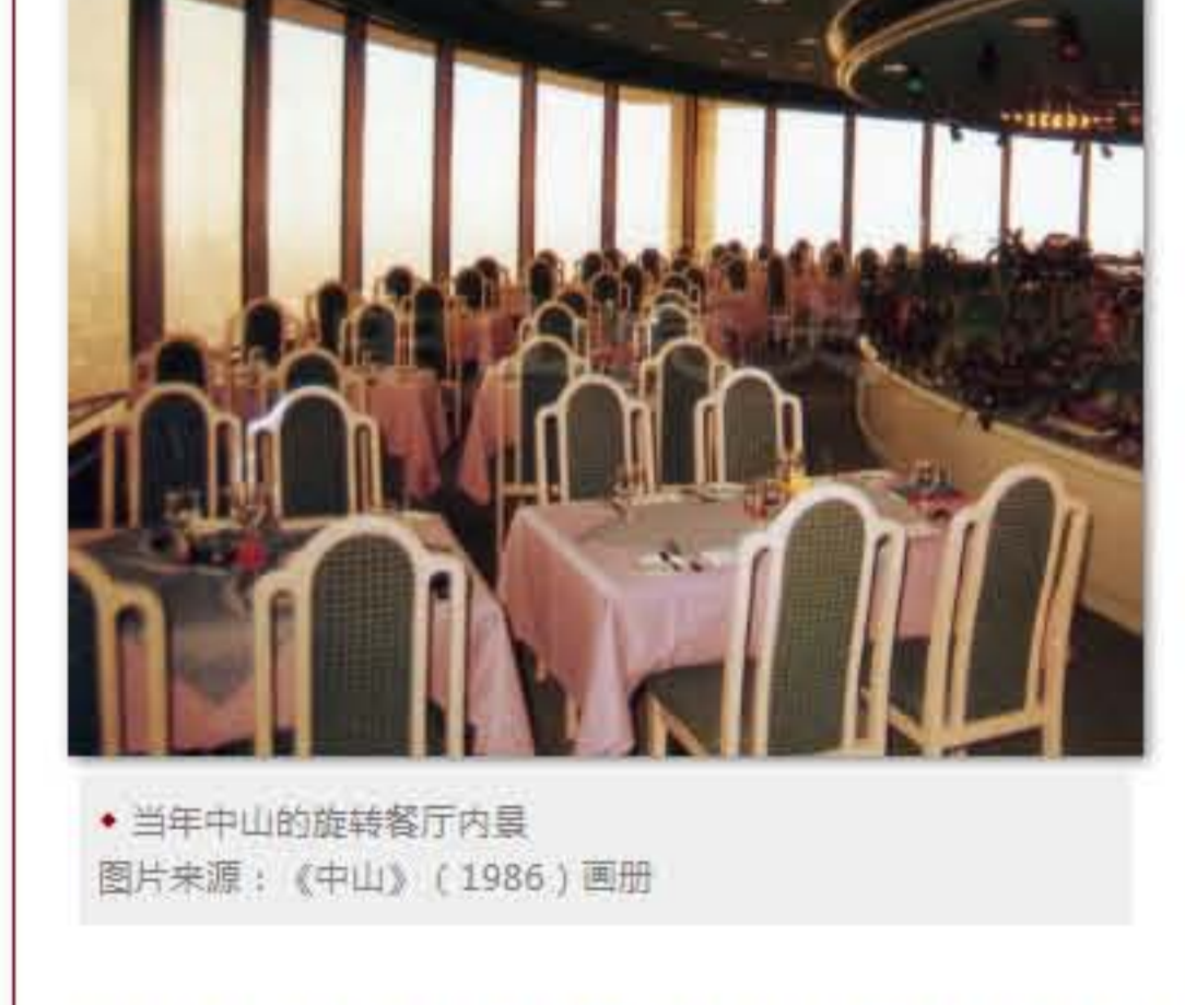
当年中山的旋转餐厅内景

旅游业对中山经济的带动作用明显的，正如《人民日报》1984年6月22日发表的文章《中山：客人超过主人》所言：中山市旅游事业的发展，使50多万华侨和港澳同胞“游子思故乡”的感情得到满足，他们不仅来旅游参观，还积极帮助家乡锦上添花，捐资建学校、办医院、修筑桥梁和道路、兴办幼儿园。在市区石岐的一幢九层楼的医疗大楼和在近年的孙中山先生纪念馆，就是香港同胞杨志云先生和郭得胜先生在近年分别捐资1000万港元兴建起来的；有的积极投资办企业，去年仅签订来料加工合同就有1100多项，使全市“三来一补”企业又有新发展，一年收入加工费1000多万美元，这在广东省仅次于东莞。……这几年中山市旅游业促进了工农业商品生产的大发展，工农业总产值去年增加到14.5亿元，比1978年的7亿元翻了一番多。