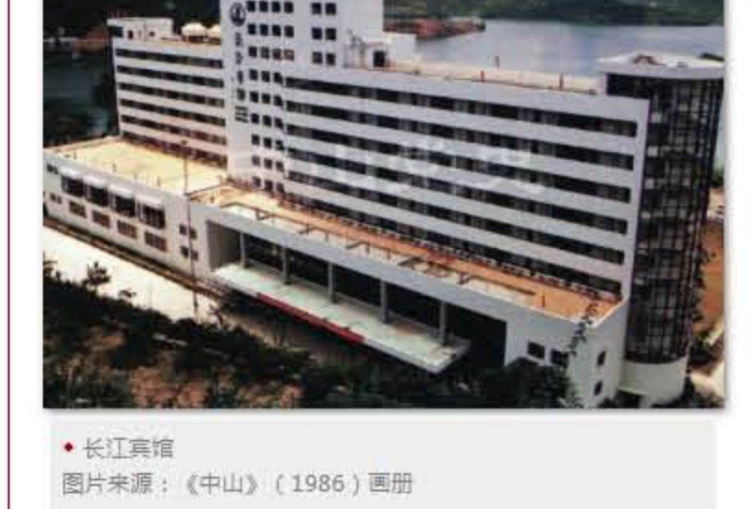
长江宾馆