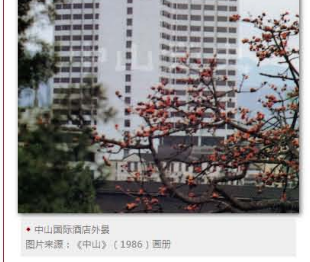
中山国际酒店外景