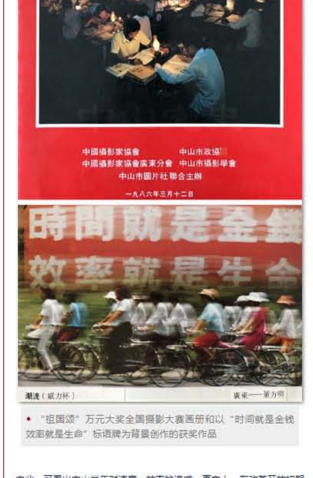
“祖国颂”万元大奖全国摄影大赛画面和以“时间就是金钱 效率就是生命”标语牌为背景创作的获奖作品

1984年，中山市组织了“祖国颂”全国第一个万元大奖摄影比赛，轰动全国，其中获得“威力杯”大奖的作品题为《潮流》，以深圳这个著名的“时间就是金钱 效率就是生命”标语牌为背景进行创作。