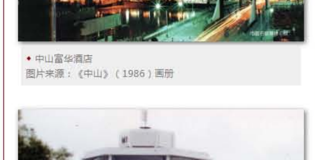
中山富华酒店

随着中山旅游业的兴旺繁荣、外经贸业务的拓展，以及改革开放后返乡港澳同胞、侨胞的增多，一批现代化酒店雨后春笋般建设起来。至1984年，已经开业的高档宾馆有中山温泉宾馆、华侨大厦二期（即今富华酒店副楼）、中山大厦（现已拆除重建，在国际酒店东北侧）、石岐宾馆（现为万业酒店）和西郊宾馆（后更名为铁城酒店、宜必思酒店）；正在兴建的大型宾馆有：中山国际酒店、富华酒店、中山酒店（位于今香山酒店旁，现已拆除）、长江宾馆（即后来的怡景假日酒店）、翠亨宾馆（翠亨大道旁，孙中山故居对面）、京华酒店（已拆除重建，名字继续沿用），以及扩建中的菊城酒店。特别是中山国际酒店和富华酒店，直线距离仅200米，且顶层都设置了旋转餐厅，港澳媒体称这或许是一项吉尼斯世界纪录。