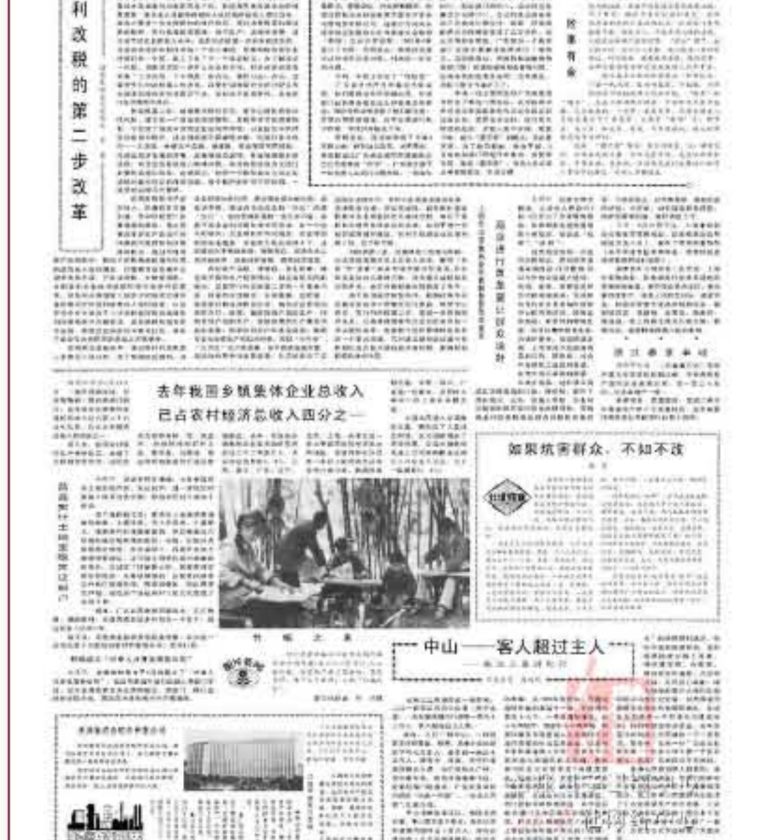
《人民日报》1984年6月22日第二版发表文章《中山——客人超过主人》

旅游业对中山经济的带动作用明显的，正如《人民日报》1984年6月22日发表的文章《中山：客人超过主人》所言：中山市旅游事业的发展，使50多万华侨和港澳同胞“游子思故乡”的感情得到满足，他们不仅来旅游参观，还积极帮助家乡锦上添花，捐资建学校、办医院、修筑桥梁和道路、兴办幼儿园。在市区石岐的一幢九层楼的医疗大楼和在近年的孙中山先生纪念馆，就是香港同胞杨志云先生和郭得胜先生在近年分别捐资1000万港元兴建起来的；有的积极投资办企业，去年仅签订来料加工合同就有1100多项，使全市“三来一补”企业又有新发展，一年收入加工费1000多万美元，这在广东省仅次于东莞。……这几年中山市旅游业促进了工农业商品生产的大发展，工农业总产值去年增加到14.5亿元，比1978年的7亿元翻了一番多。