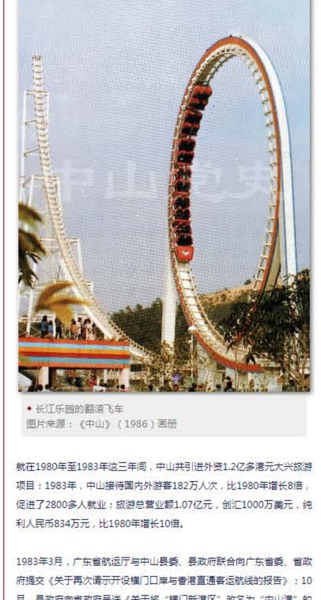
长江乐园的翻滚飞车

就在1980年至1983年这三年间，中山共引进外资1.2亿多港元大兴旅游项目；1983年，中山接待国内外游客182万人次，比1980年增长8倍，促进了2800多人就业；旅游总营业额1.07亿元，创汇1000万美元，纯利人民币834万元，比1980年增长10倍。