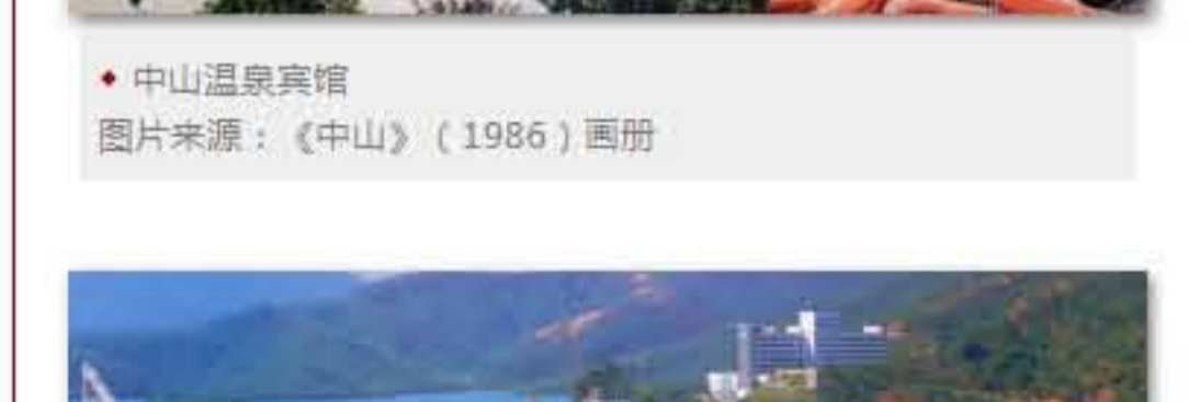
中山温泉宾馆

当年，中山大刀阔斧地改革开放、引进外资，是从发展旅游事业起步的。从1978年10月成立“建设中山温泉指挥部”，到1979年7月县委对霍英东、何贤等港澳知名人士提出的协议反馈修改意见，到8月广东省对外经济技术联络办公室批复，再到11月27日举行动工仪式，1980年12月28日竣工开业，“前无古人”的中山温泉宾馆项目从决策到完成审批流程用了不到一年，而建设也只用了半年。港澳人士对这个速度的评价是，不仅在港澳，就是在世界上也是少见的。仅1981年1月10日到4月中旬这3个月里，住宿者就达1万多人次；到此旅游的港澳同胞、侨胞约15万人次；总收入约合人民币100万元，纯利约14万元。此后，1983年7月15日中山长江乐园迅速建成开业，开全国先河，轰动粤港澳，引发一股追捧热潮。