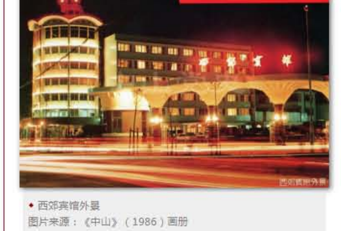
西郊宾馆外景