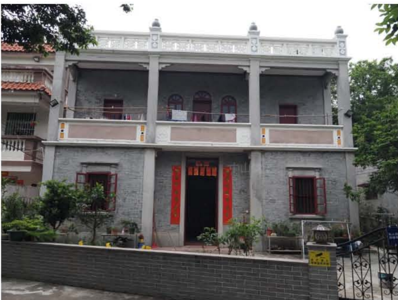
南番中顺游击区指挥部政治部和中区纵队政治部旧址

广东人民抗日游击队珠江纵队是抗日战争时期中国共产党在珠江三角洲敌后建立的一支人民抗日武装。中国共产党在珠江三角洲地区成立的顺德抗日游击队、中山人民抗日游击队，加上逐步改编的广州市区游击第二支队部分队伍，是珠江纵队的前身。在抗日游击战争中，这支部队由几十人发展至近3000人，成为华南敌后抗战的一股重要力量。