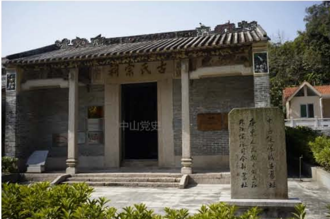
广东人民抗日游击队珠江纵队司令部旧址。

9月3日，为隆重纪念中国人民抗日战争暨世界反法西斯战争胜利75周年，国务院公布第三批80处国家级抗战纪念设施、遗址名录，位于中山市五桂山街道南桥村樵山14号（古氏宗祠）的 广东人民抗日游击队珠江纵队司令部旧址 入选，是广东省入选名录的两个纪念设施、遗址之一。