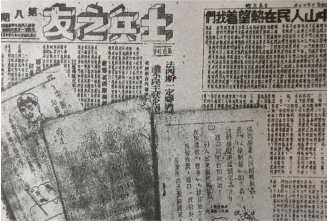
珠江纵队第一支队编印的《士兵之友》。

珠江纵队及其前身各时期的组织建制为：1942年6月至1943年1月，中共南番中顺中心县委领导下的人民抗日游击队；1943年2月至1944年9月，南番中顺游击区指挥部；1944年10月至12月，中区纵队；1945年1月至1946年6月，广东人民抗日游击队珠江纵队。