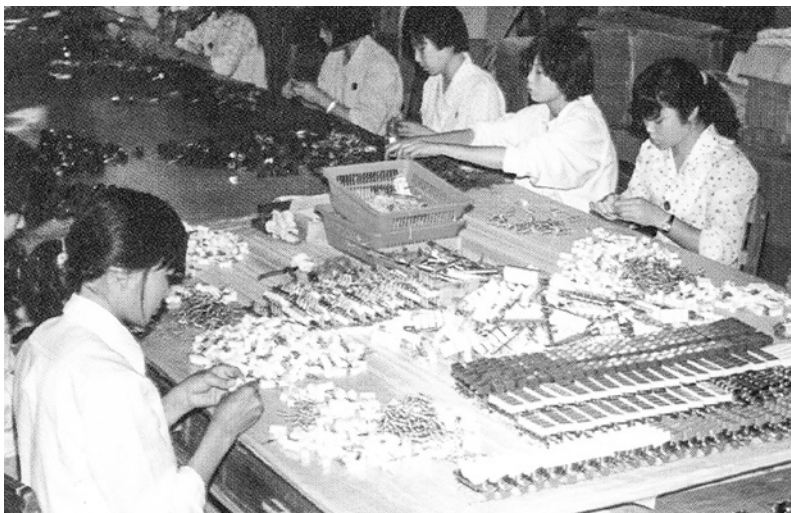
小榄镇开关厂制品远销国内外（引自《中山（1986）》画册）

1984年对乡镇企业而言是个意义重大的年份。这一年，中央1号和4号文件对乡镇企业的地位和作用作出充分肯定和高度评价，